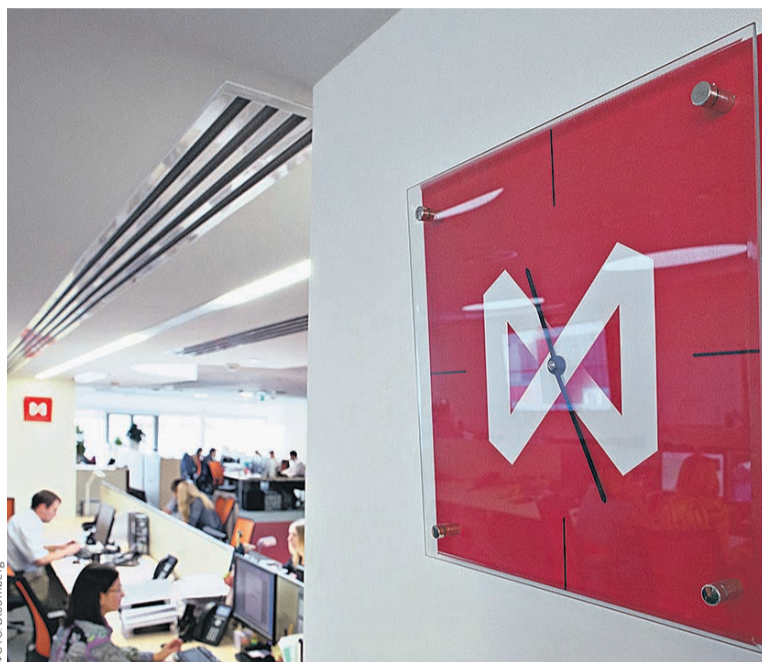
В сентябре Московская биржа пережила сразу три крупных сбоя, а еще в одном случае биржа почти час не транслировала ряд индексов