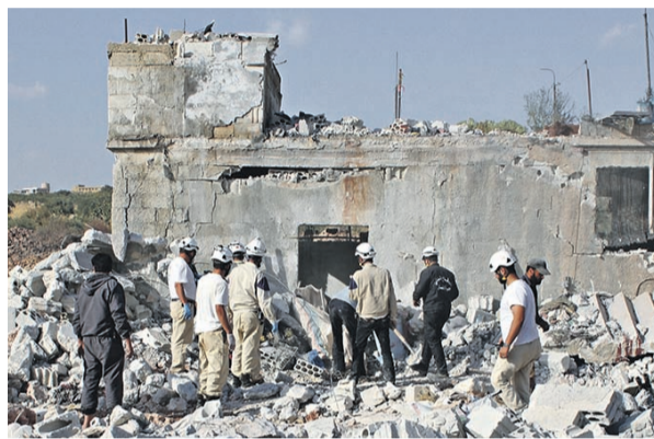
← На месте бомбового удара российских самолетов в местечке Джабаль-аз-Завия в провинции Идлиб

а также ракету X-29L класса «воздух-поверхность» с лазерным наведением (на вооружении с 1980 года).