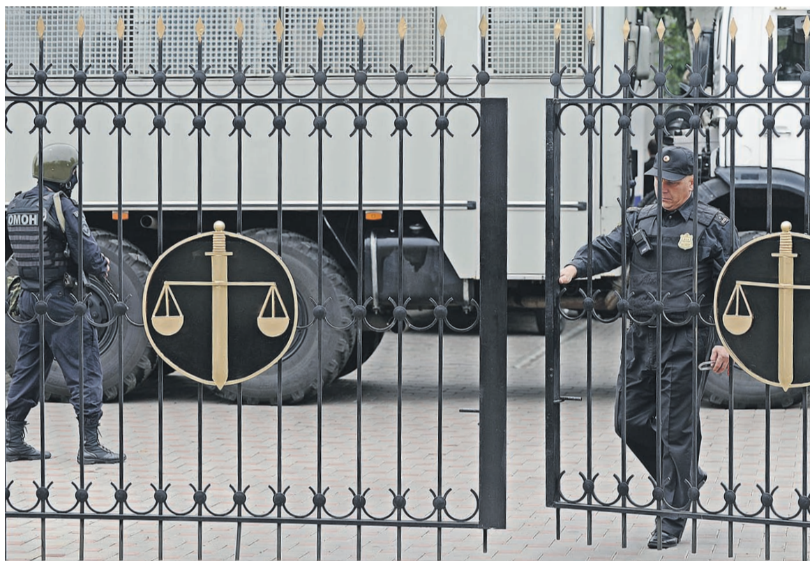
Рост дел в отношении взяткодателей может быть связан с провокациями со стороны правоохранительных органов