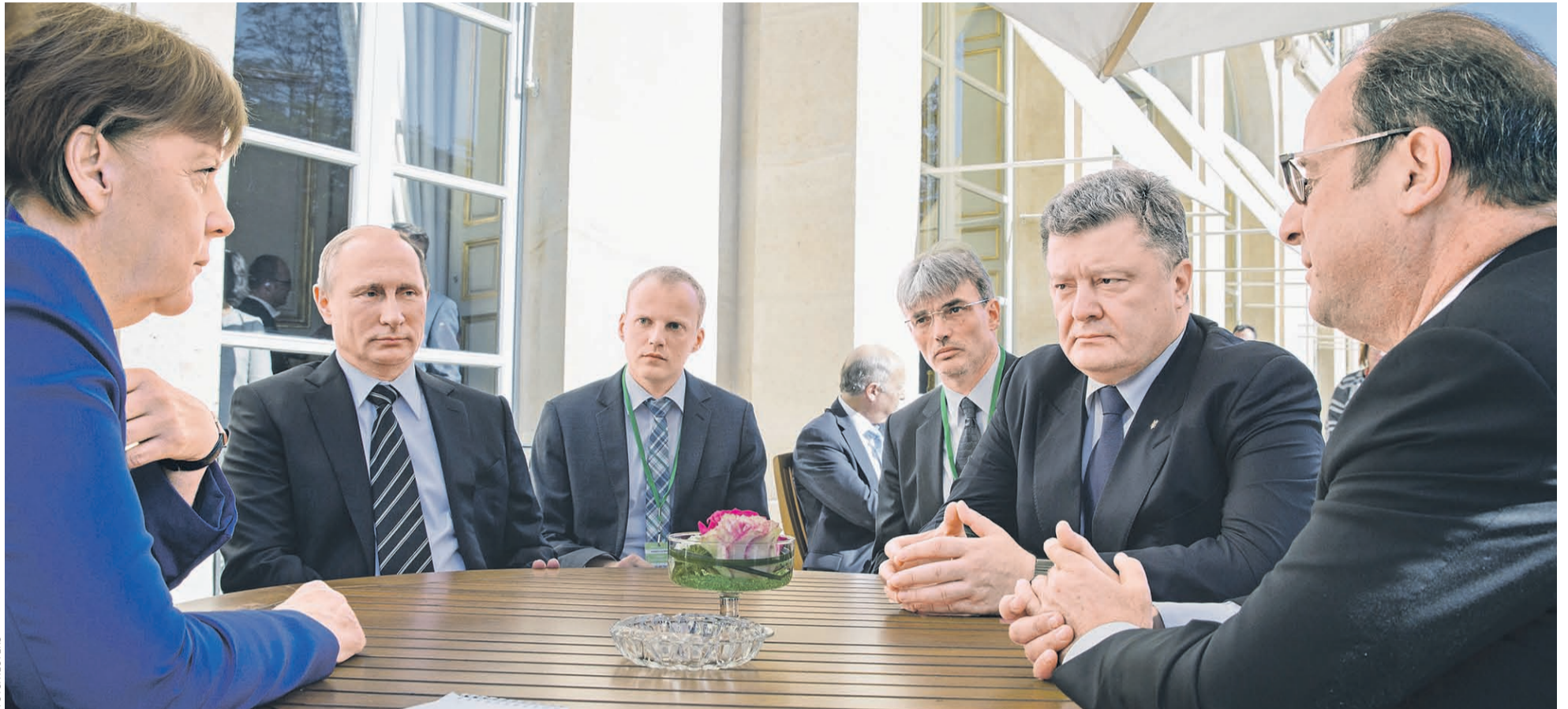
По итогам встречи Франсуа Олланд (справа) и Ангела Меркель (слева) заявили о «подвижках» в переговорном процессе и некотором сближении в позициях Петра Порошенко и Владимира Путина (вторым справа и вторым слева)

Голосование в ДНР и ЛНР стало основным спорным вопросом на встрече «нормандской четверки»