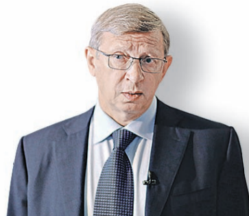
Владимир Евтушенков, владелец АФК «Система»

Доля в «Медси» может быть продана стратегическому инвестору