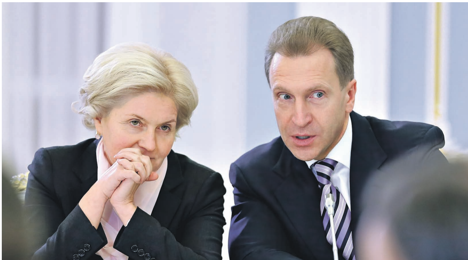
Спор социального блока правительства с экономическим об индексации пенсий завершен. На очереди — заморозка накоплений и повышение пенсионного возраста (на фото — социальный вице-премьер Ольга Голодец и экономический вице-премьер Игорь Шувалов)

ПЕТР НЕТРЕБА, СИРАНУШ ШАРОЯН, ИВАН ТКАЧЕВ