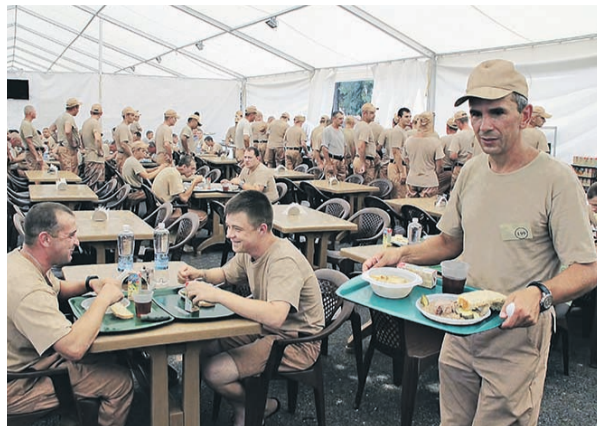
← За последние три дня российские летчики совершили около 60 вылетов. На фото — в столовой на авиабазе Хмеймим