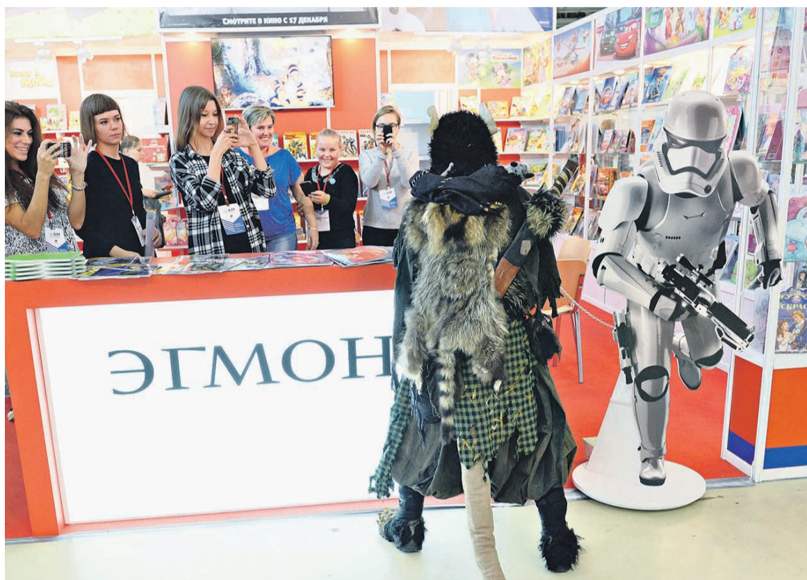
Оборот российского отделения Egmont, издающего книги и журналы про Лунтика, Барби и других популярных персонажей, в 2014 году составил 1,66 млрд рублей

Egmont вышла на российский рынок еще в конце 1980-х, создав СП с издательством «Физкультура и спорт», потом, в 1992 году, открылось полноценное представительство датского концерна, напоминает Елин. По его словам, российский бизнес прибылен,