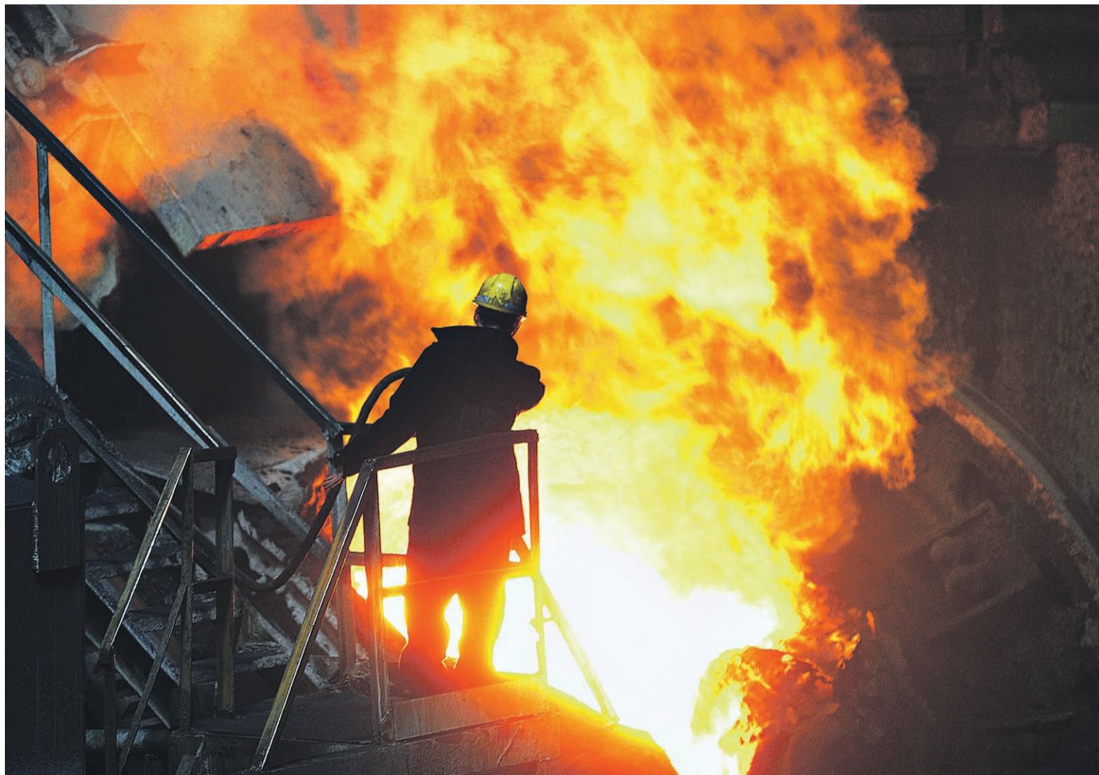
За первое полугодие 2015 года «Норильский никель» заплатил 32,7 млрд руб. НДС — это не более 1,5% от годовой выручки компании. (На фото — плавильный цех на Медном заводе ГК «Норильский никель»)