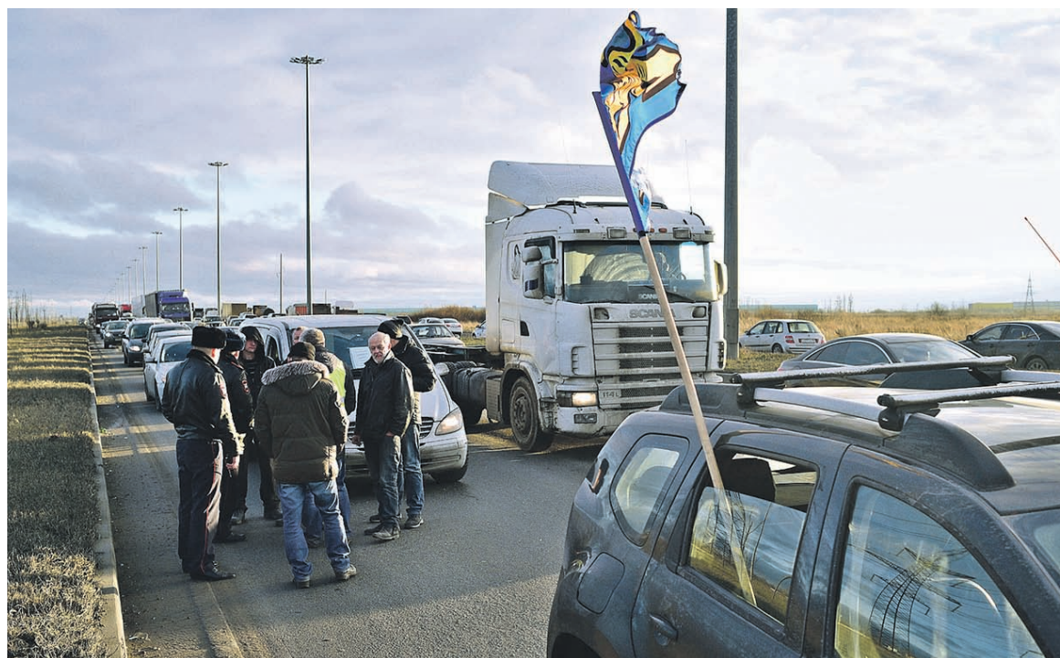
Полиция пытается препятствовать акциям дальнбойщиков, но они намерены добираться до Москвы объездными путями

В субботу в Петербурге состоялась встреча водителей с главой Минтранса Максимом Соколовым, на которую не пустили делегатов организации. «С министром встречались подставные люди, а не пред-