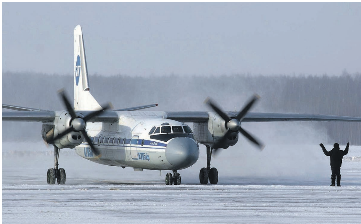
Ан-24, разработанный еще в СССР, до сих пор незаменим для базирующихся на севере авиакомпаний

Возраст самолета, по мнению профессионалов, не отражается на его техническом состоянии и летной годности. «Я как командир корабля не спрашиваю: вы мне