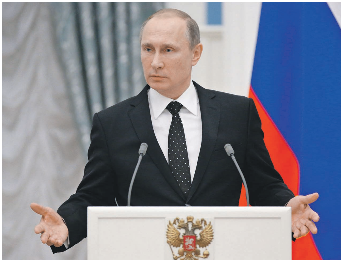
Владимир Путин решил оградить Россию от всего турецкого

Путин также запретил работодателям нанимать работников из числа граждан Турции — это ограничение вступает в силу с 1 января 2016 года. Судя по тексту указа, оно не будет распространяться на турецких граждан, с которыми трудовые отношения будут оформлены по состоянию на 31 декабря 2015 года.