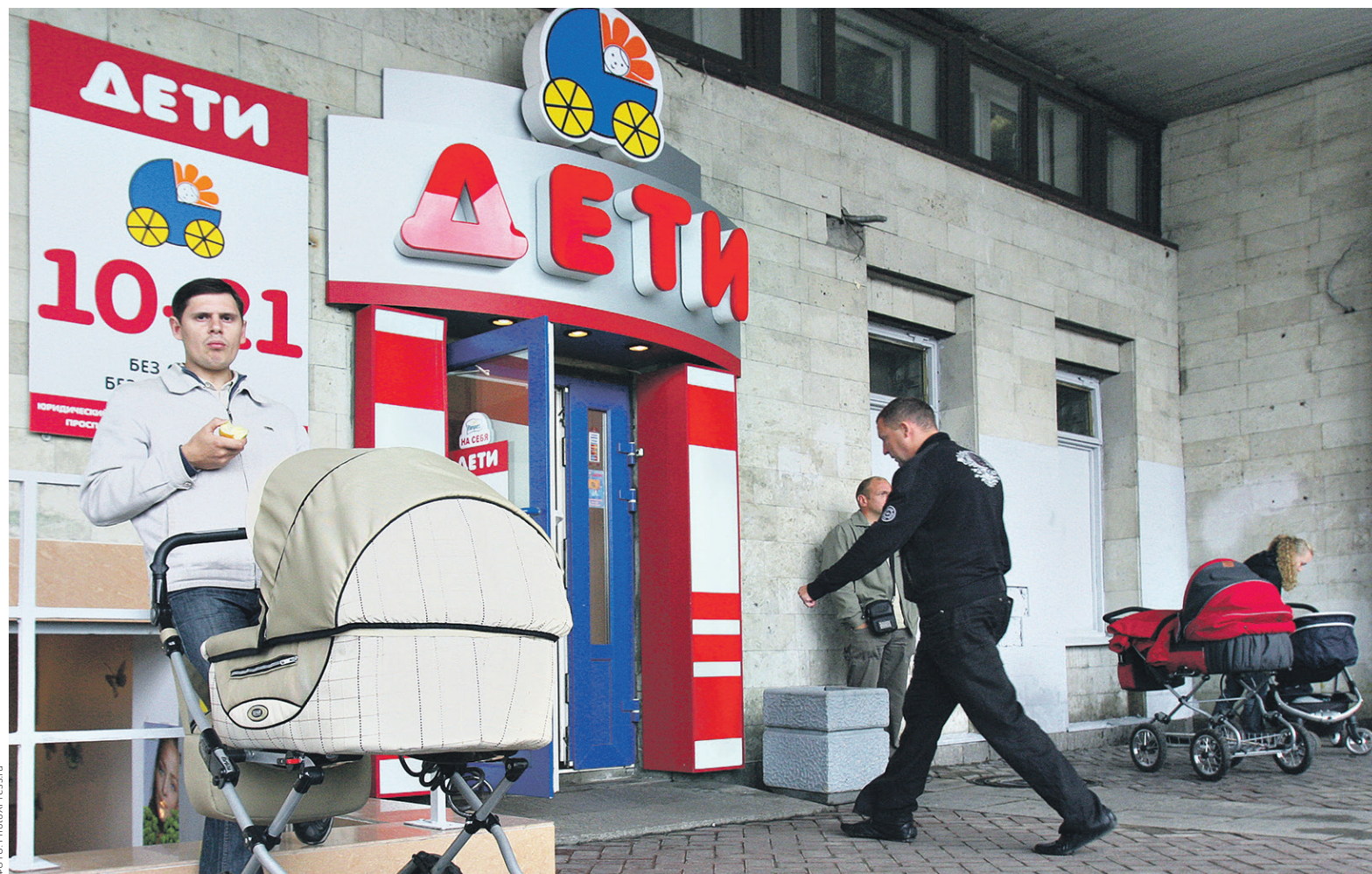
ГК «Дети» была одним из лидеров на рынке детских товаров, однако в 2014 году между ее акционерами начались серьезные разногласия