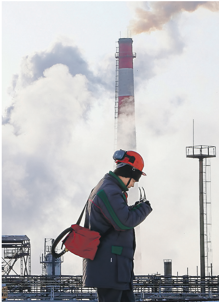
В 2015 году крупнейшие российские компании, несмотря на кризис, увеличивали прибыль и выручку

Суммарная выручка компаний — участниц рейтинга равна 79% российского ВВП за 2015 год