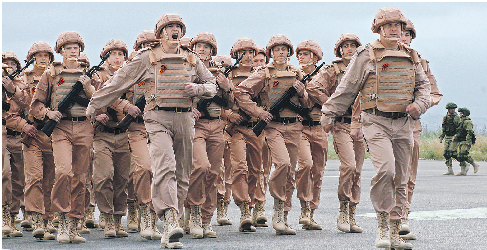
Сколько россиян из проголосовавших в Сирии на выборах-2016 относятся к военным, на сайте ЦИКа не уточняется; косвенно на количество голосовавших на военной базе указывает число тех, кто опустил бюллетень в переносную урну. На фото: российские военные на авиабазе Хмеймим

Косвенно на количество голосовавших именно на военной базе указывает число тех, кто опустил бюллетень в переносную урну