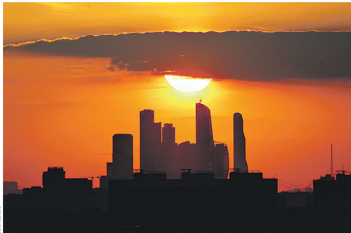
Суммарная выручка компаний – участниц рейтинга РБК 500 равна 79% российского ВВП за 2015 год

Тем не менее количество компаний, чья выручка растет, снизилось в рейтинге РБК по сравнению с 2014 годом с 397 до 375, а число предприятий с падающими продажами, напротив, выросло с 93 до 113. Изменился