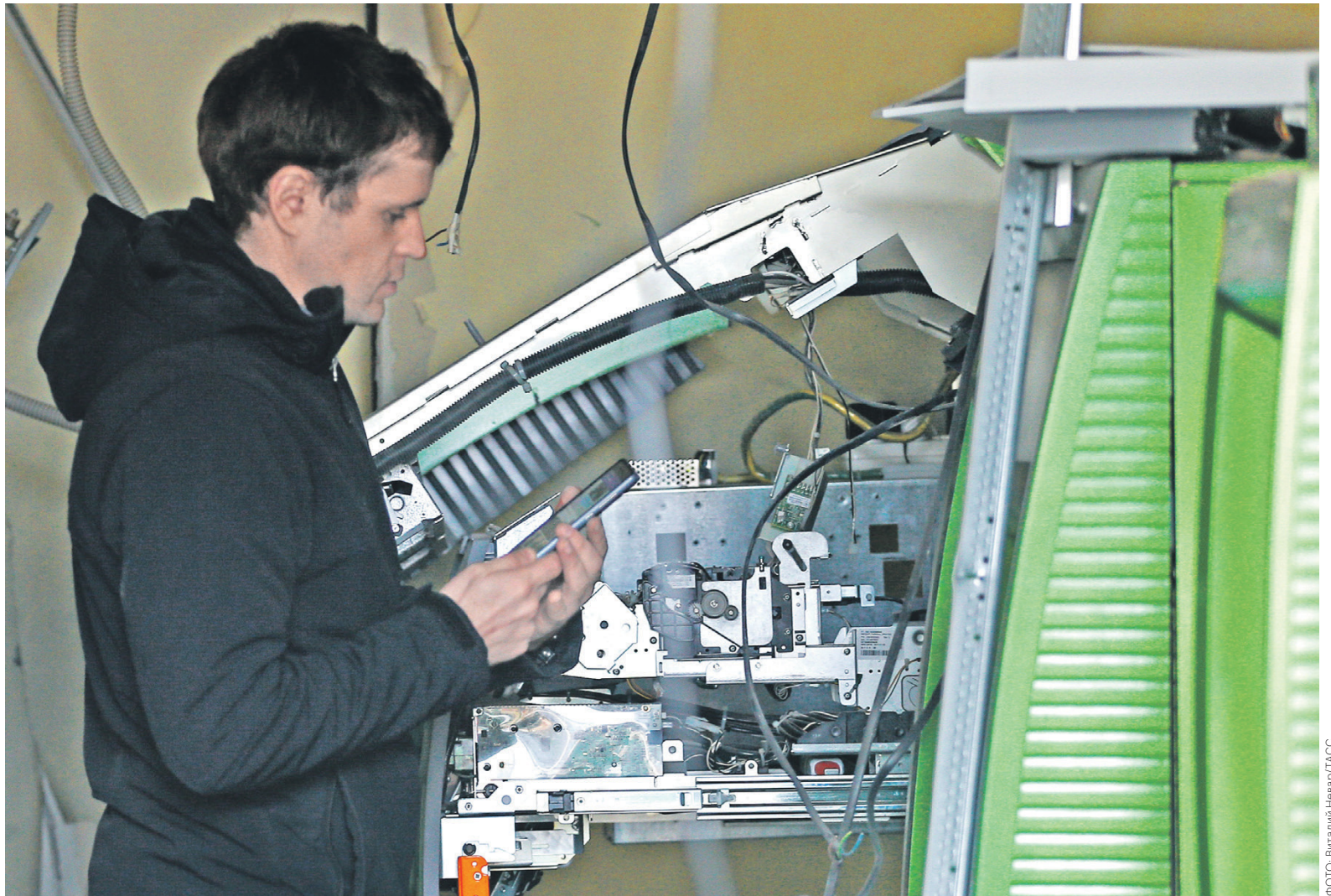
Изготавливаемые для банкоматов подделки нередко не слишком похожи на настоящие деньги, так как мошенники копируют только те признаки, наличие которых проверяет машина

С начала 2013 года работающие в России банки обязаны использовать банкоматы, проверяющие наличие у купюр как минимум четырех машиночитаемых защитных признаков (магнитные метки, люминесценция отдельных элементов под воздействием