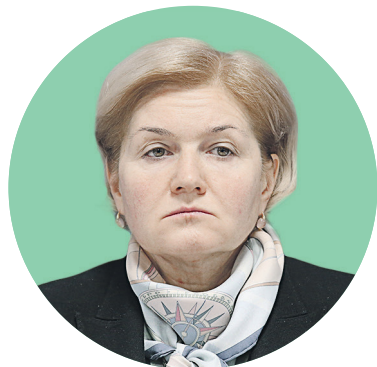
Вице-премьер Ольга Голодец

— Вы сказали сегодня, что стоимость рабочей силы в России недооценена и не соответствует квалификации кадров. Почему? — Сегодня идет оживленная дискуссия по поводу инвестиций, технического перевооружения и встает вопрос о стоимости рабочей силы. У нас в России 4,9 млн человек получают заработную плату 7,5 тыс. руб. Вы можете себе представить квалификацию человека, который получает такую заработную плату? Даже если он просто окончил среднюю школу, то его зарплата по определению должна быть выше: навыки, которые он получил, стоят дороже. Такого минимального уровня оплаты труда нет нигде. И то, что на сегодня стоимость труда и издержки на труд так сильно просели, — признак некоторого дисбаланса в нашей экономике. В 2016 году доля фонда оплаты труда в российской экономике [доля в ВВП] составила 23%, и это существенно меньше, чем во всех других странах мира. Именно поэтому наша молодежь стремится пе-