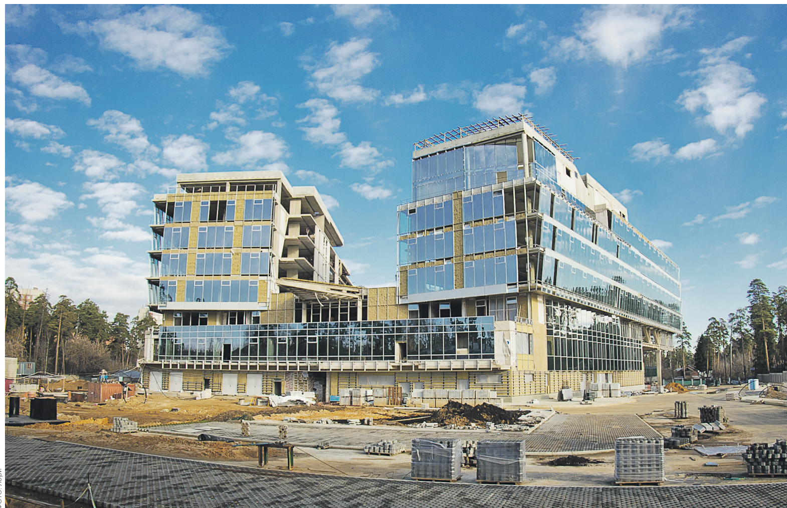
Согласно корпоративному журналу ОАК, в здании площадью 39,3 тыс. кв. м должны были разместиться рабочие места для 1,6 тыс. человек, а также фитнес-центр и 25-метровый бассейн

Речь может идти о специалистах, занимающихся проектированием широкофюзеляжного самолета; этим проектом должно заниматься совместное предприятие (СП) ОАК и китайской корпорации коммерческих самолетов COMAC. Как сообщал ТАСС, создание СП