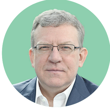
Глава ЦСР Алексей Кудрин

— Нужно обновлять его формат и масштабировать. Есть несколько фондов, которые поддерживают такие проекты, но с крупными проектами, такими как строительство завода, фонды не всегда справляются. Для этого требуется больше ресурсов, которые стало сложнее найти