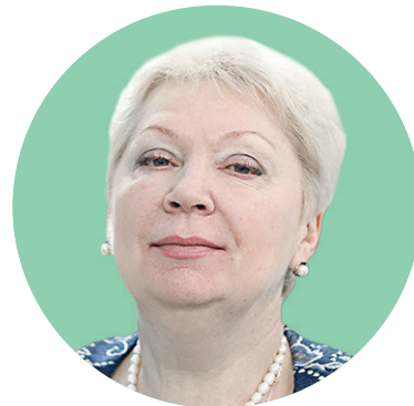
Министр образования и науки Ольга Васильева

— Вице-премьер Ольга Голодец говорила, что вузы все-таки недофинансированы.