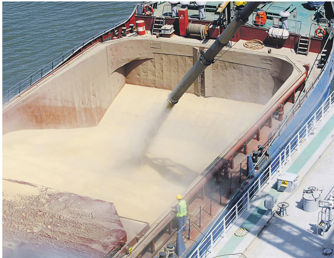
Основная статья продовольственного экспорта России — зерно