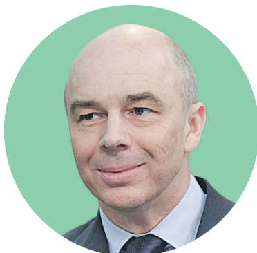
Министр финансов Антон Силуанов

— Покупки валюты за счет доходов сверх $40 за баррель обеспечивают предсказуемость курса. Иными словами, мы около двух третей дополнительных нефтегазовых доходов забираем в бюджет и тем самым поддерживаем свои резервы. Это тоже важно, потому что в последние годы мы их только тратили. Во-вторых, эта мера создаст механизм стабильности курса. Без нее движение курса было бы более волатильным и прогнозируемость была бы хуже, чем сейчас. Поэтому действительно, подготавливая предложения по бюджетному правилу,