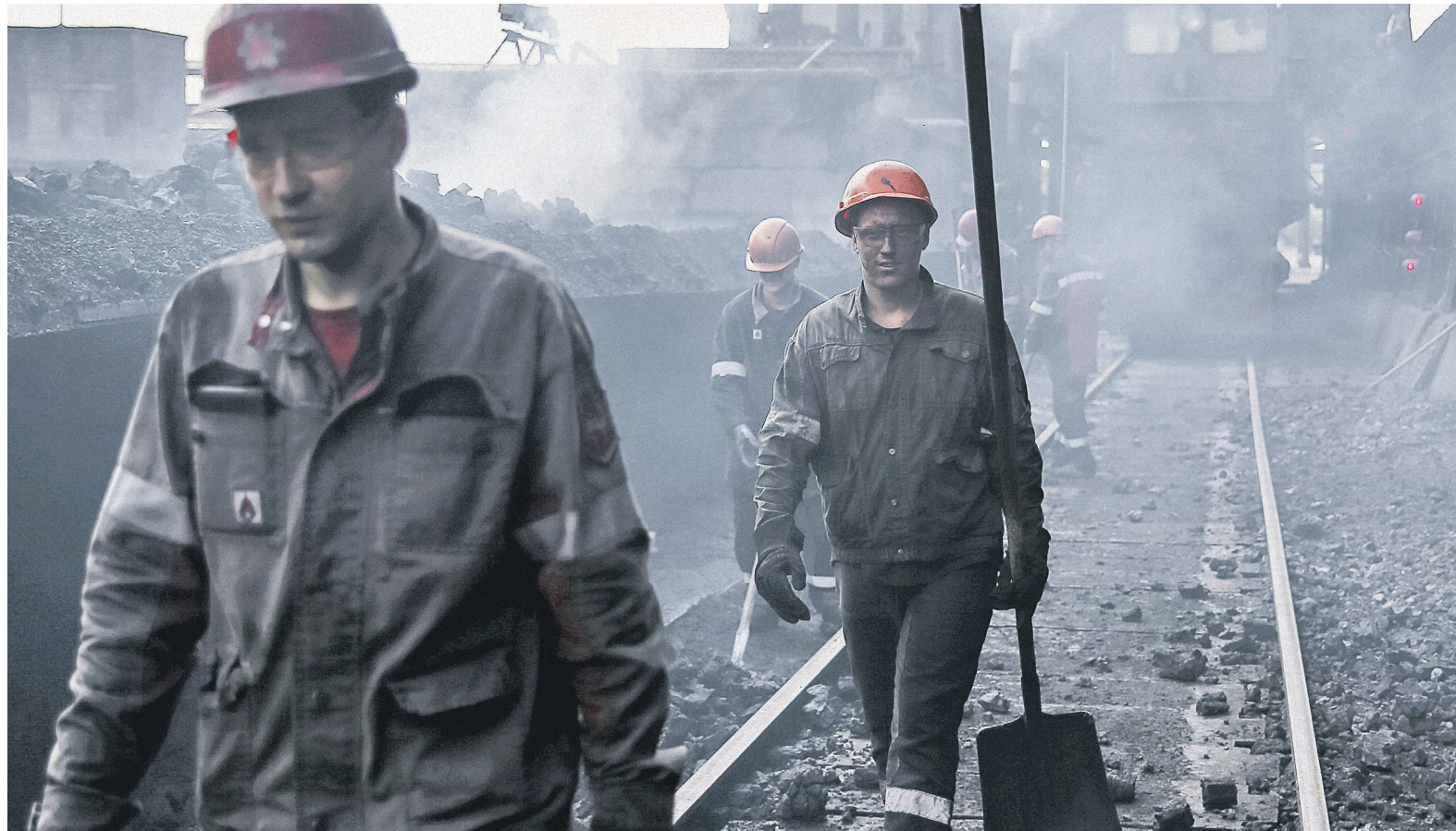
Блокада поставок товаров с неподконтрольных Украине территорий Донецкой и Луганской областей силами бойцов АТО и народных депутатов обострилась в середине февраля, когда была перекрыта поставка угля с Донбасса на Украину

Представители штаба торговой блокады 28 февраля заявили, что на одном из блокпостов начались вооруженные столкновения между участниками блокады и неизвестными людьми в масках. Согласно сообщению, «вооруженные титуски» штурмуют «редут блокады в Кривом Торце 16-го добровольческого батальона». «Для прикрытия рядом присутствуют пенсионерки и телекамеры, полиция полностью бездействует», — говорится в со-