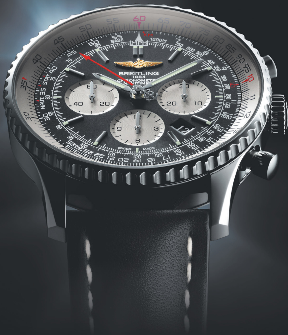
NAVITIMER 46 мм