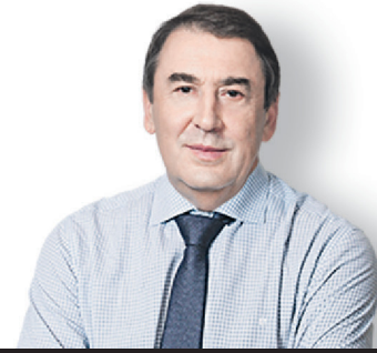
Андрей Нечаев, экономист, министр экономики России в 1992–1993 годах