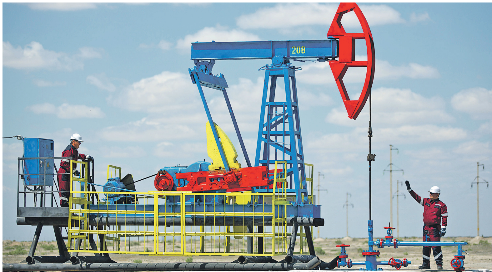
Все параметры соглашения о сокращении добычи нефти остались прежними, включая особые условия для Ирана, Нигерии и Ливии

С конца 2014 года глобальная добыча нефти почти каждый квартал опережала потребление, в мире накопились рекордные запасы. По