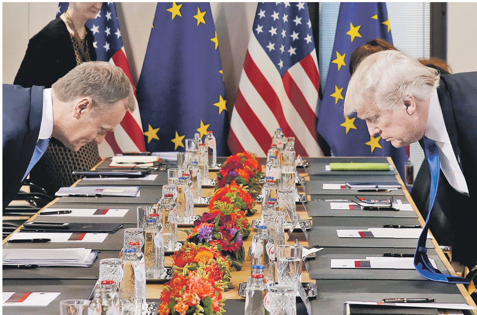
Дональд Трамп (на фото справа) утверждает, что увеличение военных бюджетов стран до 2% от их ВВП является «крайним минимумом для ответа на современные очень реальные угрозы». На фото слева: председатель Европейского совета Дональд Туск

На саммите было принято решение о создании в штаб-квартире альянса в Брюсселе антитеррористического центра по обмену информацией. По словам Столтенберга, «новая ячейка по борьбе с терроризмом» будет способствовать улучшению процесса сбора разведанных, в том числе об иностранных боевиках.