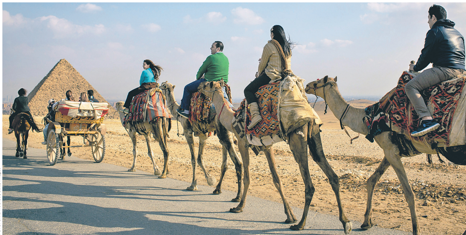
В январе 2018 года зафиксирован максимальный рост туристов из России в Египет год к году — в 2,2 раза (до 9,1 тыс. человек)

Возросший интерес россиян к отдыху в Египте подтверждают представители билетных сервисов. По данным OneTwoTrip, продажи авиабилетов в Египет с вылетом в декабре 2017 года и январе 2018 года увеличились в два раза по сравнению с аналогичными месяцами предыдущих лет. Целью перелета у большинства пассажиров были курортные города: на долю Хургады и Шарм-эш-Шейха пришлось 65% билетов, на Каир — 29%, 6% — на Александрию, Луксор, Марса-Алам и другие города. Рейсы совершались с пересадками в трех основных городах: Стамбуле (66%), Афинах (10%), Риме (6%).