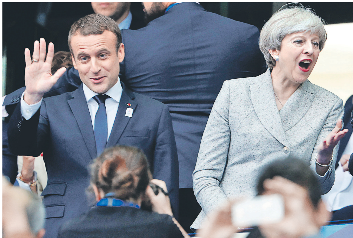
Ни президент Франции Эмманюэль Макрон, ни премьер Великобритании Тереза Мэй не получили согласия депутатов парламентов своих стран на военные действия в Сирии