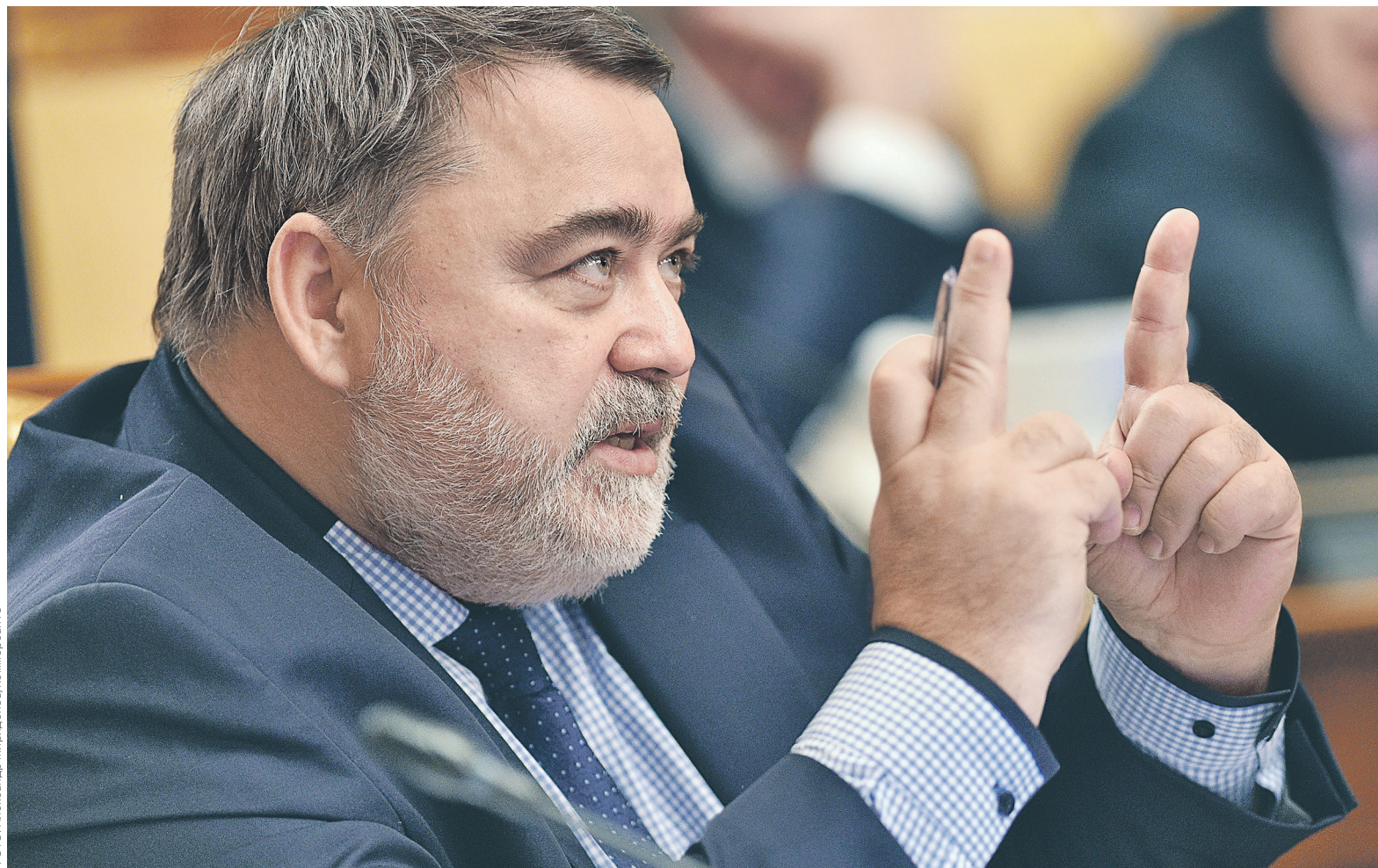
ФАС (на фото: глава ведомства Игорь Артемьев) ограничила Рунет тремя доменными зонами

ФАС, учитывая особенности правового регулирования интернета и признавая Рунет «вирту-