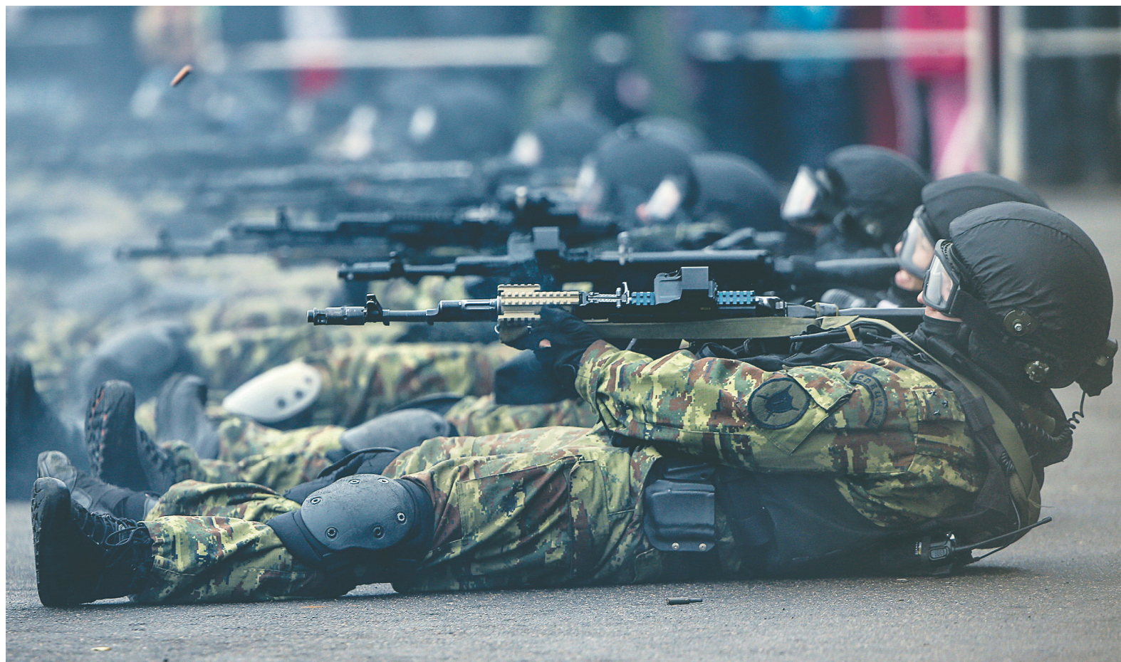
Бойцы специального назначения ФСИН демонстрируют образцы вооружения и военной техники в рамках международной выставки «Интерполитех-2015» на полигоне ФКП «НИИ «Геодезия» в Красноармейске