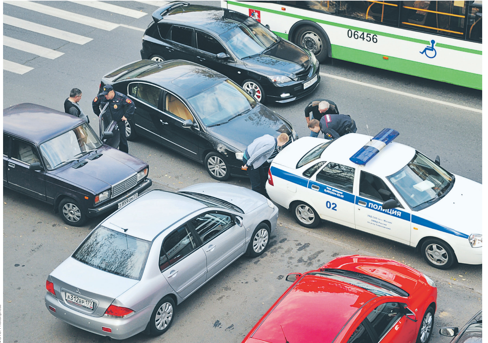
По мнению ЦБ, водители от 16 до 24 лет ездят более рискованно, поэтому коэффициенты таким водителям должны быть повышены

Сейчас тарифная политика в области ОСАГО полностью находится в компетенции ЦБ; стоимость полиса рассчитывается на основе базового тарифа с поправкой на коэффициенты, учитывающие регион регистрации автомобиля, мощность двигателя, стаж и возраст водителя, а также коэффициента