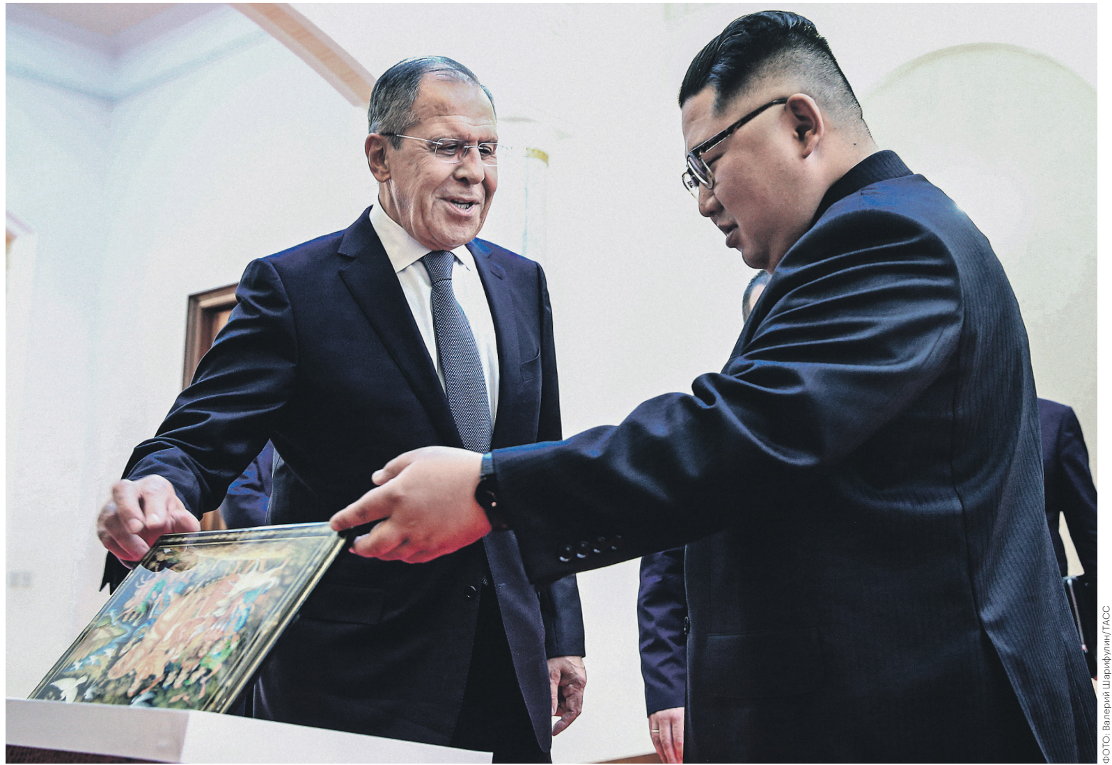
Сергей Лавров подарил Ким Чен Ыну палехскую шкатулку с ключом для хранения его секретов

До этого Лавров провел переговоры с главой МИД КНДР Ли Ён Хо. «Мы много говорили о ситуации на Корейском полуострове и вокруг него», — рассказал Лавров по итогам переговоров. Москва приветствует контакты, которые КНДР развивает с Южной Кореей и США. По словам Лаврова, важно подходить к этим процессам «деликатно, не пытаться делать резких движений, искусственно подгонять процесс».