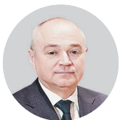
СЕРГЕЙ МЕНШИКОВ, член правления «Газпрома» с марта 2019 года

В сообщении «Газпрома» от 25 февраля говорилось, что он «продолжит работу на другой должности в группе»