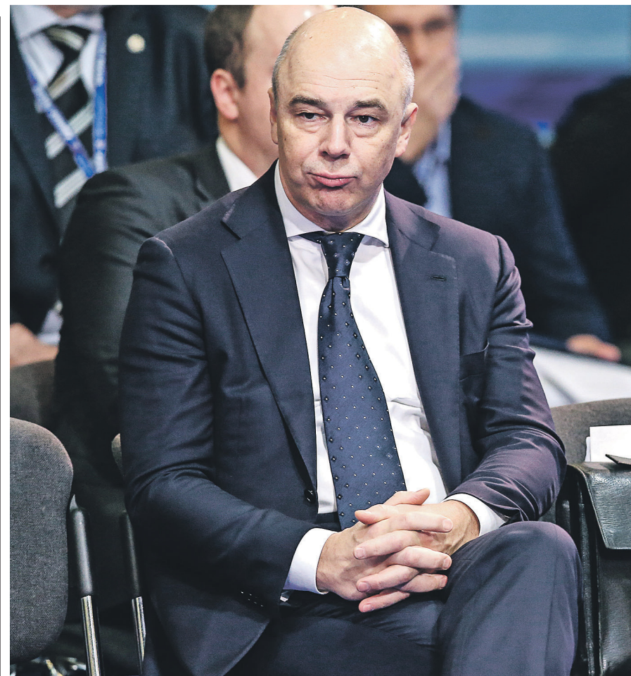
Инвестировать свободные ресурсы ФНБ можно будет после того, как их объем превысит 7% ВВП. На этот уровень фонд выйдет по итогам 2019 года, ожидают в Минфине (на фото: первый вице-премьер и глава министерства Антон Силуанов)