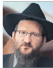
Берл Лазар, главный раввин России