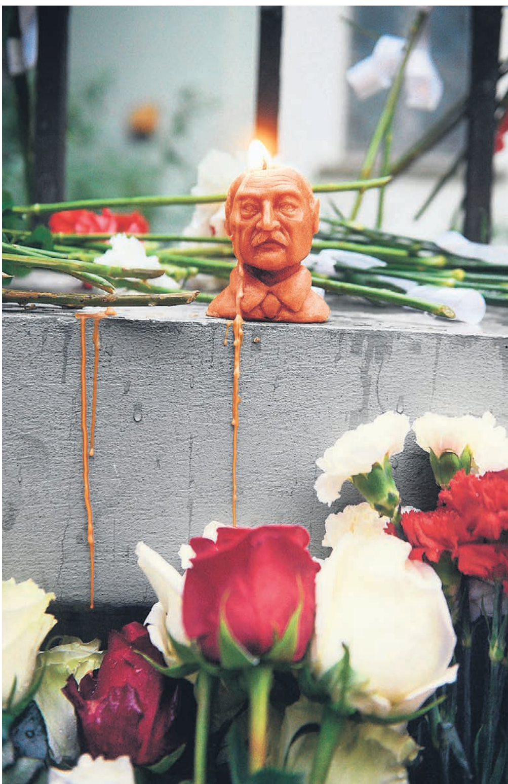
Реакция Александра Лукашенко на массовые протесты разочаровала как руководителей западных стран, так и многих россиян (на фото: цветы и свечи у посольства Белоруссии в Москве)

«Все пошло в неправильном направлении, и нам нужно снова ужесточить меры», — выразила общее мнение министр иностранных дел Швеции Анн Линде. Она, как и другие представители западных стран, не скрывала досады: как раз в последние годы наматилось заметное сближение Белоруссии с Евросоюзом и США. Запад ослабил санкции в отношении белорусских властей, Минск вновь стали посещать высокопоставленные лица из Европы и Америки, Белоруссию стали активнее вовлекать в проекты «Восточного партнерства» ЕС и энергетическое сотрудничество, США вот-вот должны были впервые с 2008 года направить в страну своего посла.