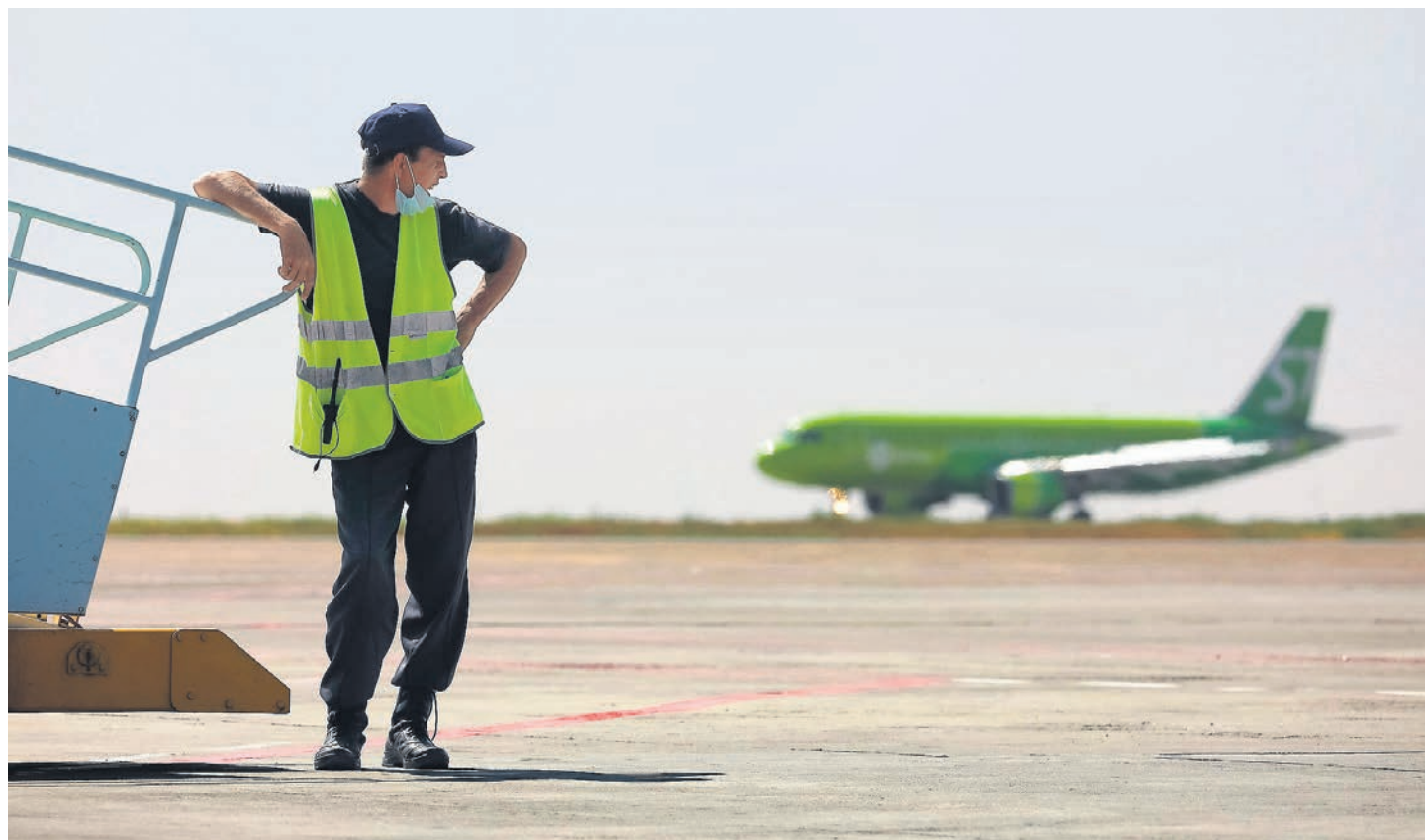
Влияет ли связь 5G на безопасность взлета и посадки самолетов, еще неизвестно, но меры уже принимаются

Как выяснил «Ъ», на фоне масштабного развертывания сетей 5G в США, уже вылившееся в сложности с полетами в стране, Росавиация рекомендовала российским перевозчикам также следить за возможными проблемами с оборудованием. Авиапроизводители и американский авиарегулятор опасаются, что сети 5G могут влиять на работу радиовысотомеров, чьи показания особенно важны при взлете и посадке. Российским авиакомпаниям предстоит провести тренировки с имитацией ненадежной работы оборудования. Ситуация в первую очередь затрагивает «Аэрофлот», который пока не сталкивался со сбоями из-за 5G.