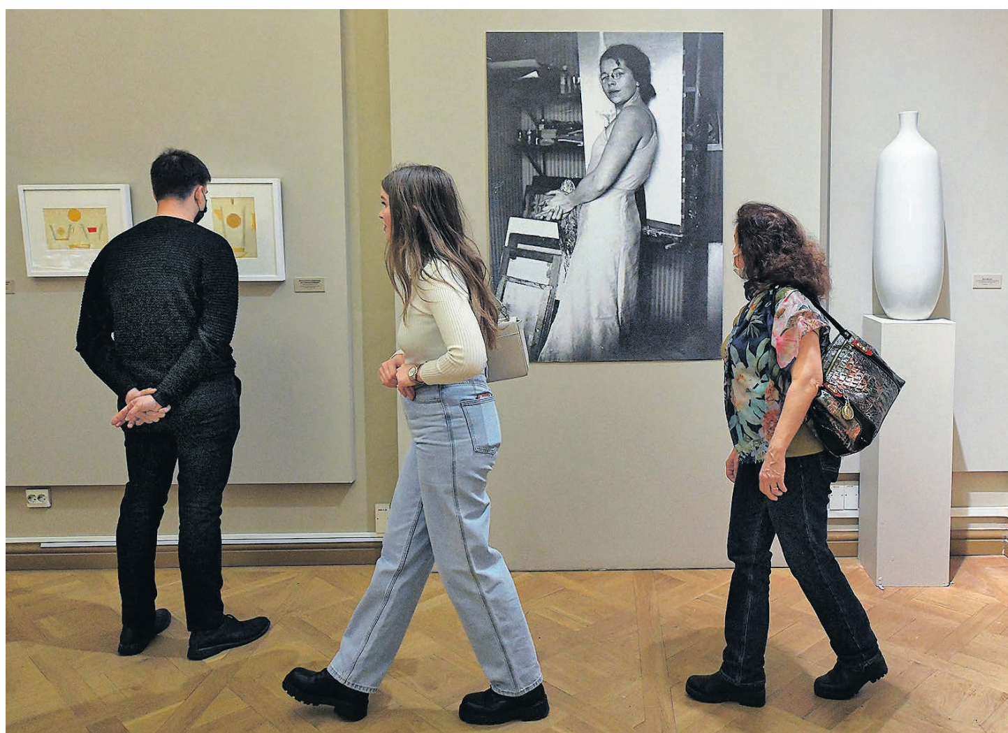
Вынужденный переход художницы-«формалистки» к прикладному искусству — главный сюжет выставки

Между тем выставка в Инженерном замке рассказывает очередную грустную историю задуманного в самом расцвете художественного «формализма». Запрещенные в 1932 году любые отступления от соцреалистического курса партии и правительства прев-