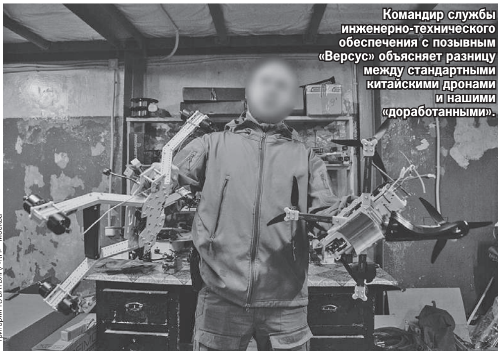
Командир службы инженерно-технического обеспечения с позывным «Версус» объясняет разницу между стандартными китайскими дронами и нашими «доработанными».

У замкомандира группы радиоэлектронной борьбы позывной «Кирпич». Айтишники так называют неработающий телефон или ноутбук. У «Кирпича» начинает работать даже то, что не работало никогда.