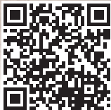
Фото присылайте в «Комсомольскую правду», e-mail: miss@kp.ru

Голосуйте за понравившуюся вам участницу на нашем сайте KP.RU в разделе «Будь стильной с «КП»!»