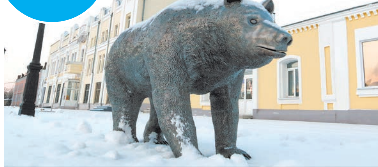
В краевой столице в 2025 году турвзнос составит 100 рублей в сутки.

Специалист рассказала, кто будет его оплачивать