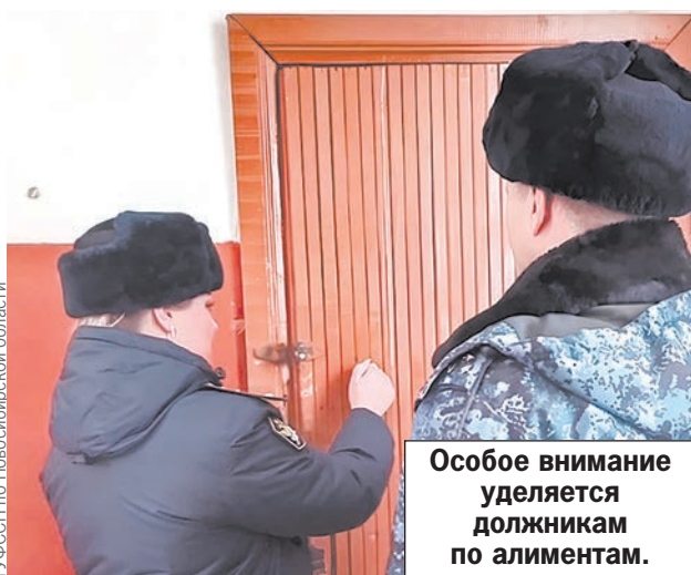
Особое внимание уделяется должникам по алиментам.

В целом для кого-то это может быть действенным методом. Но и другие способы пробудить ответственность у родителей тоже работают: временный запрет на выезд за пределы страны, запрет регистрационных действий, арест имущества,