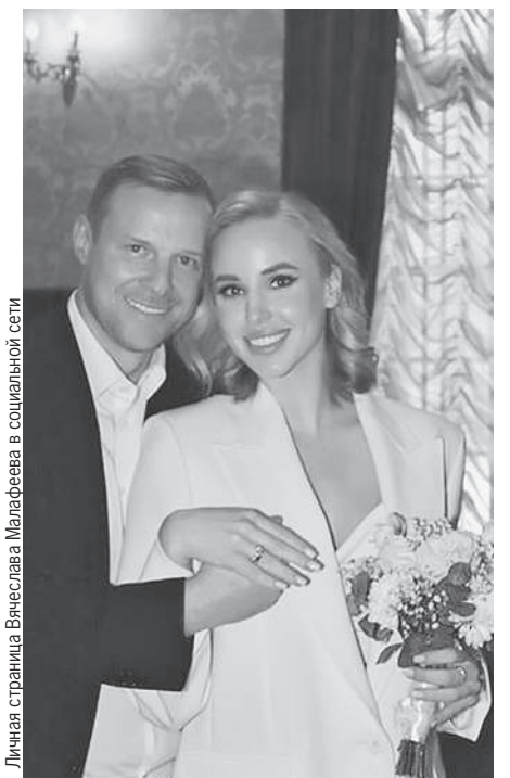
Личная страница Вячеслава Малафеева в социальной сети