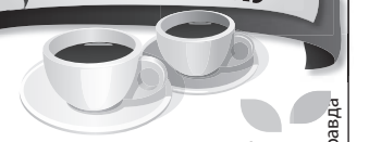
Дмитрий ПОЛУХИН/Комсомольская правда