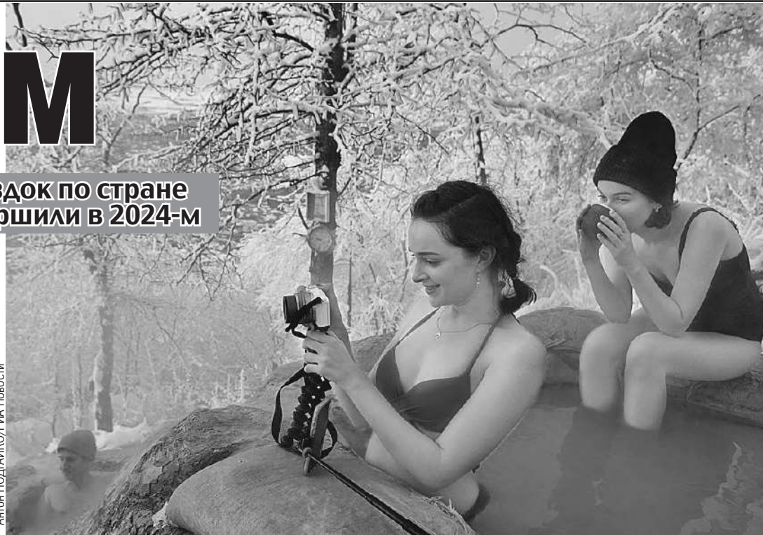
Антон ПОДПАЙКО/РИА Новости