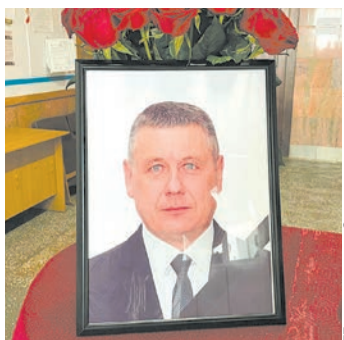
ТГ-канал главы Завьяловского района