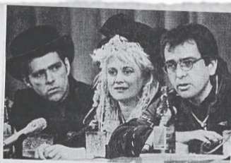
Мелодии зеленого мира

Еще в сентябре 1988 года было подписано соглашение с фирмой «Мелодия»,