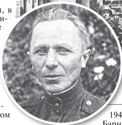
Марш войск стран-победительниц, который прошел 7 сентября 1945 года в Берлине, называют забытым парадом.