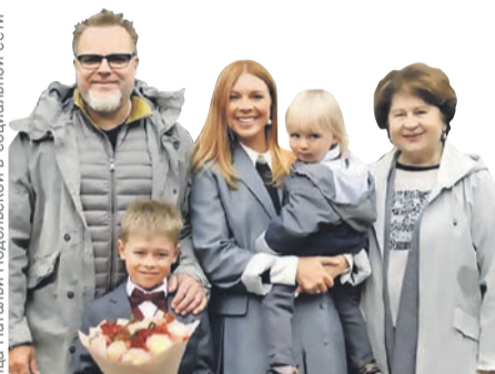
Личная страница Наталья Подольской в социальной сети