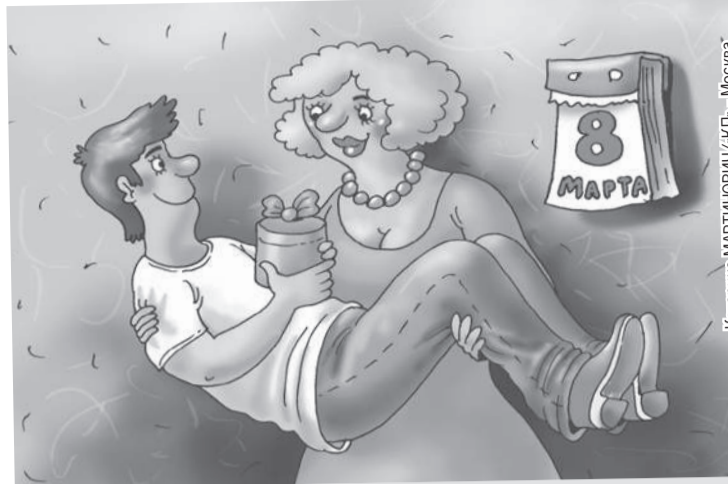
Картина МАРТИНОВИЧ/КП - Москва