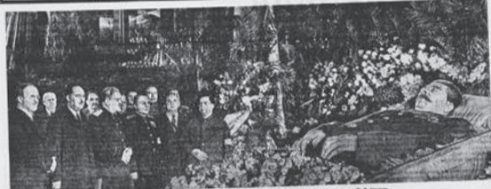
ПОСТАНОВЛЕНИЕ ЧАСЫ ПРОЩАНИЯ