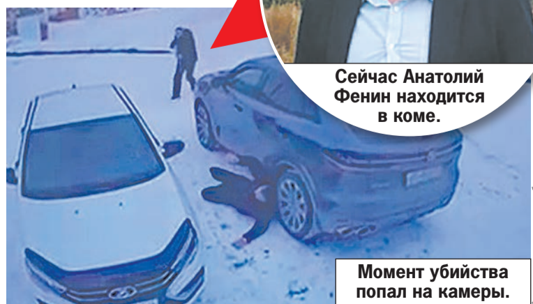
Момент убийства попал на камеры.