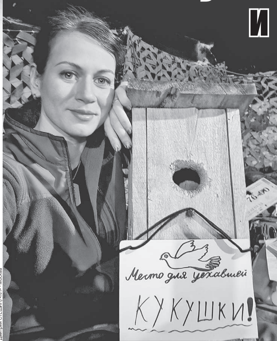
«Валькирия» даже среди серых развалин и гари не теряет чувства прекрасного. Да она и сама прекрасна.

Наутро «Валькирия» уезжала на передок в Часов Яр на несколько недель. Не «по серенькому» - в сумерках, а в тот короткий и благословенный час, когда ночь превращается в раннее утро, когда ночные дроны уже не работают, а дневные еще не поднялись в воздух. Я в некотором ошеломлении залез в