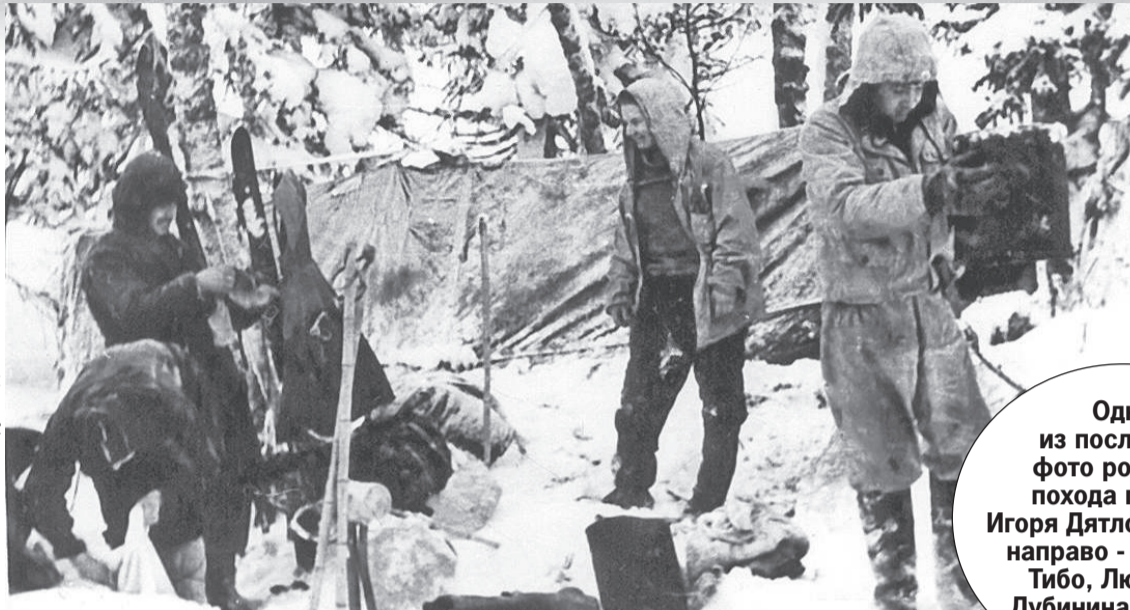
Фонд памяти группы Дятлова

Учитывая, что между действиями перечисленных выше лиц, допустивших недостатки в постановке спортивной работы, и гибелью туристов нет причинной связи ... уголовное