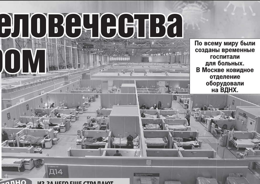
По всему миру были созданы временные госпитали для больных. В Москве ковидное отделение оборудовали на ВДНХ.