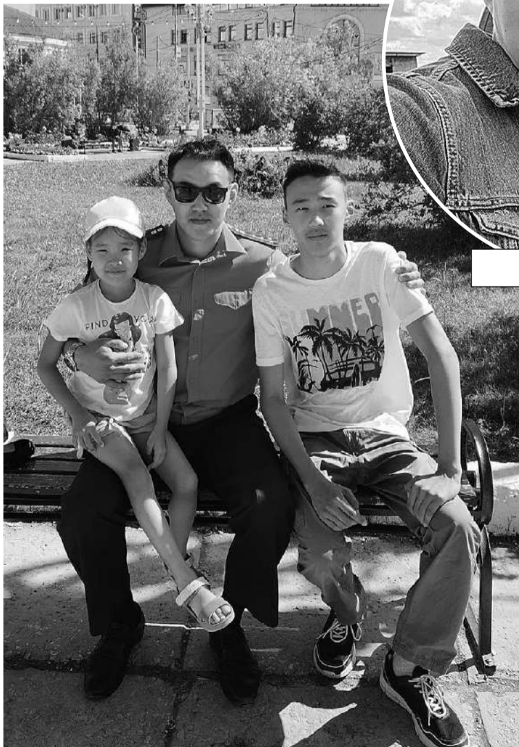
Свободное время следователь уделяет семье.