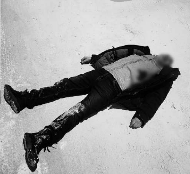
Пострадавший мужчина медленно умирал.