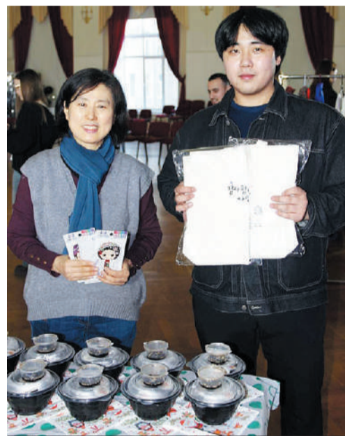
Женщина живет обычной студенческой жизнью.

никации обучает не только языковым навыкам, но и общению с русскими людьми. Поэтому я выбрала его.