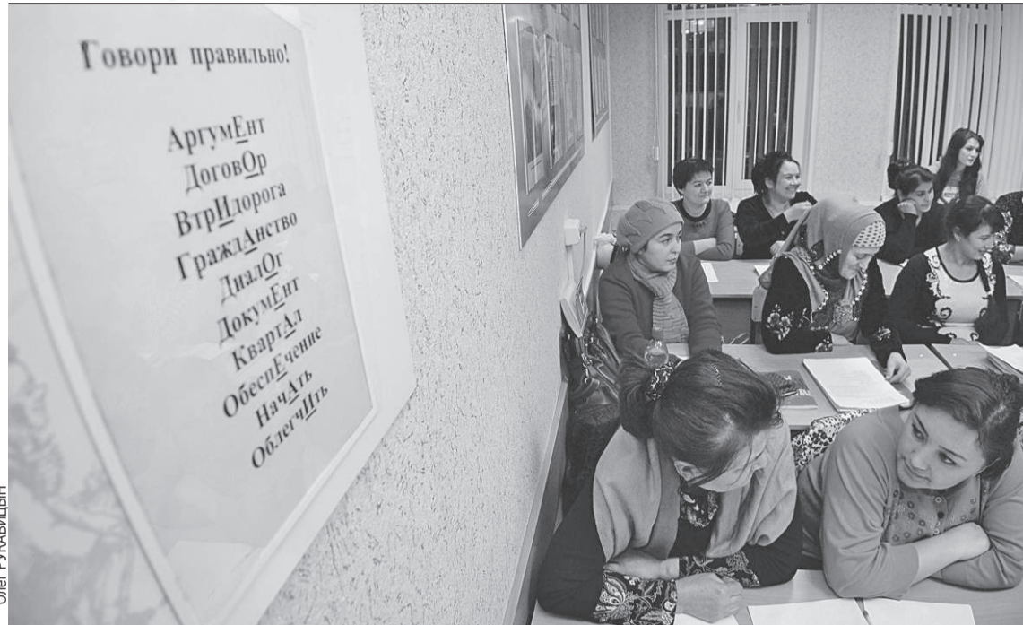
Экзамены по русскому языку теперь контролирует государство.

ях миграции - 11,7%. Две цифры: в целом по стране средняя зарплата с 2012 по 2024 год выросла в 3,1 раза, у нас - в 1,4 раза. За этот же срок некомплект увеличился в четыре раза. Более десяти лет заработная плата не индексировалась по коэффициенту-дефлятору. Это, конечно, отразилось.