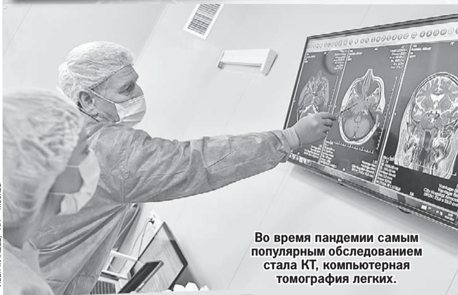
Во время пандемии самым популярным обследованием стала КТ, компьютерная томография легких.

«Комсомолка» расспросила ведущих ученых о способах, которые помогают справиться с осложнениями после коронавирусной инфекции.