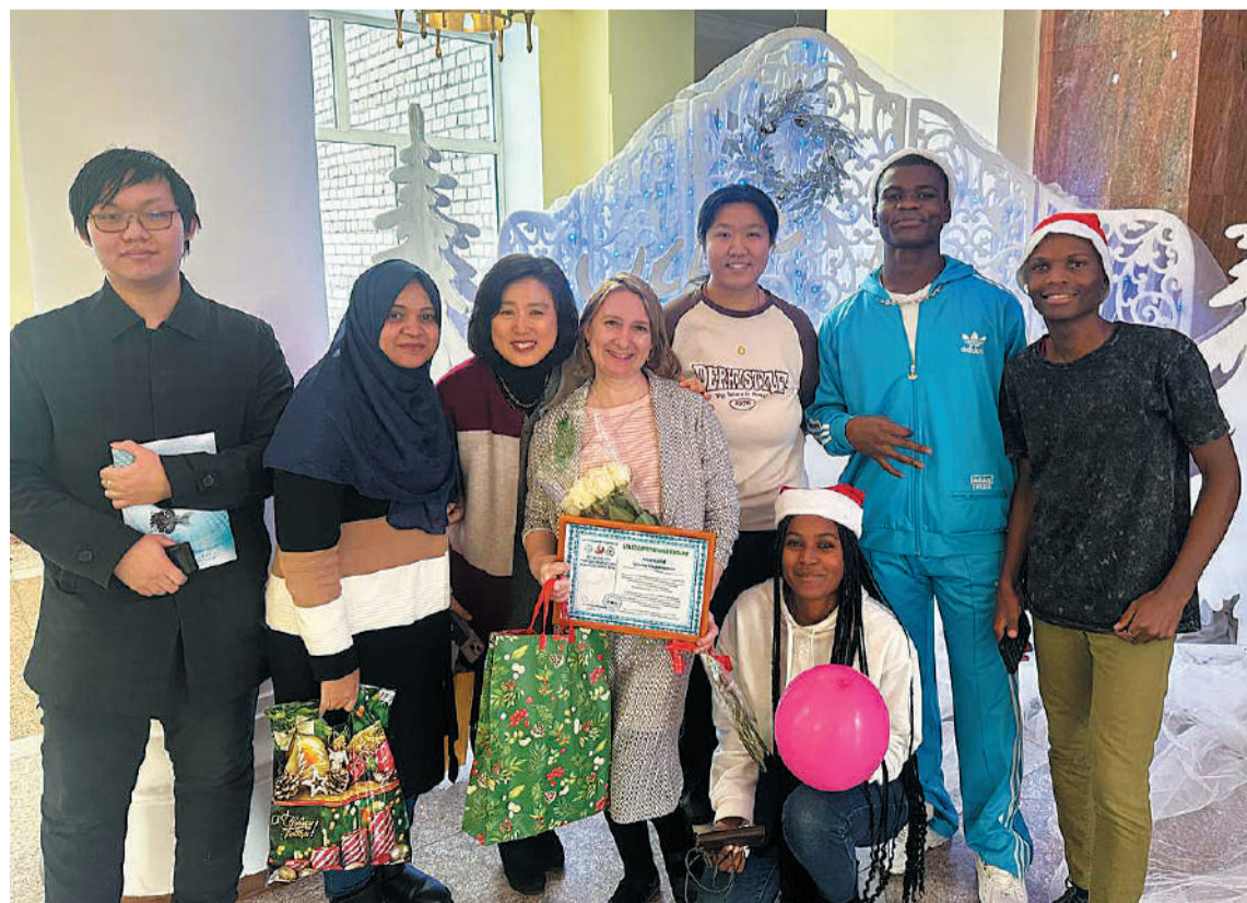
Иностранные студенты активно участвуют в творческой жизни вуза.