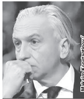
Александр Дюков будет руководить нашим футболом еще 4 года.

мента национальных европейских ассоциаций ФИФА, называл всех футбольной семьей, передавал пламенный привет от президента ФИФА Джанни Инфантино и рассказывал, как 13 лет назад переманивал Александра Самедова в сборную Азербайджана.