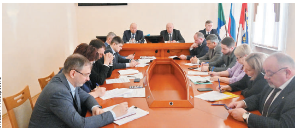
Подготовка к празднованию 80-летия Победы в Хабаровске - на личном контроле мэра.

Впервые в Хабаровске состоится акция «Живая история», в ходе которой на экранах будут транслироваться истории, рассказанные ветеранами. Еще одна новинка - акция «Портрет Героя». Пор-