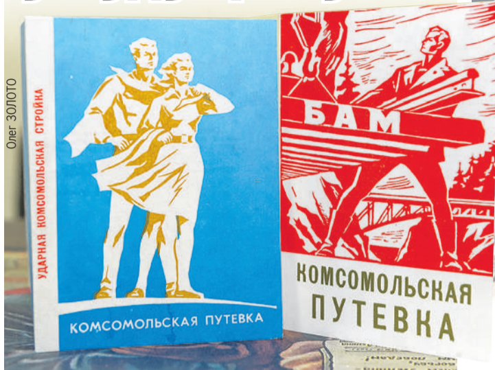
Комсомольские путевки и выступления артистов агитпоезда «Комсомольской правды» - неотъемлемая часть истории строительства БАМа.

Агитпоезд «Комсомольской правды» привозил к строителям писателей и спортсменов, космонавтов и лекторов общества «Знание». Как-то раз приехал даже знаменитый американский певец Дин Рид.