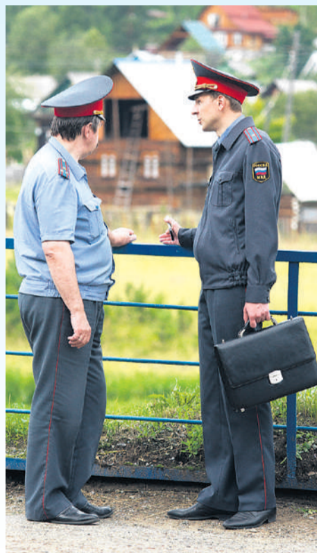
В некоторых регионах участковым доплачивают из областного бюджета.

преступления зарегистрировано в Иркутской области в 2024 году.