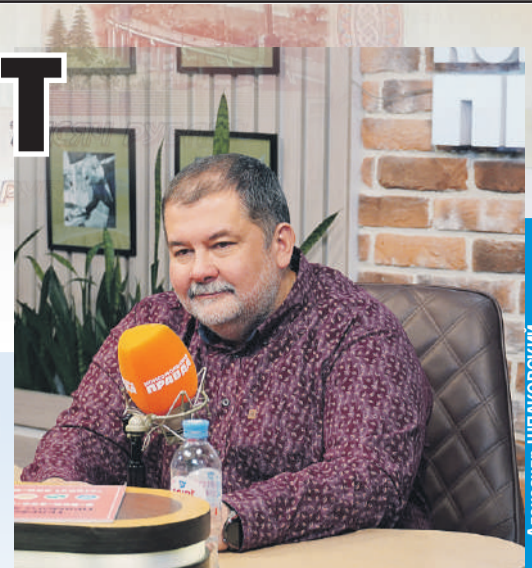
Сергей Лукьяненко - не только автор «Дозоров», но и мастер, помогающий начинающим писателям со всех уголков страны.

- Пройдет 2 - 3 года, и вы начнете сами снимать фильмы по своим книгам - это я сейчас пророчествую. С помощью нейросетей, с помощью разных программ, просто нанимая режиссера или находя единомышленника. Мир кинематографа