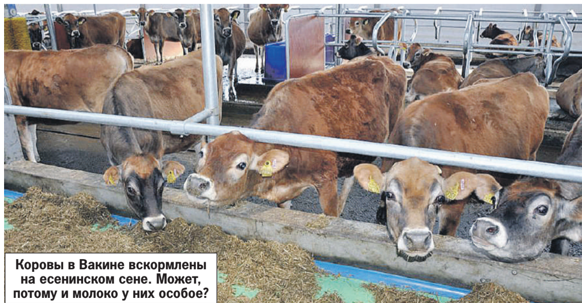
Коровы в Вакине вскормлены на есенинском сене. Может, потому и молоко у них особое?

- Совершенно нет! Говорю же, мы сами только узнали. Идите на производство - посмотрите. Одна у нас линия! Коров - 5400 голов. В сутки дают 163 тонны молока. И только 50 тонн идет на кефир, творог, йогурты, сыр. Остальное продаем как сырье... Хотя могли бы того же кефира больше выпускать. Но пробиться в торговые сети очень сложно. Там свои законы. Тяжело конкурировать с заводами, которые работают на покупном молоке. У нас же