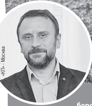
Виктор Гусейнов / «КП» - Москва