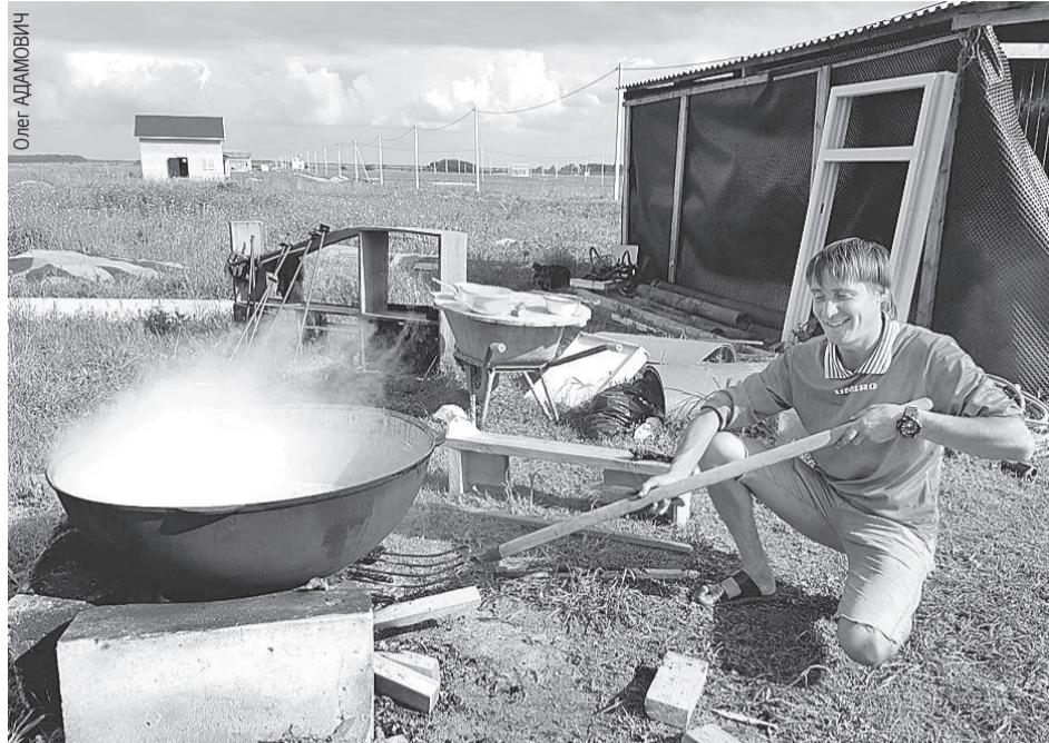
В деревне киргизов еду готовят сразу на всех. Шурпы из такого казана хватает минимум на день. Дежурство по кухне поручают самому незанятому человеку.

Сходство с Америкой на этом не заканчивается. Сейчас строящаяся община похожа на городок в прерии Дикого Запада. Поле, трава по пояс, грунтовка, ведущая от асфальта, и