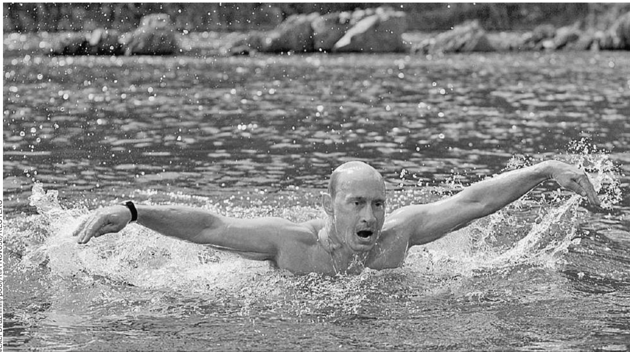
Кадры, на которых Владимир Путин во время отпуска демонстрирует прекрасную физическую форму, не дают покоя политикам и журналистам на Западе. Завидуют? (На фото - Путин во время заплыва по горной реке в Туве в 2009 году.)