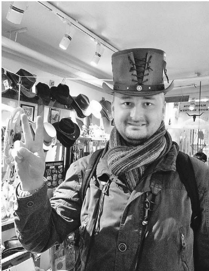
Казус Бабченко: говорит про родную страну гадости и зарабатывает на этом рейтинг и гонорары.

Одна дама, гордящаяся дедом-ветераном, объясняла мне, что фетишизировать оружие не надо, ветераны, мол, так не делали. Вскоре после войны сослуживец ее деда якобы забыл пистолет