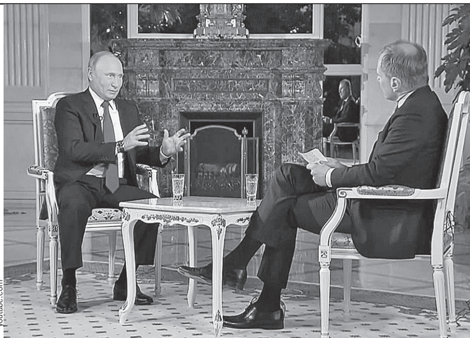
Разговор получился таким энергичным, что австрийский журналист пытался перебить Путина 11 раз (такая «модная» западная манера). И президенту приходилось даже переходить на немецкий, чтобы его остудить.

Мы не хотим, чтобы нам подсунили еще одного, второго, третьего или пятого Саакашвили, бывшего президента Грузии. Мы не