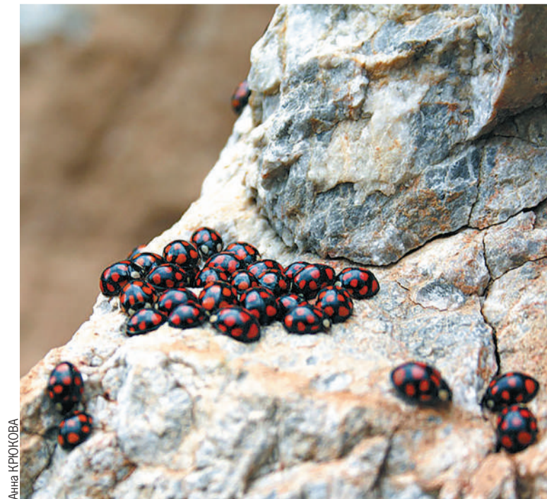
На скалах обитают местные алтайские божьи коровки.