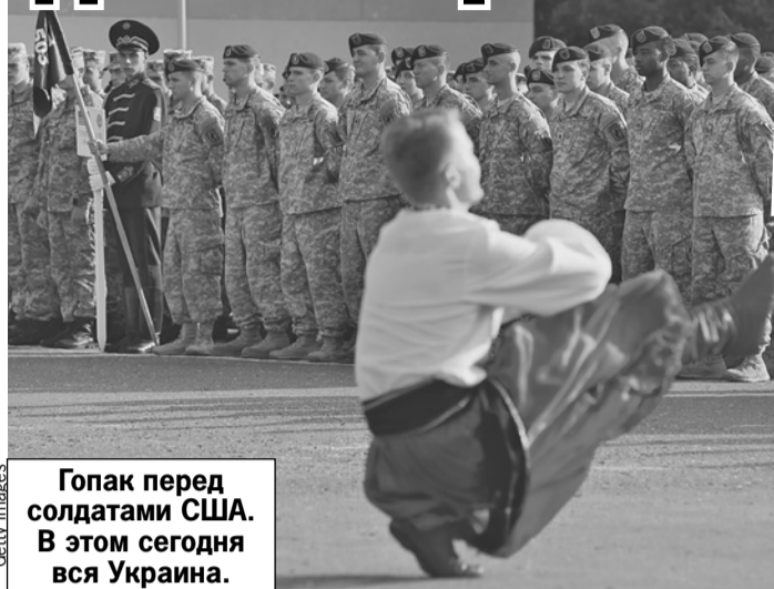
Гопак перед солдатами США. В этом сегодня вся Украина.

Вот только для приглашения в НАТО нужно согласие всех его членов. А Венгрия, Словакия, еще несколько стран, причем в первую очередь США и Германия, - видят вступление Украины в НАТО сейчас только в ночном кошмаре. Ибо это - автоматически их официальное вступление в войну с Росси-