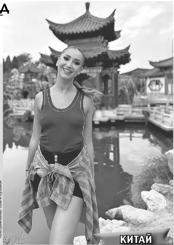
Telegram-канал Ольги Бузовой