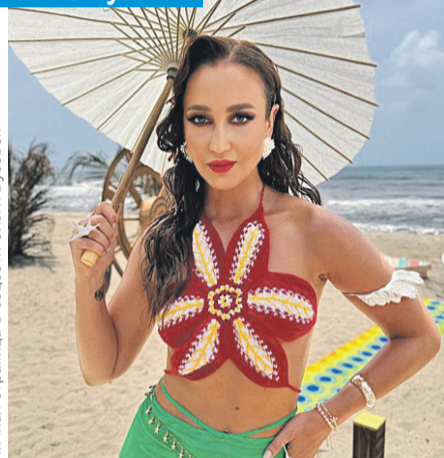
Личная страница в соцсети Ольги Бузовой