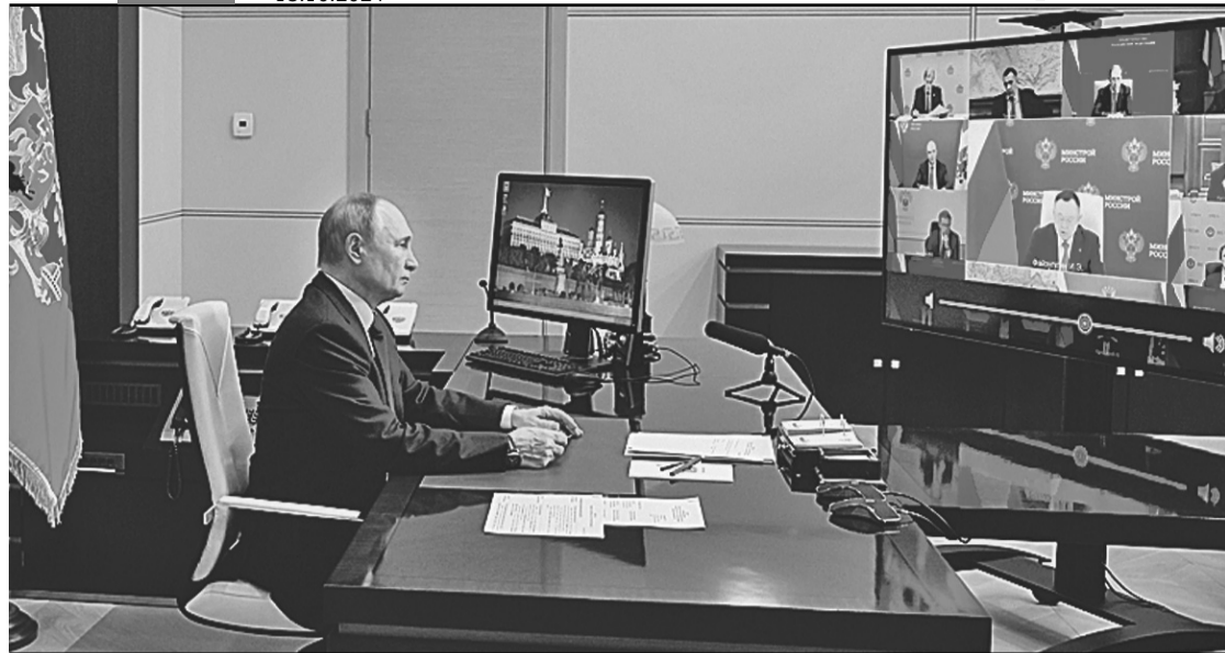
Чтобы не отрывать министров от рабочих мест надолго и не собирать всех в Кремле, президент, как правило, проводит подобные совещания по видеосвязи.