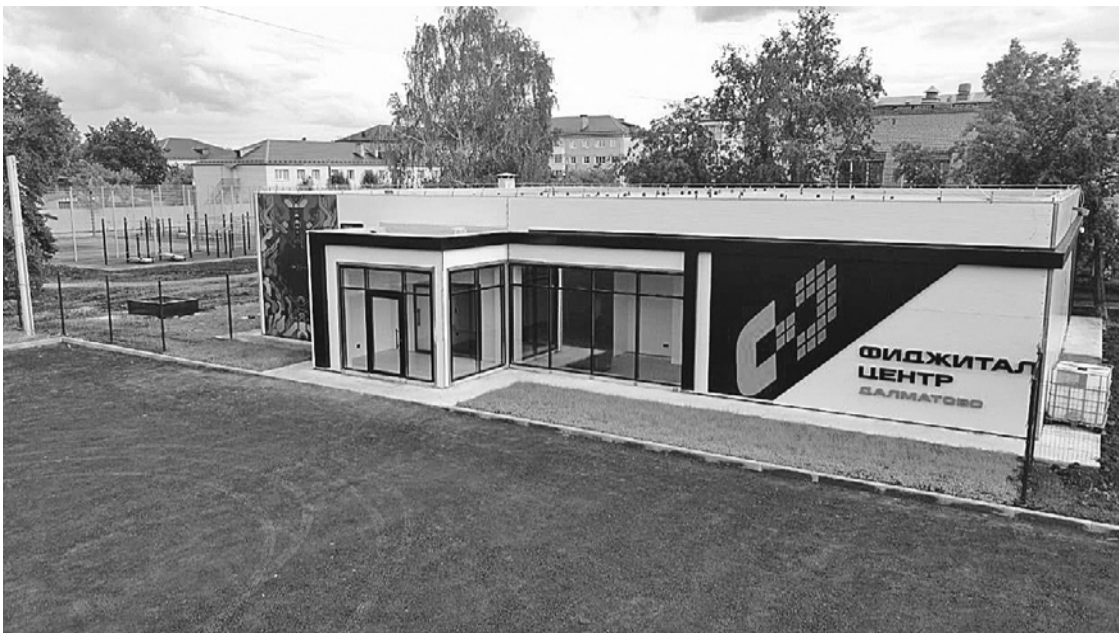
АНО «Национальные приоритеты»

Число россиян, которые регулярно занимаются спортом, неуклонно растет. Поддерживать себя в форме и достигать новых результатов помогает федеральная инициатива.