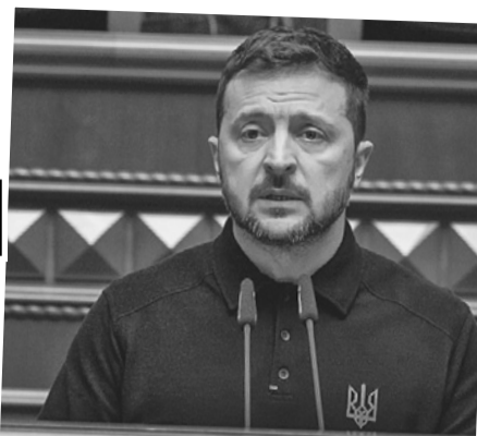
- Дайте грошей и патронов в обмен на Украину... Надоела, зараза, - читалось в бровях домиком Зеленского.

Вот это - самый реальный пункт «плана победы». Отдать Западу недра Украины за бак-