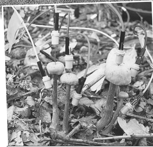
С помощью электродов на шляпках ученым удалось подслушать, как «болтают» грибы.