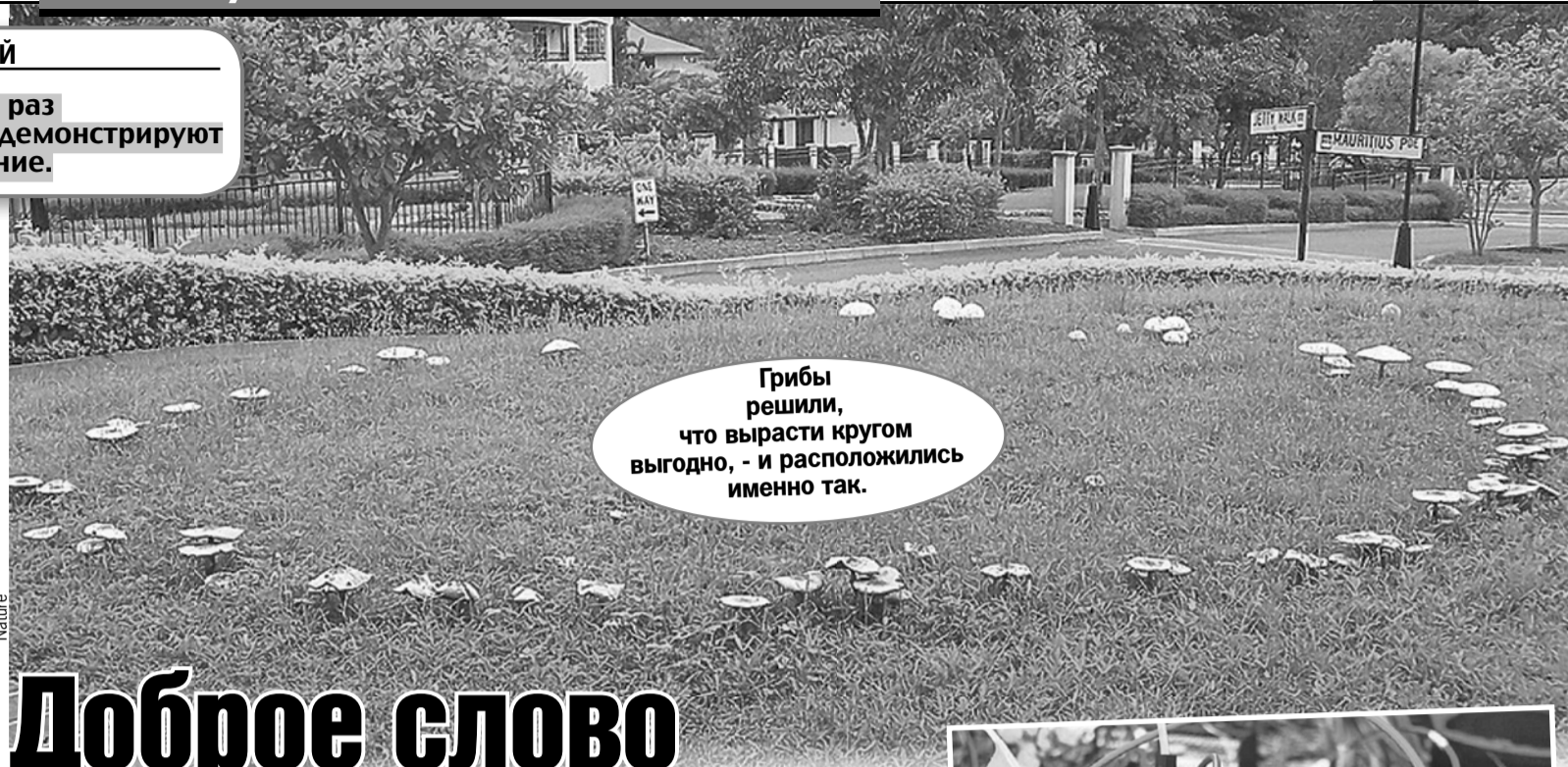
Грибы решили, что вырасти кругом выгодно, - и расположились именно так.

Грибы не стали расти как попало - хаотично. Или равномерно, начиная с центра фигур. Они каким-то образом «уяснили» суть, разобрались в диспозиции и будто бы «сообразили», как именно лежат деревянные дощечки. Потому что стали разрастаться в за-