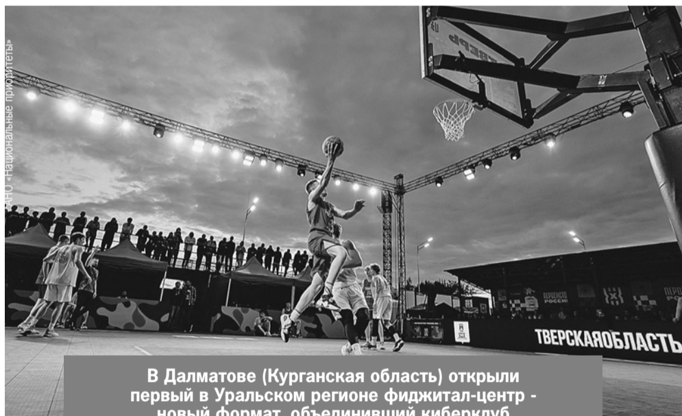
АНО «Национальные приоритеты»

Свои спортивные объекты получают не только региональные центры, но и малые населенные пункты. Сейчас под Тулой в поселке Скуратовский (рядом с толстовской усадьбой Ясная По-