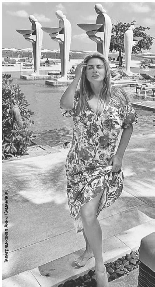
Telegram-канал Анны Семенович

«На Бали надо лететь надолго, но даже короткая неделя подарит мне заряд сил и яркие эмоции, - пишет Анна. - Я давно открыла для себя этот магический остров. Это место настолько захватывающее, с мощной энергетикой, что каждый раз, когда я уезжала, в душе оставалась сильная тяга вернуться сюда. Наслаждаюсь волшебством и красотой этого невероятного острова. У нас в отеле великолепный пляж - белоснежный песок под ногами, роскошные мягкие лежаки. Здесь я восстанавливаю силы и готовлюсь к насыщенному графику в ноябре и декабре».