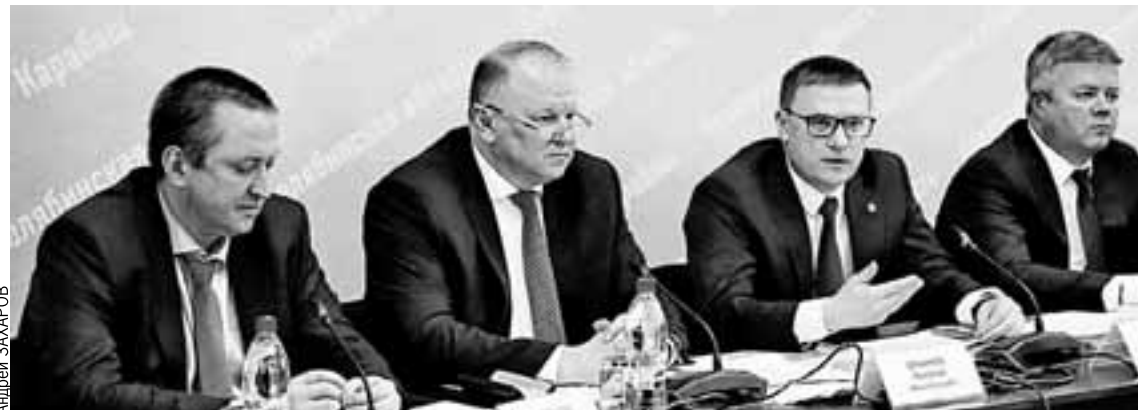
Полпред президента в УФО Николай Цуканов (второй слева) и губернатор Челябинской области Алексей Текслер (третий слева) договорились вместе отстаивать интересы уральских моногородов в Москве.

лодые люди и лучшие кадры. Как сообщил полпред президента в УФО Николай Цуканов, согласно опросам, 24% жителей моногородов готовы сменить место жительства, если проблемы территории не будут решаться. Недовольство вызывают состояние медицины, социальной сферы, качество оказания услуг ЖКХ, комфорт городской среды и другие вопросы.