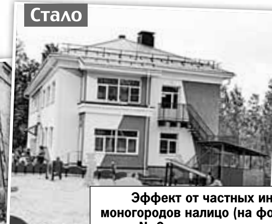
Эффект от частных инвестиций в соцсферу моногородов налицо (на фото - карабашский детский сад № 9, реконструированный на средства РМК).