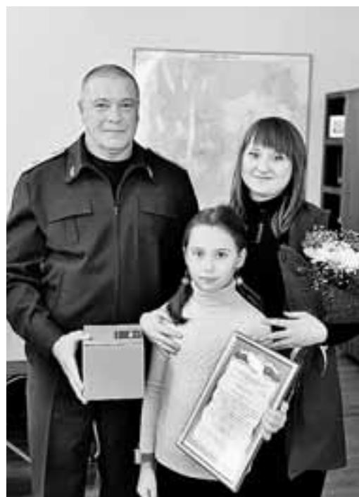
Мужественная продавщица (на фото - справа) получила медаль от Следственного комитета, а ее дочь мамой очень гордится!