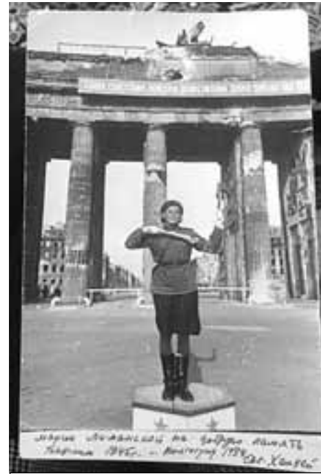
Оригинал знаменитого фото с автографом автора.