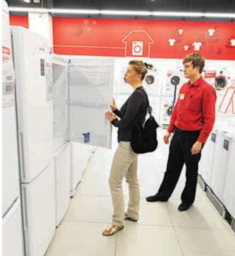
Холодильники «Саратов» не выдержали конкуренции на рынке.

Также в кадровую службу предприятия переданы информационные материалы: буклеты, памятки, листовки, содержащие