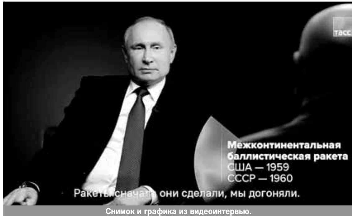
Снимок и графика из видеоинтервью.

месте - Китай, на третьем, как ни странно, Саудовская Аравия, потом Великобритания, потом Япония, Япония нас обогнала, потом только мы. Более того, наши расходы из года в год сокращаются. А расходы других стран растут. Мы ни с кем не собираемся воевать, но мы создаем такую ситуацию в сфере обороны, чтобы никому в голову не пришло воевать с нами.