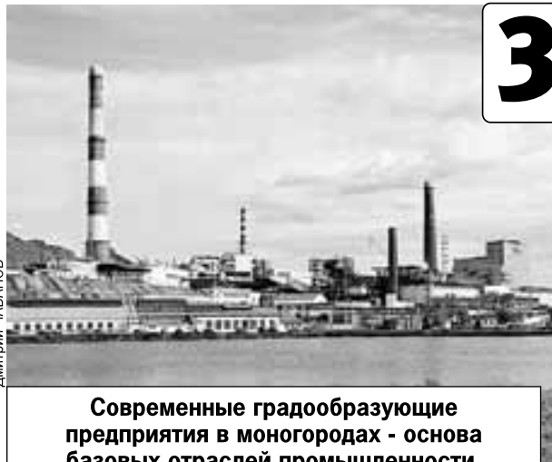
Современные градообразующие предприятия в моногородах - основа базовых отраслей промышленности.