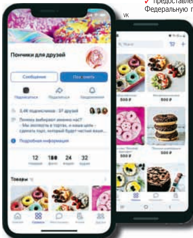
Рекламную кампанию можно провести с выгодой.

Как отмечают в Центре «Мой бизнес», бонусные рубли нельзя перевести на другой рекламный кабинет или вывести на карту.