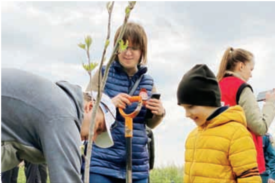
Деревья в память о победителях сажают по всей стране.