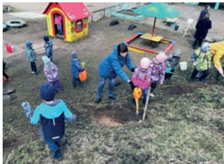
В акции «Сад памяти» с удовольствием принимают участие дети всех возрастов.