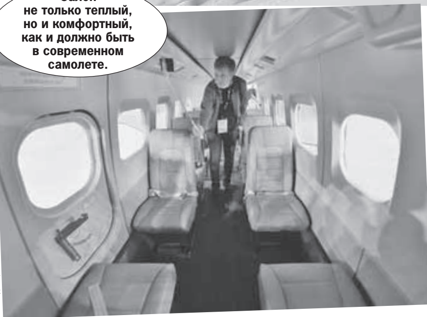
Владимир ВЕЛЕНГУРИН/КП - Москва

Заглянем в кабину - да это просто мечта любого летчика! Красота, изящество и заводится с пол-оборота!