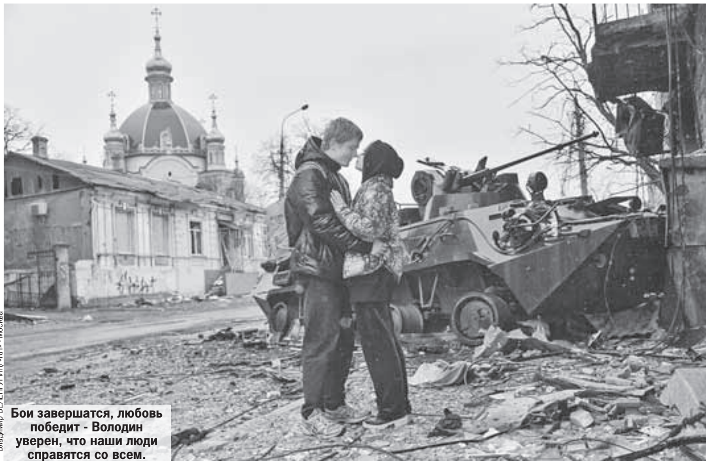
Бои завершатся, любовь победит - Володин уверен, что наши люди справятся со всем.