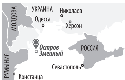
Украинский остров в Черном море. Входит в состав Измаильского района Одесской области. Площадь - 0,17 км².