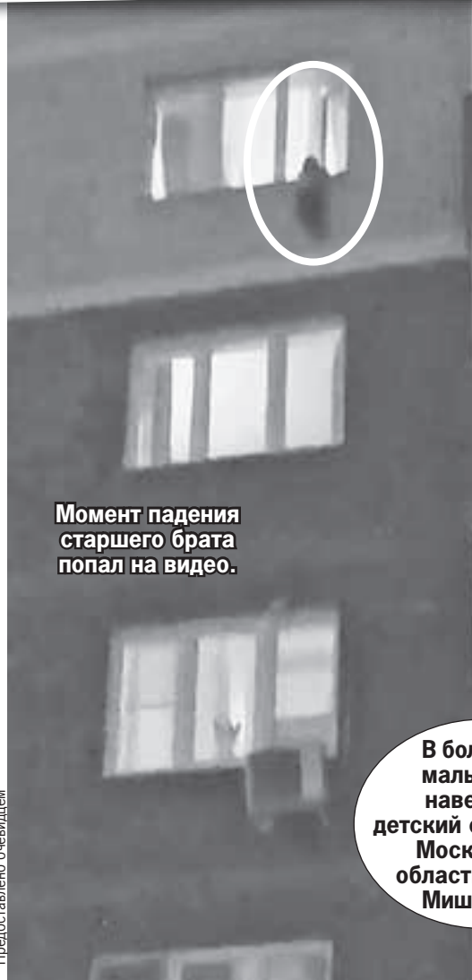
Момент падения старшего брата попал на видео.