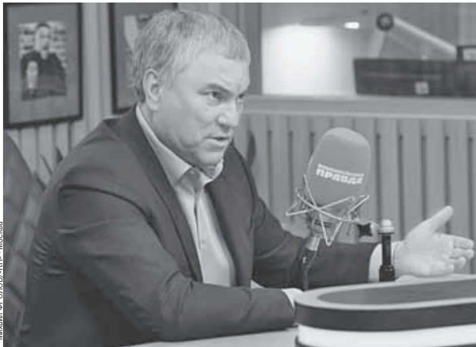
Вячеслав Володин в студии Радио «Комсомольская правда»: «Дальнейшая судьба освобожденных территорий Украины должна зависеть только от их населения».

А что касается «не договорившихся политиков», то они всем известны. Зеленский, Байден, главы стран НАТО. К ним вопросы. К нам какие вопросы? Мы предлагали диалог. Мы его вели. Но когда возможности дипломатии были исчерпаны и угроза пришла в наш дом, началась операция. И надо исходить из того, что граждане нашей страны