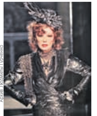
Архив Людмилы Гурченко

Этот головной убор сделан в 1980-е годы из шелка, золотого шитья, стекляруса, бисера, жемчуга, латуни, стразов и другого материала. Гурченко доработала шляпку лично - сверху нашла брошь с жемчужинами и часто выступала в ней на концертах.