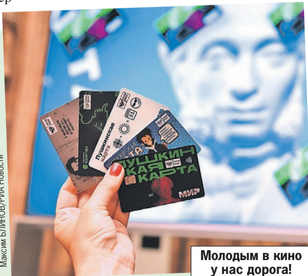
Молодым в кино у нас дорога!

С 1 февраля Пушкинской картой для молодежи можно оплачивать билеты в кино. Правда, не на любые фильмы. В списке - те, что созданы при поддержке Минкульта, Фонда кино и региональных органов власти, а также из золотой коллекции отечественного кинематографа. Что именно посмотреть за госсчет, можно выбрать в приложении «Госуслуги Культура» или на сайте культура.рф.