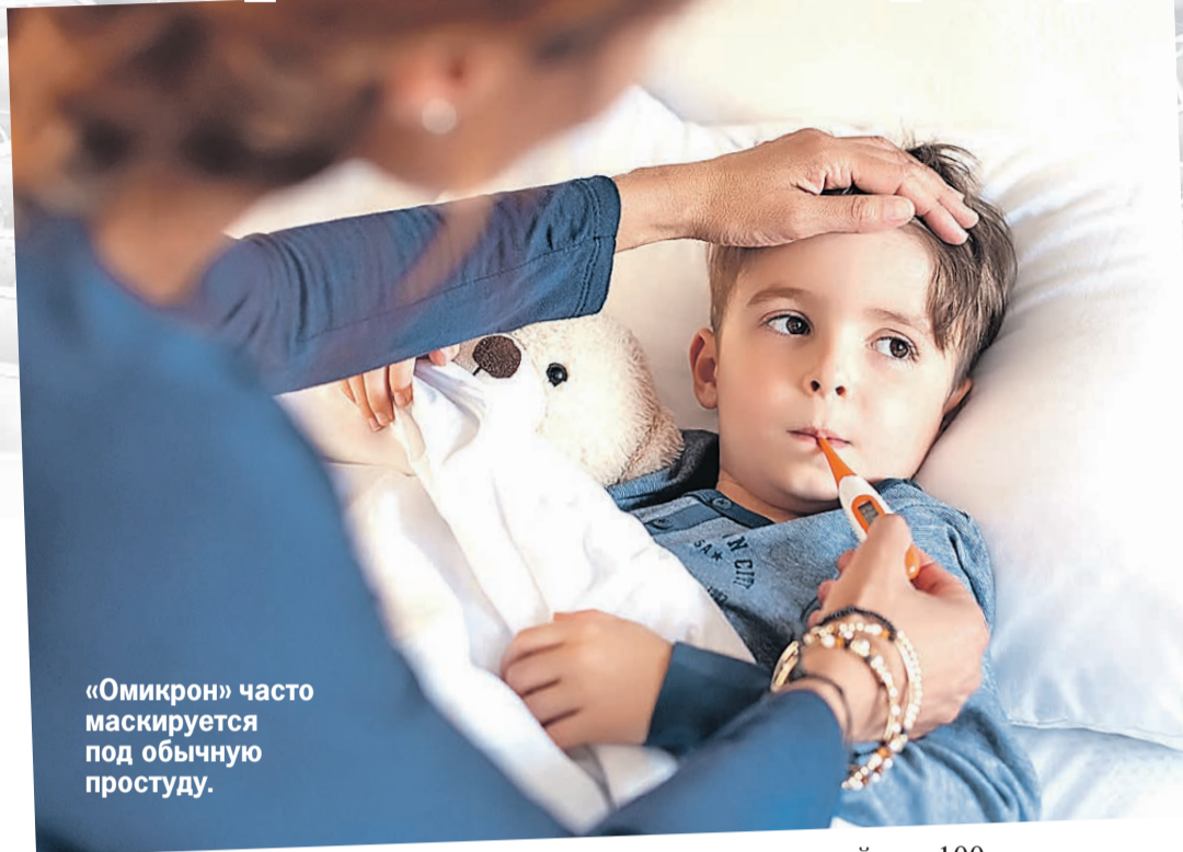
«Омикрон» часто маскируется под обычную простуду.