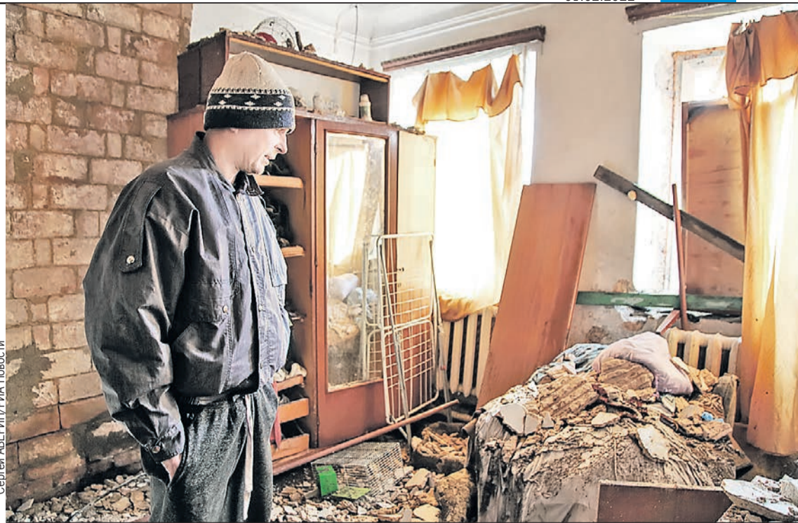
На Украине сейчас из каждого утюга вещают о грядущем «российском вторжении», а ВСУ между тем продолжают методично обстреливать города и поселки ДНР и ЛНР. Диалог с республиками Киев вести не желает. На фото: житель Донецка в своем доме на улице Дружбы, в крышу которого попал снаряд.

Сергей Лавров: - Президент отвечал на этот вопрос: если Зеленский хочет обсуждать нормализацию двусторонних отношений, страдающих от действий его режима, мы готовы - пожалуйста, пусть приезжает в Москву, в Сочи, в Петербург. Но если он хочет обсуждать Донбасс, идите, пожалуйста, в контактную группу, в которой должны напрямую рассматриваться все вопросы урегулирования между Киевом и Донецком, Киевом и Луганском. А когда он заявляет, что не будет с ними разговаривать, это плохо для внутриукраинского кризиса.