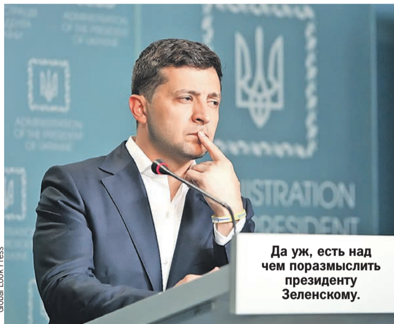
Да уж, есть над чем поразмыслить президенту Зеленскому.

На месте ЦРУ я бы так уж сильно не рассчитывал на необандеровцев. Нагадить они, конечно, могут. Но переломить ситуацию, взять власть - нет. Разумеется, если остальные граждане Украины не захотят еще раз наступить на бандеровские грабли русофобской самостоятельности. Но что такое, неуловимо разлитое в воздухе подсказывает, что второй серии у этой бандеровской истории не будет.