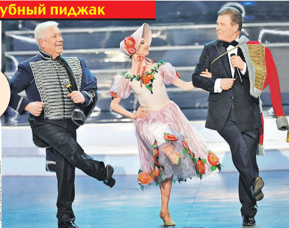
Лев Валерьянович на юбилее и поет, и спляшет - может, даже канкан, как было на 70-летию. Ну а верный друг Владимир Винокур его, как всегда, поддержит.

Сегодня легендарный певец празднует 80-летие.