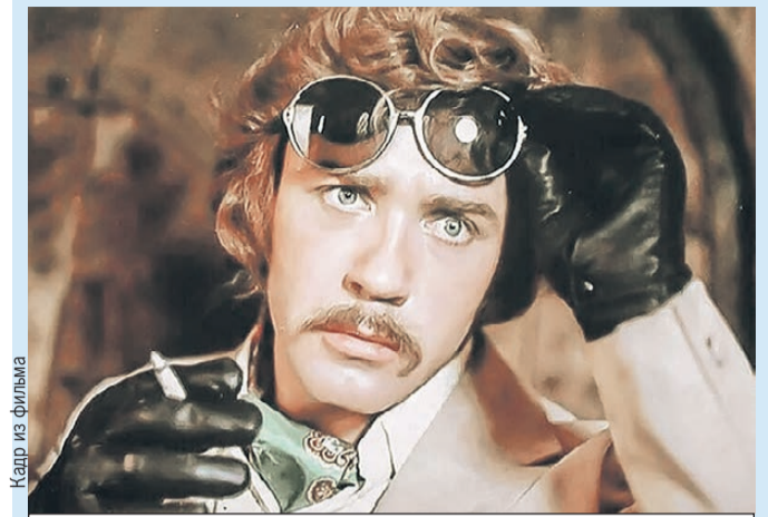
Артист сыграл более 200 ролей в кино (кадр из комедии «Иван Васильевич меняет профессию»).