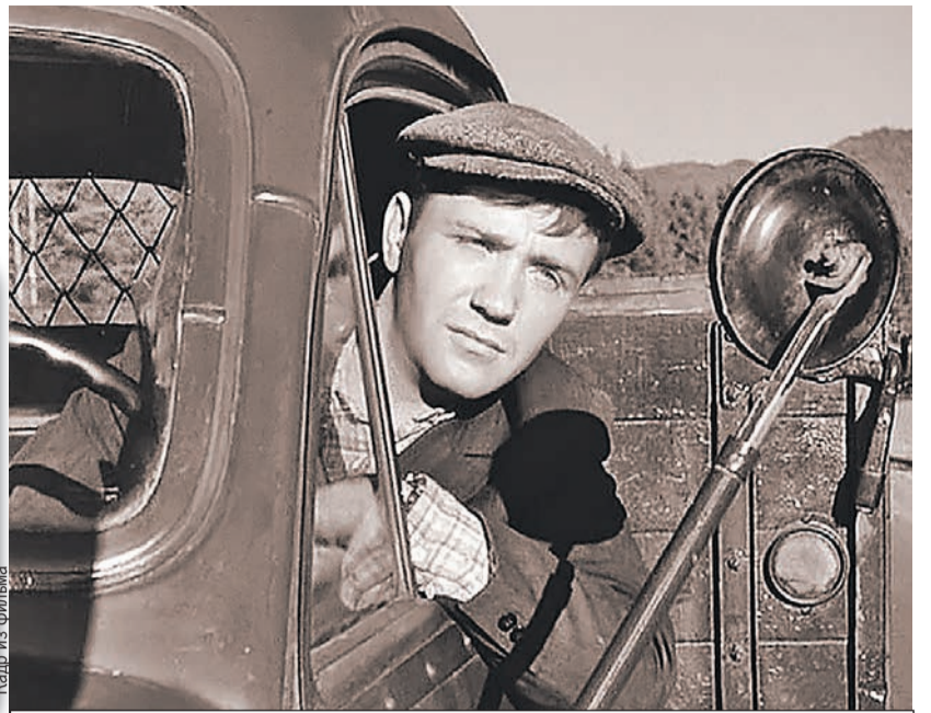
Роль шофера Паши Колокольникова актер называл любимой и лучшей («Живет такой парень», 1964, режиссер - Василий Шукшин).

Однако никакие уловки не помогли разрушить амплу народного героя. Самым обаятельным и узнаваемым из них был, без сомнения, сантехник Афоня. Несмотря на мегапопулярность, Леонид Вячеславович своей славой никогда не пользовался. Он как будто бы ее не замечал. И был верен своей жене Нине, которую обожал и с которой прожил 52 года.