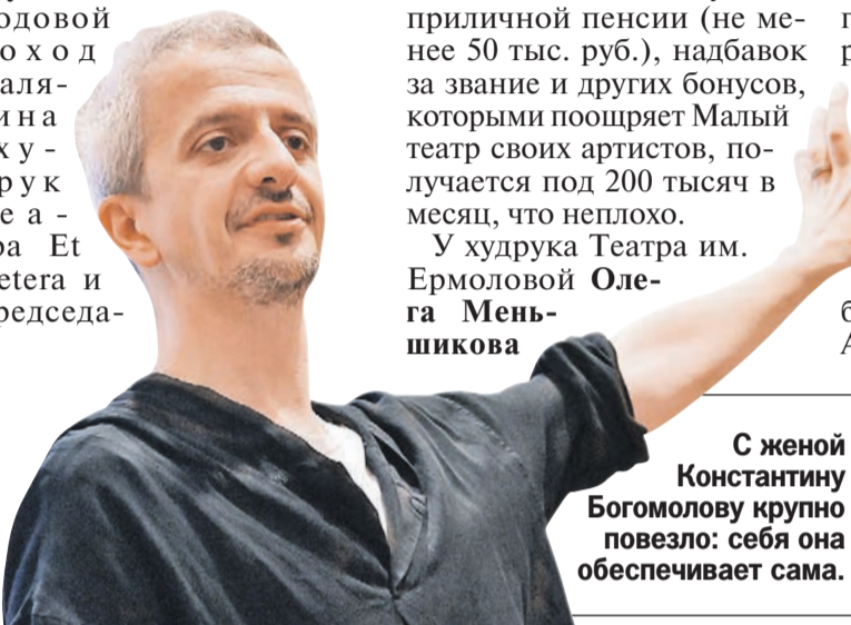
С женой Константину Богомолову крупно повезло: себя она обеспечивает сама.