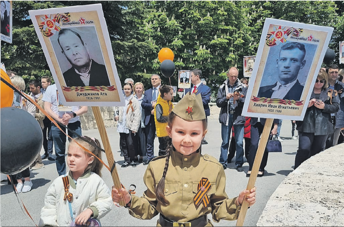
Несмотря ни на что, в Анкаре в этом году прошел «Бессмертный полк».

гий. - Они трудяги. Видишь бледного чудака, бредущего с пляжа, - он! Под зонтом программировал. Вот кого много - так это праздных балбесов. Деток от армии прячут. Напокупали в свое время недвижимости, теперь вспомнили, приехали. Сынкам по 17 - 18 лет, а с ними бабушка или тетюшка для контроля. Вот и живут на квартирах, домах, виллах. Пережидают. А прав батюшка.