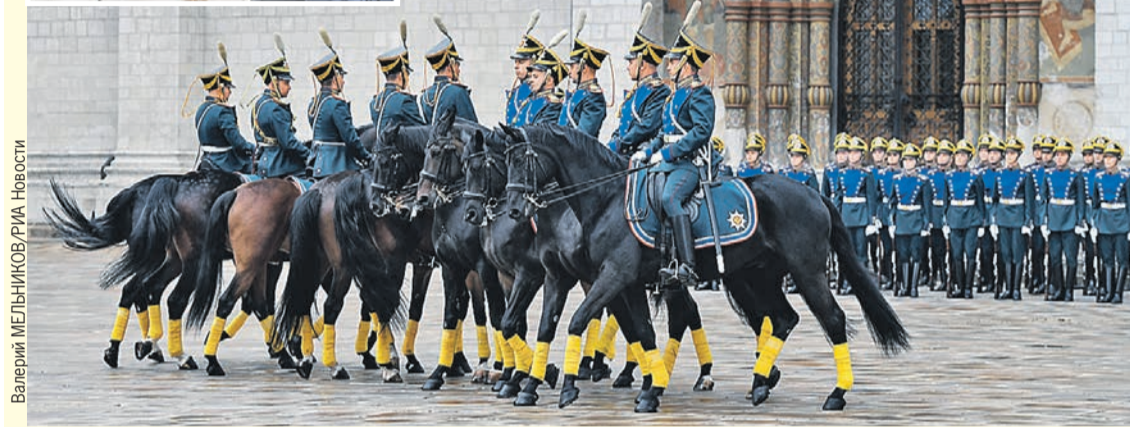
Валерий МЕЛЬНИКОВ / РИА Новости