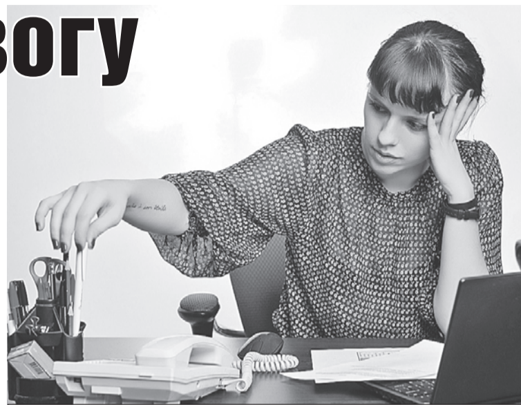
- Может, ну его, этот отчет? Пойти к доктору?

Очень сильная головная боль, начавшаяся внезапно и сразу во всю мощь, может быть симптомом разорвавшейся аневризмы. А это смертельно опасно! Аневризма - это «тонкое место» кровеносного сосуда. Оно может быть где угодно - и иногда находится в мозге. Там, где тонко, там может порваться.