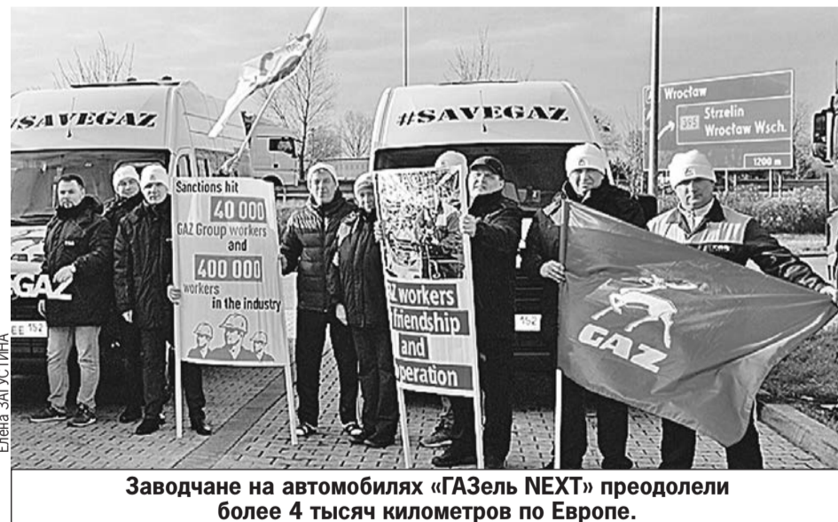
Заводчане на автомобилях «ГАЗель NEXT» преодолели более 4 тысяч километров по Европе.