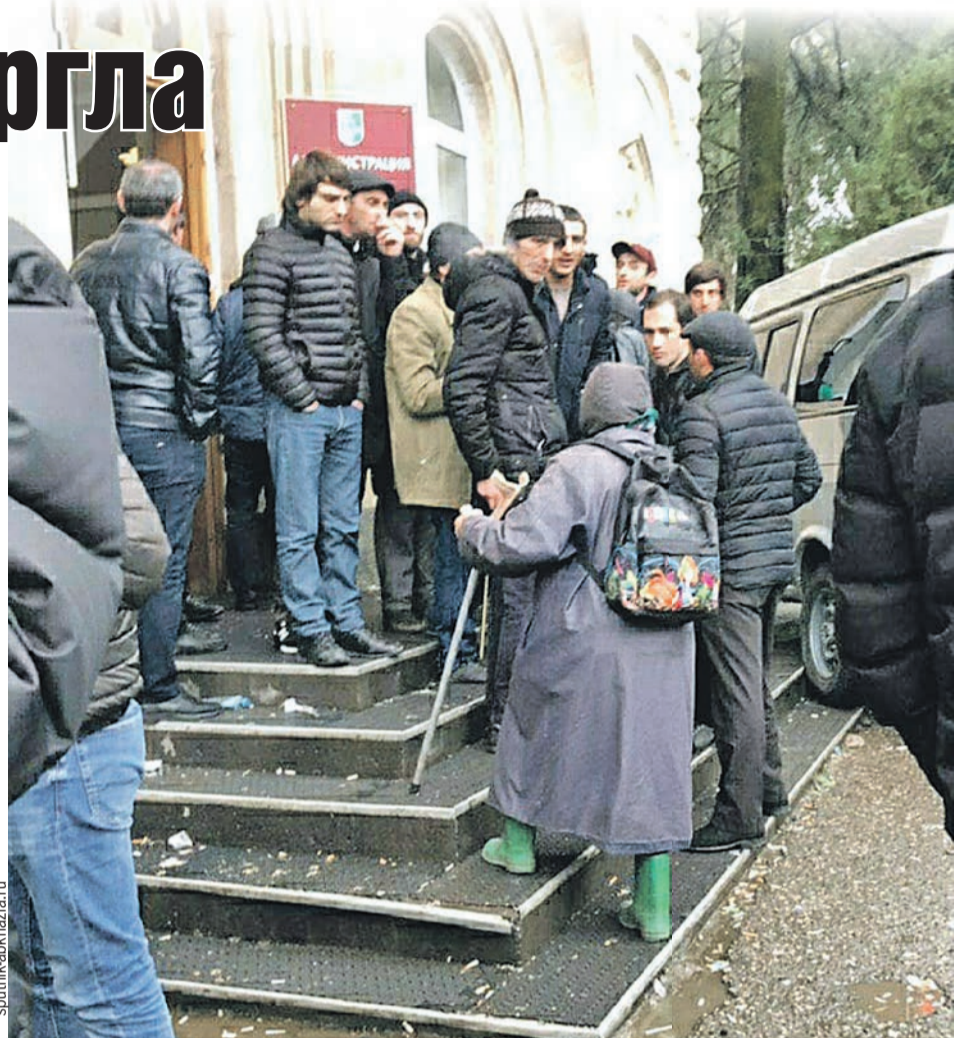
Бабушка пришла в Сухум ко дворцу за пенсией - а тут опять революция!

Хаджимба не захотел (или не смог) защитить даже своего вице-президента, которого побили какие-то влиятельные люди. Не