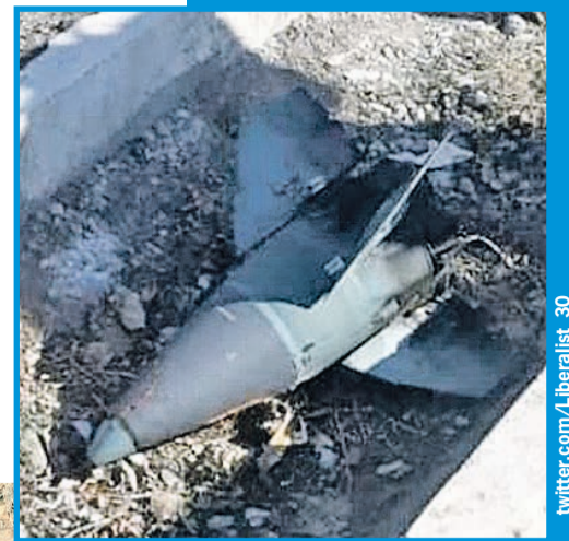
Головной обтекатель боевой части ракеты, поразившей «Боинг».

В итоге, несмотря на всю взаимную неприязнь, и Запад, и Иран неожиданно сходятся в одном: запуск той роковой ракеты «земля - воздух» произошел по ошибке. Похоже, это объяснение и можно считать наиболее близким к правде?