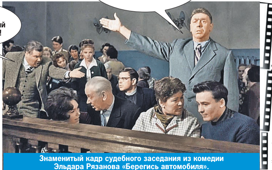
Знаменитый кадр судебного заседания из комедии Эльдара Рязанова «Берегись автомобиля».

- Для нас, элиты, должен быть особый Уголовный кодекс!