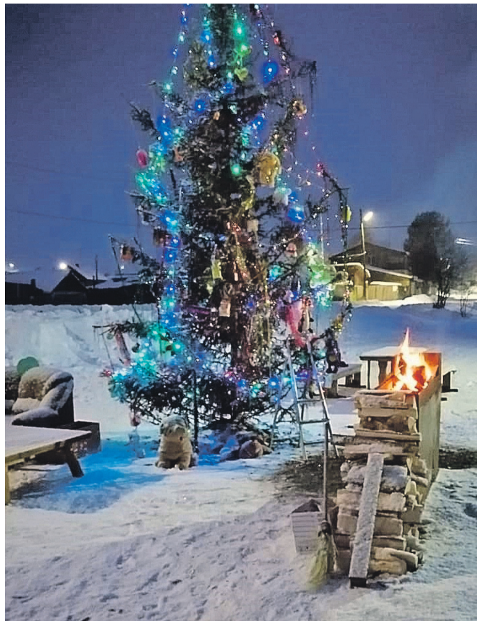
Не бог весть какая красота, но местным жителям это местечко нравилось - обустроили его всем селом.