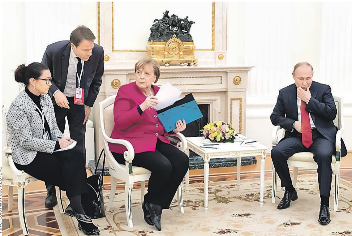
Канцлер Ангела Меркель прилетела в Москву, чтобы подтвердить президенту Владимиру Путину свою решимость сделать все ради получения газа из России напрямую.

стоятельно, без привлечения иностранных партнеров, - подтвердил Путин. - Вопрос в сроках. Это единственный вопрос, который встанет в этой связи. Окончание строительства будет отодвинуто на несколько месяцев.