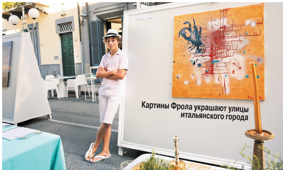
Картины Фрола украшают улицы итальянского города