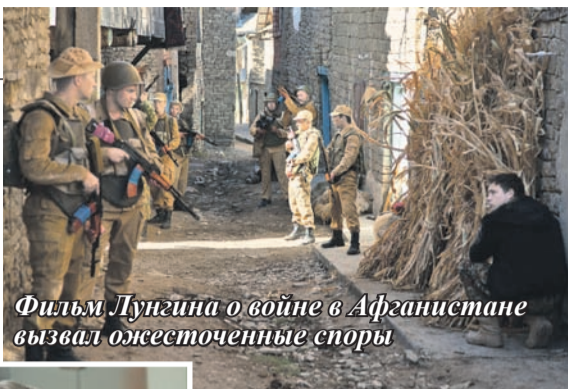
Фильм Лунгина о войне в Афганистане вызвал ожесточенные споры