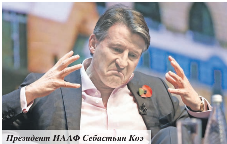
Президент ИААФ Себастьян Коэ

сколько лет он бросит и ее. Коэ безуспешно попытался через Высокий суд в Лондоне заставить прессу не писать об истории с абортom. Завершив спортивную карьеру, Себ ринулся в политику, где оченьгодились его спортивные «навыки». Сперва он стал личным парламентским