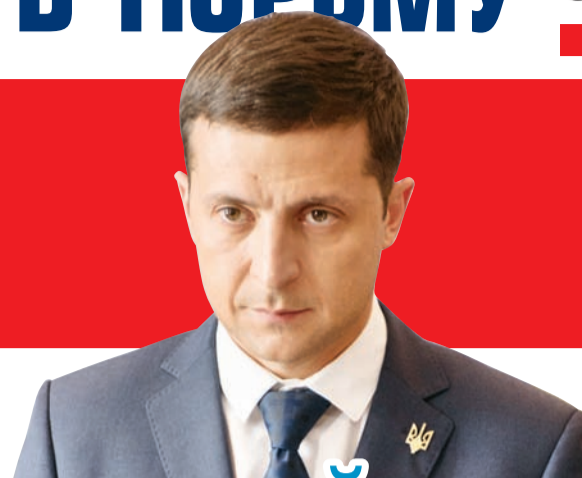
КАДР ИЗ СЕРИАЛА «СЛУГА НАРОДА»