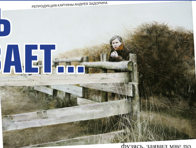
РЕПРОДУКЦИЯ КАРТИНЫ АНДРЕЯ ЗАДОРИНА

не принимает, либо отмахивается, мол, лезу не в свое дело, или требует, чтобы внесла в число организаторов ее саму, ее зама. И тогда получается: то, что мы придумали с детьми, на корню рубится, то, что я придумала и сделала, сделала и не я вовсе...»