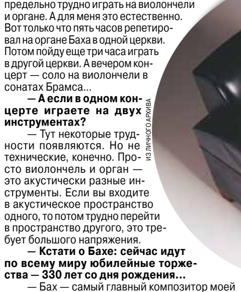
ИЗ ЛЮБЕЦКОГО АРХИВА