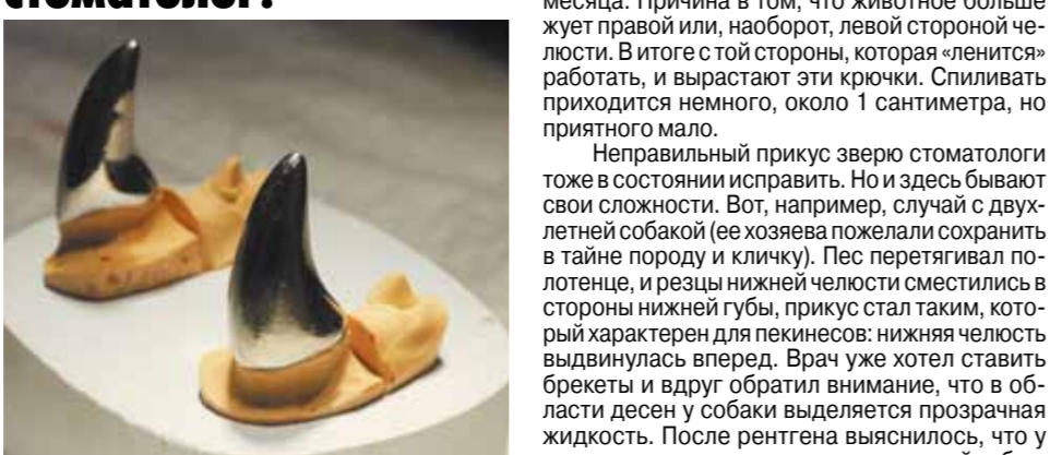
Коронки для собак, как и для людей, изготавливаются при помощи слепков челюсти.