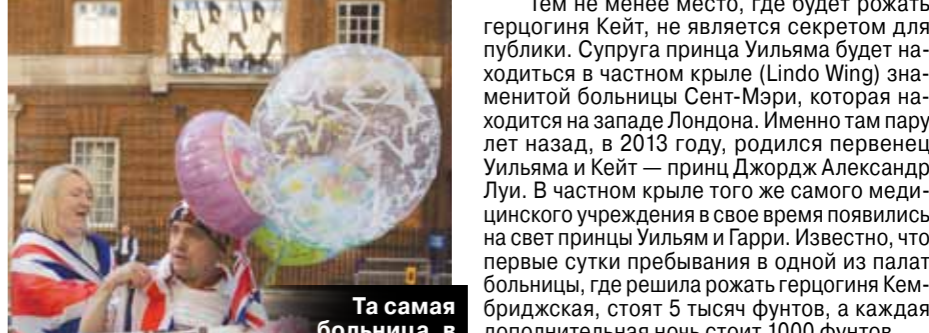
Та самая больница, в которой будут проходить очередные роды Кейт.

Тем не менее место, где будет рожать герцогиня Кейт, не является секретом для публики. Супруга принца Уильяма будет находиться в частном крыле (Lindo Wing) знаменитой больницы Сент-Мэри, которая находится на западе Лондона. Именно там пару лет назад, в 2013 году, родился первенец Уильяма и Кейт — принц Джордж Александр Луи. В частном крыле того же самого медицинского учреждения в свое время появились на свет принцы Уильям и Гарри. Известно, что первые сутки пребывания в одной из палат больницы, где решила рожать герцогиня Кембриджская, стоят 5 тысяч фунтов, а каждая дополнительная ночь стоит 1000 фунтов.