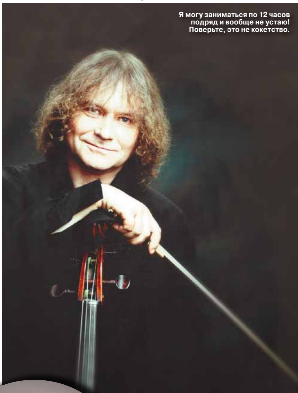
Я могу заниматься по 12 часов подряд и вообще не устаю! Поверьте, это не кокетство.

— Сохранились, но они чистые. Бах писал НАПРЯМУЮ. Ну есть какие-то опечатки-ошибки, но о них не со-чи-ня-ли, не мучился. Такое впечатление, что ему ангел диктовал, а он просто брал и записывал. К каждому новому