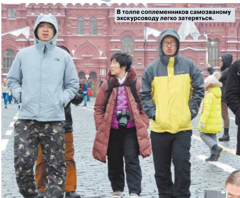
В толпе соплеменников самозваному экскурсоводу легко затеряться.

Как и туристы из других стран, китайцы очень