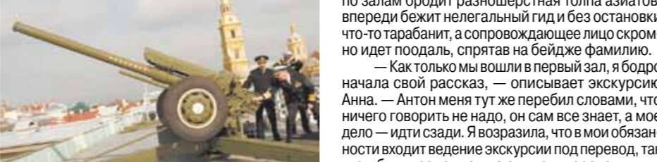
За выстрел знаменитой пушки в Петропавловке с туристов берут деньги.

любят матрешки. Об эскизах художника Малютина горе-экскурсоводы слыхом не слыхивали, поэтому сочинили свою версию возникновения русского сувенира. Звучит она так: «В давние времена в России жил мастер по имени Матреш. У него было много дочерей и мало места в доме. И тогда он решил, что можно прятать одну дочку в другую — так и появились матрешки».