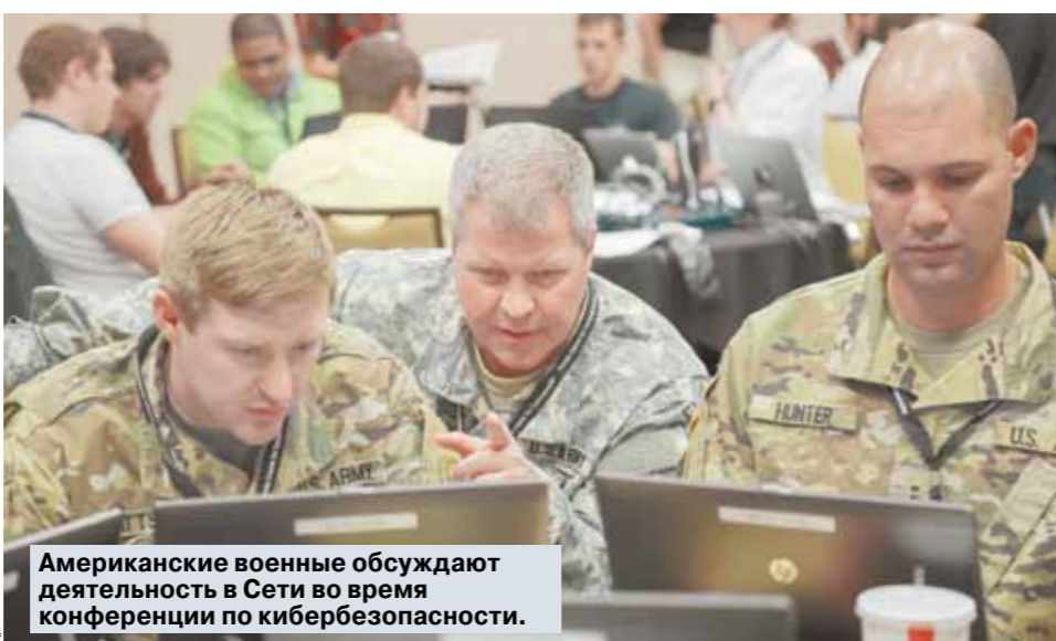
Американские военные обсуждают деятельность в Сети во время конференции по кибербезопасности.

Во-первых, в зону контроля управдомов входит только общедомовое оборудование. То есть кусок трубы от входа в дом и до загибающегося устройства на входе в квартиру. Все, что осталось на улице, — забота поставщика газа в лице районного или городского газового управления. За все, что в квартире — плиту, колонку, гибкие шланги, — головой отвечает собственник жилья. Во-вторых, ходить по этажам и приходить к соседям едва уловимому запаху коварного газа сами коммунальщики вовсе не должны.