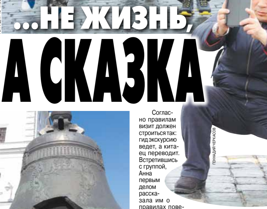
Царь-колокол, по версии «гидов» из Поднебесной, раскололся после выстрела Царь-пушки.