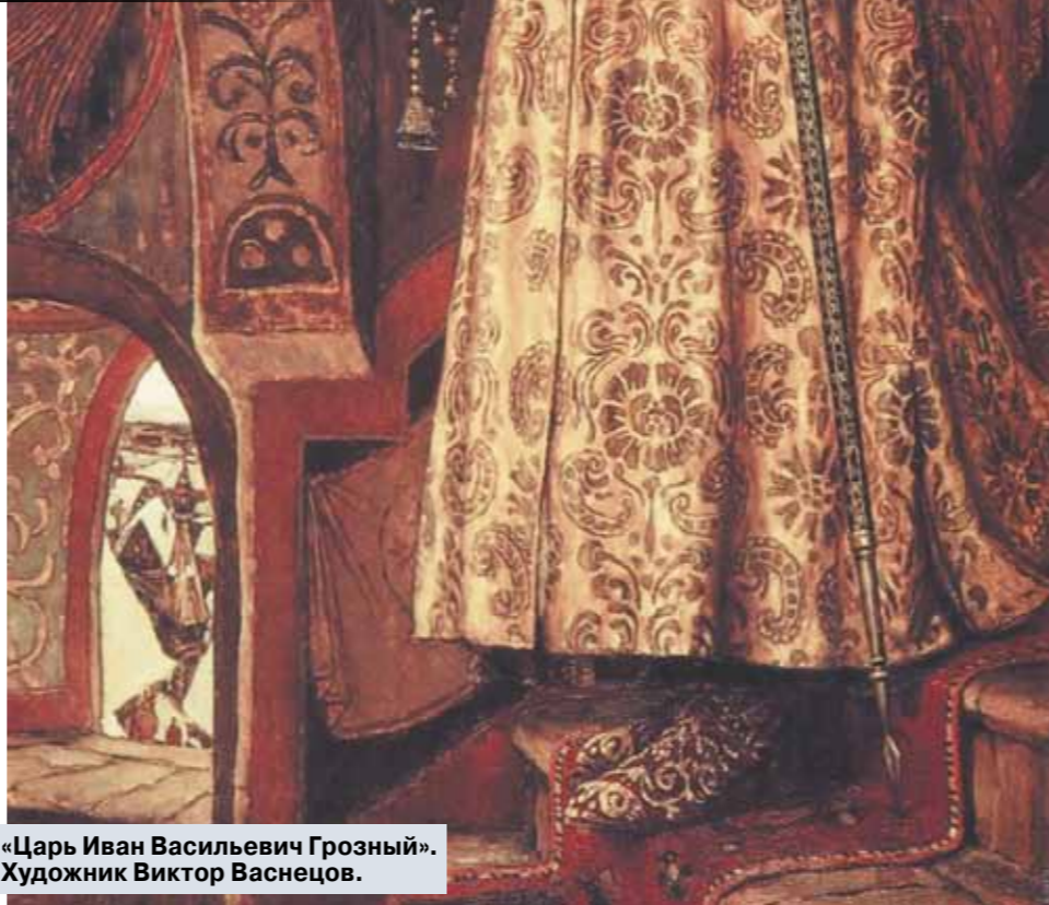
«Царь Иван Васильевич Грозный». Художник Виктор Васнецов.

Кроме того, свидетельства о казнях во множестве присутствуют в русских летописях. Правда, летописного дела как централизованного института на тот момент уже не существовало. Но остались местные летописи. Есть псковская летопись, есть вторая новгородская летопись. Обе содержат немало сведений о том, что происходило в этих городах в годы опричнины. Велись летописные записи и в монастырях северной Руси. Кроме того, существуют летописи первой трети XVII века. В первую очередь речь идет о Пискаревском летописце — этот документ содержит очень выразительное, а главное, точное описание опричных казней. Поэтому утверждать, что информация о жестокостях грозинского правления исходила только от иностранцев, совершенно не верно. Русских источников, относящихся к этому периоду,