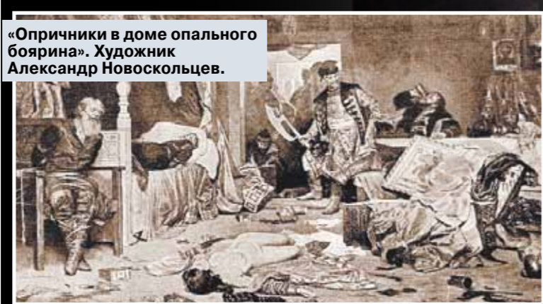
«Опричники в доме опального боярина». Художник Александр Новоскольцев.

— Нельзя не видеть, что личность и деяния Ивана IV подвергаются в последние времена в России серьезному переосмыслению: различные представители элиты соревнуются друг с другом в том, кто более цветисто похвалит Ивана Васильевича. Вот характерный пример