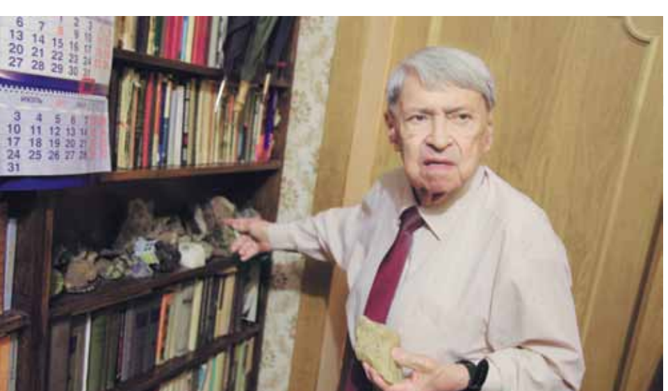
Академик Юрий Трутнев показывает образцы породы из озера Чаган.

Но даже после этого она осталась самым мощным смертельным оружием, которое когда-