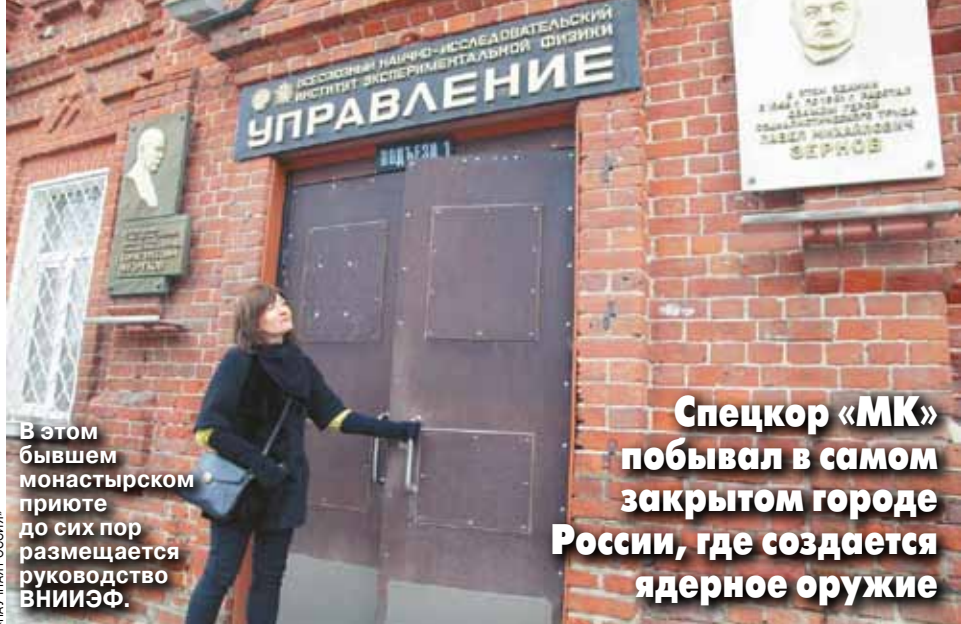
В этом бывшем монастырском приюте до сих пор размещается руководящий ВНИИЭФ.