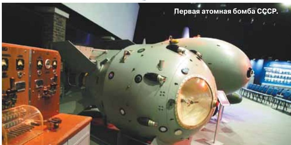
Первая атомная бомба СССР.