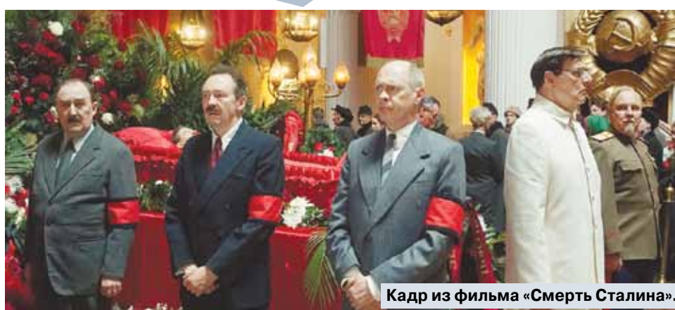
Кадр из фильма «Смерть Сталина».

ОТВЕТЫ НА КРОССВОРД, ОПУБЛИКОВАННЫЙ 5 ДЕКАБРЯ ПО ГОРИЗОНТАЛИ: 1. Держава. 4. Опосум. 10. Восторг. 11. Антракт. 13. Опыт. 14. Сени. 15. Грунтовка. 16. Ерунда. 18. Стресс. 20. Пружина. 22. Катерка. 23. Мембрана. 24. Чайн-ворд. 27. Панорама. 30. Аукцион. 32. Сопляк. 34. Смычок. 35. Обработка. 36. Обед. 38. Юнга. 39. Ремесло. 40. Окраина. 41. Кузница. 42. Кандлер.