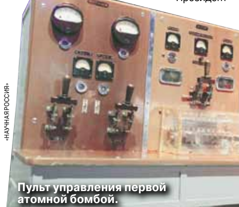
Пульт управления первой атомной бомбы.

К 1949 году у американцев уже готов был план уничтожения 20 самых крупных советских городов.