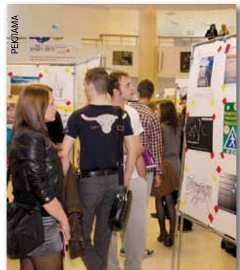
Все условия участия можно узнать на сайте artstart.ru

Фестиваль ART.START появился в 2005 году как небольшой творческий конкурс для студентов факультета рекламы МФЮА. Но очень скоро он перешагнул за рамки учебного проекта и объединил школьников и студентов со всей России и зарубежья. Конкурсная программа Фестиваля не ограничивается темными тематическими рамками, есть лишь общие рекомендации по направлениям: семейные ценности, здоровый образ жизни, многообразие культур, образование и пр. В рамках Года экологии особая номинация предусмотрена для работ, посвященных проблемам защиты окружающей среды. На конкурс принимаются проекты наружной и печатной рекламы, видеоролики, короткометражные фильмы, фотографии, социальные рекламные кампании и PR-проекты. Заявки принимаются до сентября. Возраст участников от 13 до 35 лет.