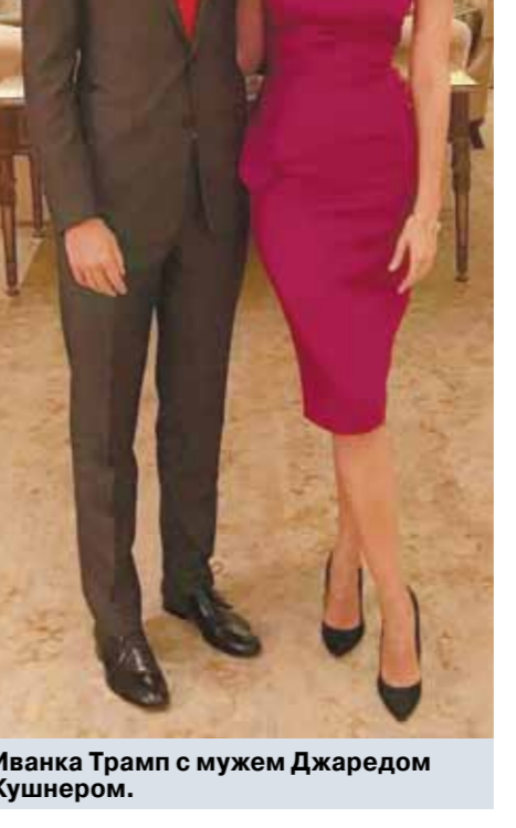
Иванка Трамп с мужем Джаредом Кушнером.

«Мягкая сила» Иванки используется и в международной политике. Так, на встрече с