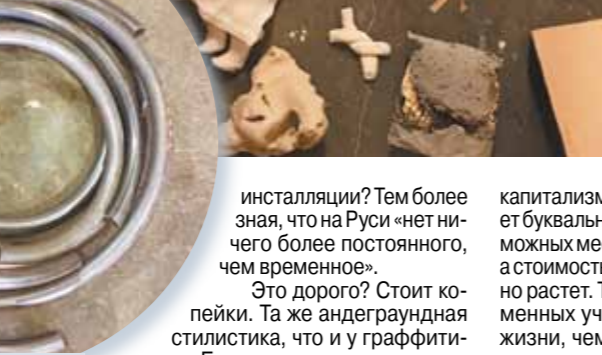
Джон Клемент. Автопортрет.

инсталляции? Тем более зная, что на Руси «нет ничего более постоянного, чем временное». Это дорого? Стоит копейки. Та же андеграундная стилистика, что и у граффитистов. Биеннале на свалках честнее, чем фасулные биеннале в комплексе хай-тексовых пространствах. И это реально торкает, как, скажем, известная скульптура из текстильных отходов в Гонконге, поднимающая проблему перепроизводства. А что думают наши спикеры? — Меня вообще не беспокоит, будут вскоре уничтожены мои работы или нет, — говорит канадская художница и скульптор Карен Лофгрэн (Karen Loifgren), — вся человеческая культура становится сначала историей, а потом археологией. Мы создаем произведения, которые потом живут собственными жизнями, за ними уже не угнаться — у них своя временная шкала, свое логическое число. Одинаково справедливы как и мусор, и к Джаккометти. — Знаете, такой тип покровителя, который поддерживал Родена или Джакомоетти, сегодня встречается нечасто, — подхватывает американец Джим Дессичино (Jim Dessicino). — И я понимаю тех, кто ищет вдохновение в строительном мусоре. Любо мне экологически сознательнее, либо — это чаще — у них просто нет бюджета на другие материалы. Недостаточное финансирование искусства в США напрямую подталкивает к такому типу творчества. — Вау, я обожаю использовать заброшенные помещения, — отзывается Майкл Бейц. — В этом свобода творчества и культурный жест. В США