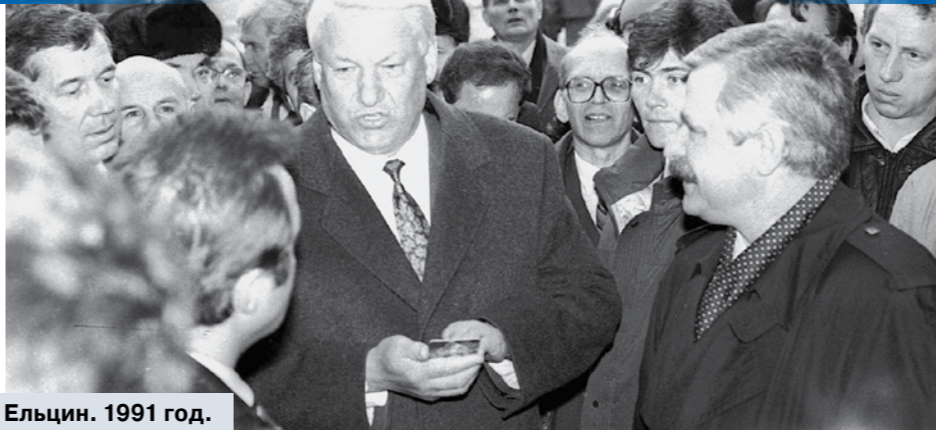
Ельцин. 1991 год.

В последние недели к этой паре, если верить опросам, достаточно близко подобрался ультраправый Жан-Лук Меланшон и кандидат от партии «Республиканцы» Франсуа Фийон.