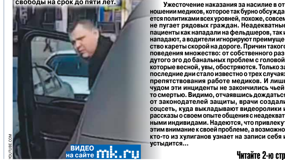
ВИДЕО на сайте mk.ru

Хамское поведение по отношению к медикам детской «неотложки» теперь может обернуться для задержанного водителя лишением свободы на срок до пяти лет.