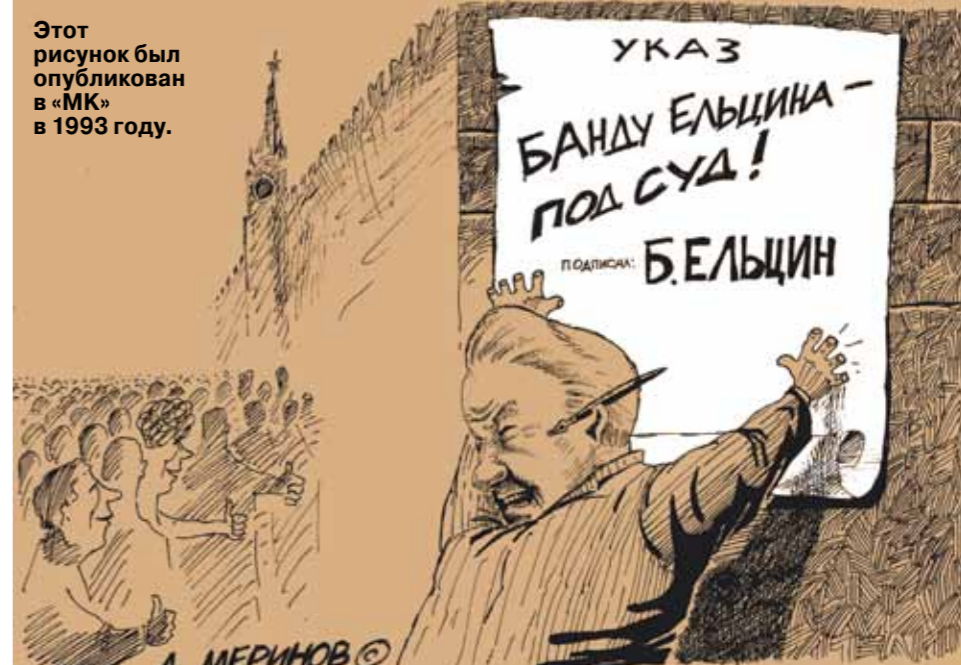
Этот рисунок был опубликован в «МК» в 1993 году.