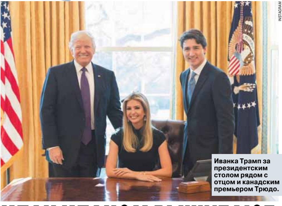
Иванка Трамп за президентским столом рядом с отцом и канадским премьером Трюдо.