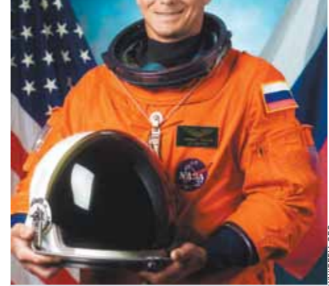
Геннадью Падалке уже не удастся обновить рекорд.