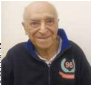
20 сентября ожидается увидеть его в спектакле «Пристань».

Народный артист СССР Владимир Этуш был госпитализирован в Москве после спешного возвращения из Италии, где он отдыхал с супругой, — за границей состояние актера ухудшилось. Владимир Абрамович находится под пристальным наблюдением врачей, которые держат ситуацию под контролем. Жена в данный момент ограничивается лишь лаконичными комментариями: «Ему лучше». Медицине источники подтвердили «МК» эту информацию, добавив, что при помощи супруги любимый артист сумел встать и даже пройтись по коридору. Примерно через два месяца в театре Вахтангова начинается новый театральный сезон, все желают Владимиру Абрамовичу выздоровления.