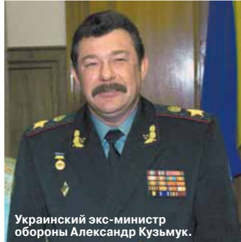
Украинский экс-министр обороны Александр Кузьмук.

Правда, в 1999 году после натовских бомбардировок Югославии под чужбыми украинскими политиков вдруг зашевелились мозги, и как будто чуть наступило просветление: а что если и с нами вот так же — в обход Уставу ООН? Так что в Киеве решили окончательно военных контактов с Россией пока не рвать, и небольшая украинская делегация прилетела в Ашулук на учения ПВО СНГ.