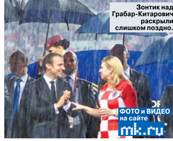
Зонтик над Грабар-Китарович раскрыли слишком поздно.