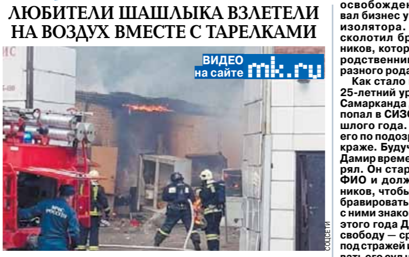
Столовая, предлагающая посетителям блюда восточной кухни на Авиационной улице, взлетела на воздух 16 июля от взрыва газового баллона. Пострадала как минимум восемь человек — узбеки и таджики.

Как выяснил корреспондент «МК» на месте происшествия, в экстренные службы в 15.46 позвонили сразу несколько очевидцев. Они услышали хлопок, два взрыва, а затем увидели подвигавшийся сизый дым. Сначала все решили, что взорвался автосервис, но выяснилось, что мастера тут совсем ни при чем. Набедокурили работники точки общепита, расположившейся на заворках ресторана «Я Самарканд». Там на кухне взорвался газовый баллон. На момент поджигания номера было известно о восьми пострадавших — все они получили ожоги и некоторые ранения. Ожог, не дожидаясь приезда медиков, побежали в аптеку — за бинтами и мази. У кого-то фармацевты видели покрасневшие руки, другие пострадали куда серьезнее. Руководители трапезной, оценивая масштабы бедствия, просто сбежали. Роспотребнадзор начал свою проверку. А следователи будут выяснять, кто истинный владелец заведения — у столовой были как арендаторы, так и субарендаторы.