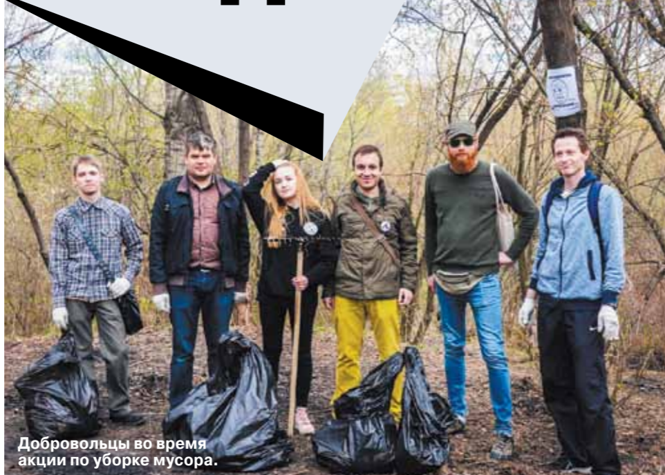
Добровольцы во время акции по уборке мусора.

«Зеленые» силы призывают не оставаться равнодушными к экологическим проблемам