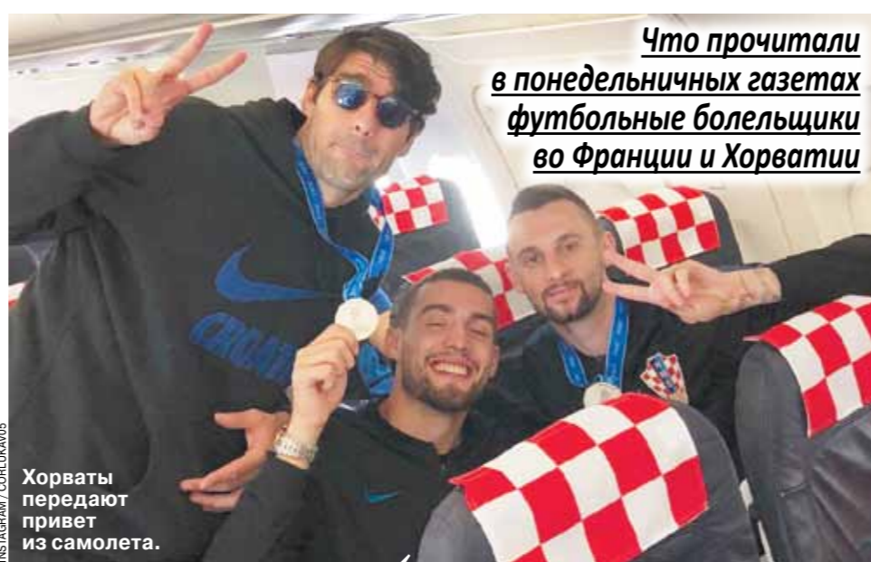
Хорваты передают привет из самолета.

Le Figaro в режиме онлайн в понедельник вела трансляцию чествования сборной Франции на главном парижском проспекте Елисейские Поля. «Нужно стоять 5 часов, чтобы увидеть их несколько секунд, но нам нетрудно: мы должны отблагодарить их!» — говорит мама целого семейства, которое прибыло сюда с рассветом. Издание отмечает, что народные четверостишия посвященные практически каждому игроку сборной Франции — их исполнение на мотив популярных песен, таких, как «Go West» из репертуара Pet Shop Boys или «Aux Champs-Élysées» Дидье Дасена, например, так: «Он маленький, он милый, он остановил Лео Месси, но его знают все — это обманщик Н'Голо Канте».