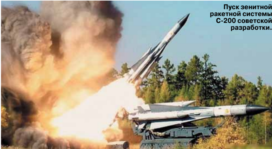
Пуск зенитной ракетной системы С-200 советской разработки.

Как Киев растерял лучшую на постсоветском пространстве противовоздушную мощь