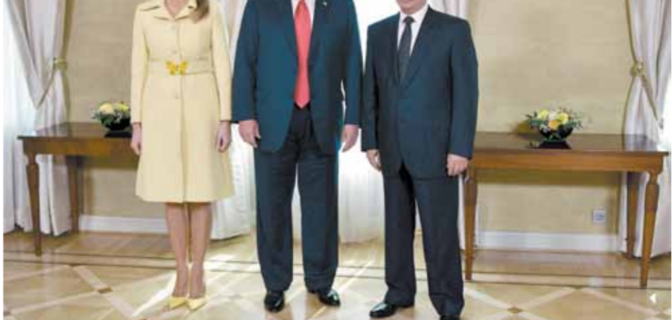
Стилисты Мелании Трамп, видимо, не сверились с прогнозом погоды и отправили свою подопечную в пальто. Для встречи в верхах был выбран наряд итальянского Модного дома Gucci стоимостью в 3700 долларов, дополненный шпильками лимонного цвета и поясом с бабочкой.