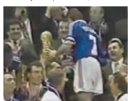
Дидье Дешам 20 лет назад и сейчас.

Правда это или просто изящная байка — я уточнять не стал. Тем более темнокожий канак давно, лет 6-7 как, уже развелся с белокурой словачкой (а жаль, какая пара была!). И поговаривают, что инициатором этого была именно она — погулять Карамбэ тот еще мастак.