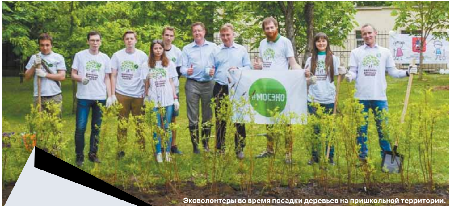
Эковолонтеры во время посадки деревьев на пришкольной территории.