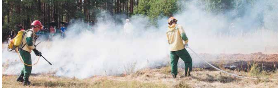
Во время тушения низового травяного пожара — пала.