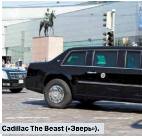
Cadillac The Beast («Зверь»).

Встреча тет-а-тет вместо запланированных 1,5 часа продолжалась чуть больше двух. И почти половину этого времени журналисты ждали начала следующего мероприятия — сначала в гардеробе для сотрудников дворца, потом во внутреннем дворике, причем многие — прямо на расклеванной солнцем гранитной плитке. Но многого они не дождалось. Все, что удалось увидеть, — это пустые тарелки и стеклянные бокалы, стоящие перед лидерами и присоединившимися к ним за рабочим завтраком членами