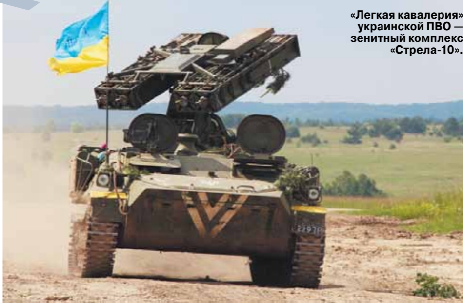
«Легкая кавалерия» украинской ПВО — зенитный комплекс «Стрела-10».