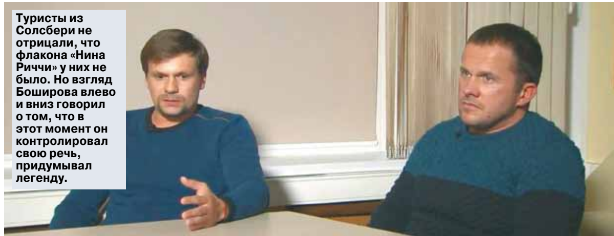
Туристы из Солсбери не отрицали, что флакон «Нина Риччи» у них не было. Но взгляд Боширова влево и вниз говорил о том, что в этот момент он контролировал свою речь, придумывал легенду.

Речь поведем, конечно, не об ура-патриотических агитках про комсомольцев-добровольцев и молодогоднейцев (хотя отрицать их