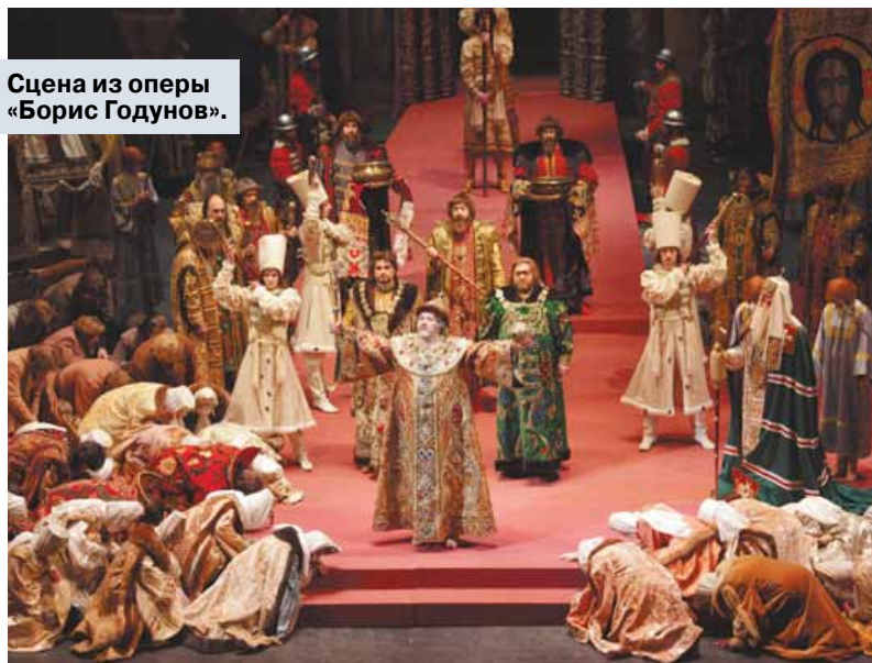
Сцена из оперы «Борис Годунов».

Итак, в 243-м сезоне ожидаются пять оперных и шесть балетных премьер. Уже 29 сентября на Исторической сцене Большого состоится первая премьера — оперетта «Кандид» на музыку Леонарда Бернстайна, которая специально поставлена к 100-летию