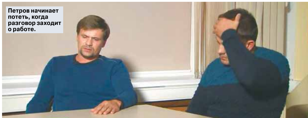
Петров начинает потеть, когда разговор заходит о работе.

Эксперт по лжи проанализировал интервью «отравителей» Скрипалей