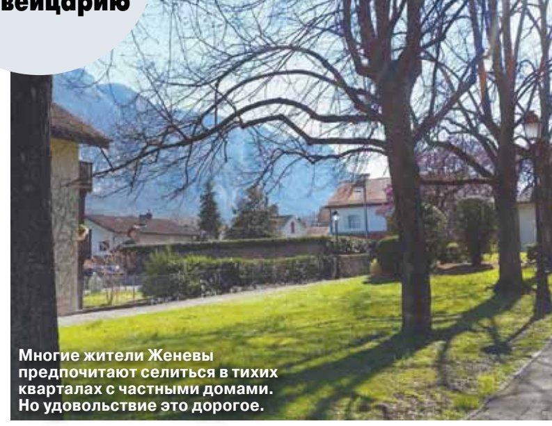
Многие жители Женевы предпочитают селиться в тихих кварталах с частными домами. Но удовольствие это дорогое.