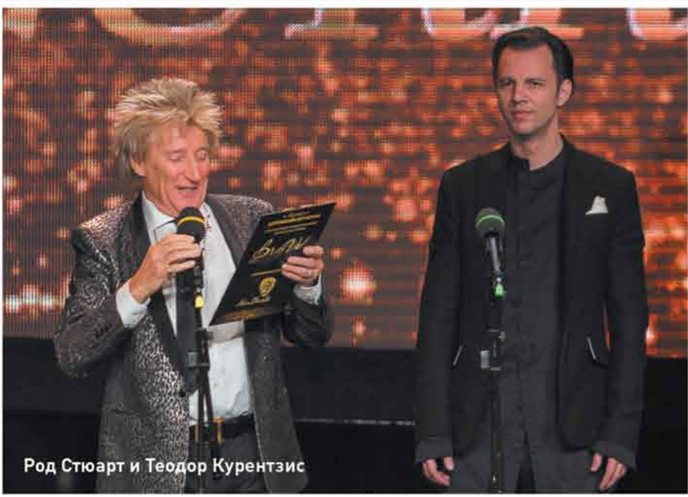
Род Стюарт и Теодор Курентзис

10 марта Государственный Кремлёвский Дворец принял церемонию вручения в области популярной музыки. Ведущими вечера стали: Елена Север и Филипп Киркоров, Зара и Николай Басков. Для участия в гала-концерте приехали многие иностранные звезды: легендарный Род Стюарт (Rod Stewart), многократный обладатель «Grammy» певец Сил (Seal), группа «Eurore», группа «Duran Duran», французская певица Zaz, всемирно известный итальянский певец Эрос Рамазотти (Eros Ramazzotti). Почетным гостем стал киноактер Энди Гарсиа (Andy Garcia). Зрители увидели выступления самых популярных российских артистов – как уже ставших кумирами многих поколений, так и молодых, восходящих звезд. Юрий Антонов, Филипп Киркоров, Валерий Меладзе, Николай Басков, Елена Север, Loboda, Зара, Сергей Лазарев, ЮрКисс, ВладиМир, Ани Лорак, Мария Вебер, группа «Serebro», группа «Queens» и многие другие подарили гостям Премии «BraVo» свои лучшие песни. Яркими акцентами стали номера самых популярных исполнителей из стран-партнёров Премии.