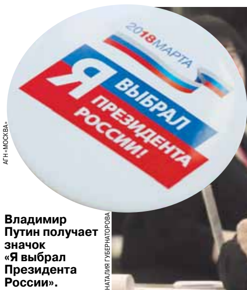
Владимир Путин получает значок «Я выбрал Президента России».