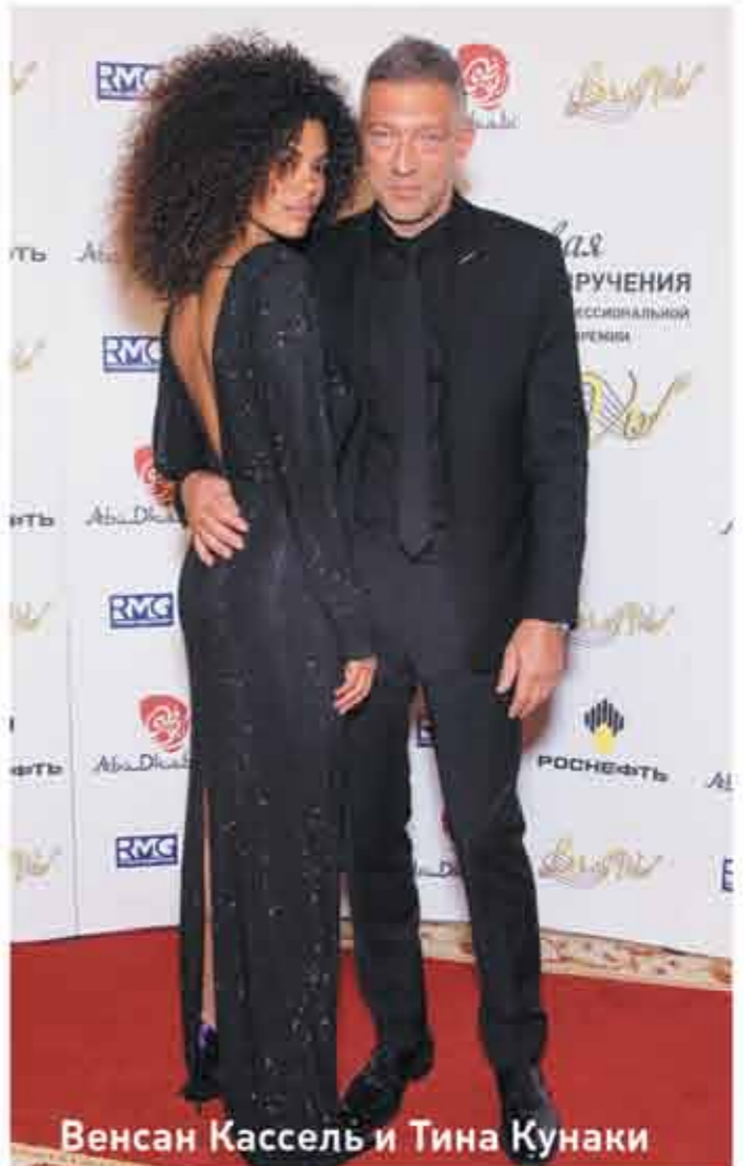
Венсан Кассель и Тина Кунаки