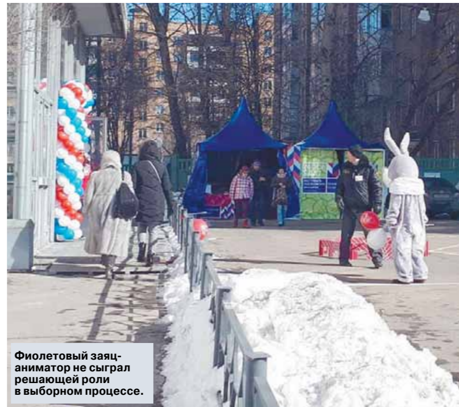
Фиолетовый заяц-аниматор не сыграл решающей роли в выборном процессе.

— Когда они видят, что мы на участке, то все обычно проходит нормально, — отвечает Максим и заодно формулирует главную функцию наблюдателя.