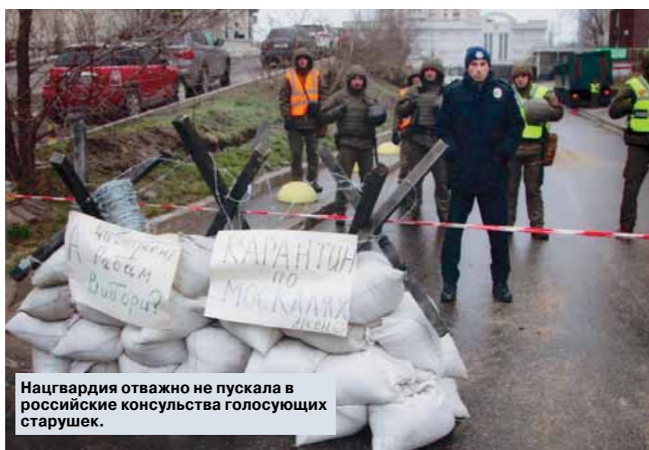
Нацгвардия отважно не пускала в российское консульство голосующих старушек.

Международные нормы избирательного права, согласно которым никто не может нарушить свободу выбора, говорите? Территория посольства является неприкосновенной согласно Венской конвенции о дипломатических сношениях? Ну да, ну да... Только не в стране, где Министерство иностранных дел возглавляет выпускник факультета астрофизики, а