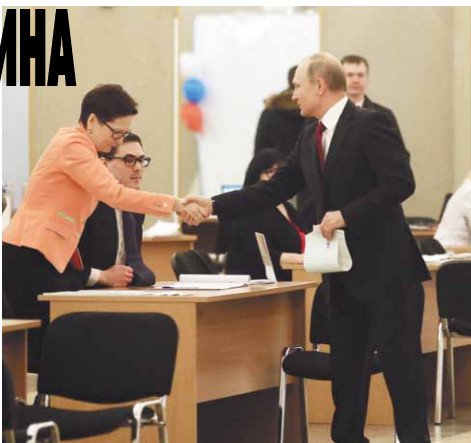
Оказывается, на участке, где постоянно голосует Путин, существует очередь среди членов УИКА, кто будет проверять его паспорт.