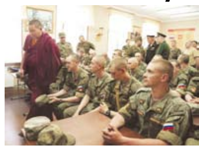
Совета, посетив 7-й отдельный мотострелковый полк 11-го армейского корпуса. Уроженцы Орла, Язани, Липецка, Подмосковья и даже челябинские ребята с честью служат, например, в зенитной батарее.

Общественный совет при Минобороны посетил главную военноморскую базу Балтфлота