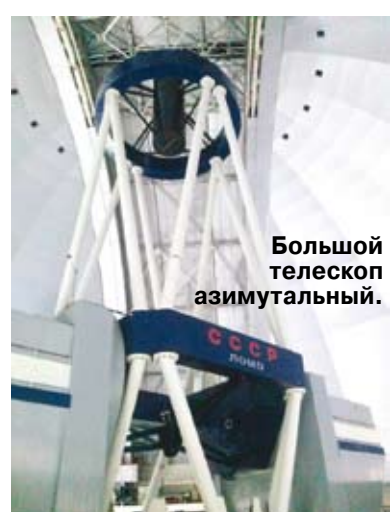
Большой телескоп азимутальный.

Сотрудники САО очень надеялись, что старое зеркало (№1), с которого должны были убрать 8-миллиметровый слой и переполитовать, обеспечит снижение рассеяния света в изображениях звезд и галактик. Ведь только благодаря высококачественному зеркалу можно получить четкие изображения небесных тел.