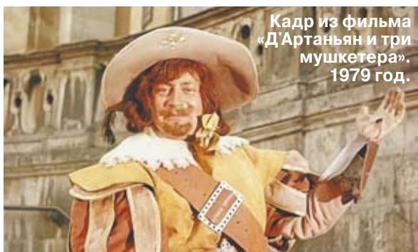
Кадр из фильма «Д'Артаньян и три мушкетера», 1979 год.