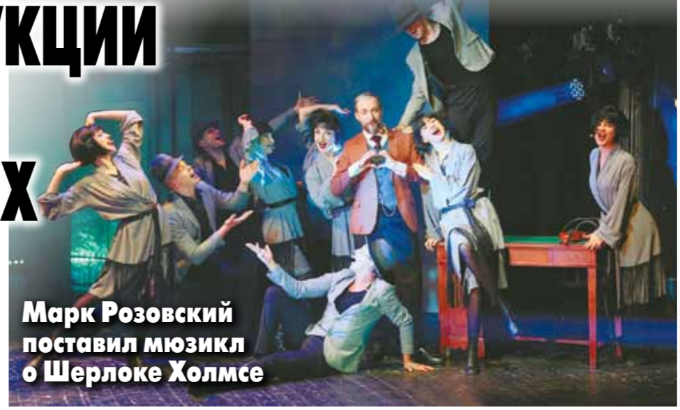
Марк Розовский поставил мюзикл о Шерлоке Холмсе