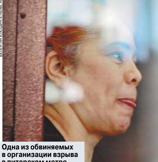
Одна из обвиняемых в организации взрыва в питерском метро.