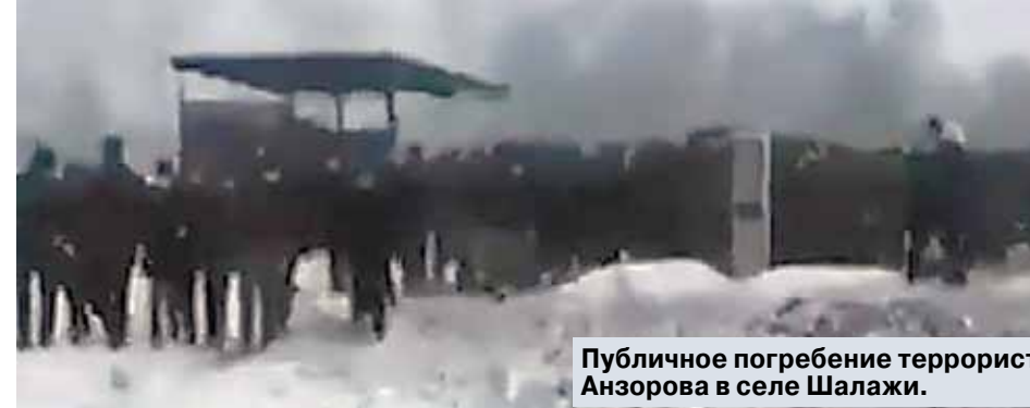
Публичное погребение террориста Анзорова в селе Шалажи.

предварительное следствие. Во Франции — да, другие законы. Во Франции «тела указанных лиц» выдаются родственникам, что произошло и в данном случае.