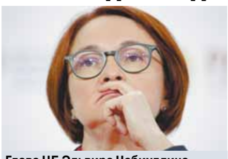
Глава ЦБ Эльвира Набиуллина.

закон в стране принят, и я ему ответил, что стоит попробовать. Но, честно говоря, я не уверен в успехе.