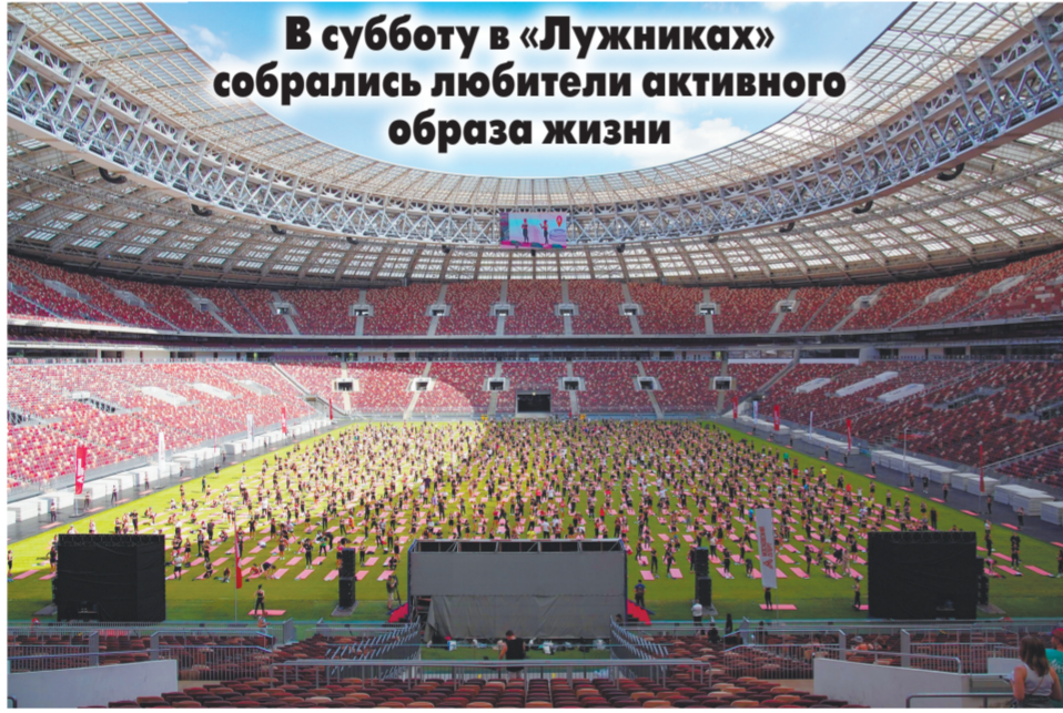
В субботу в «Лужниках» собрались любители активного образа жизни

Следующая площадка по-настоящему удивляет своей энергией, масштабом и исполнением. Под номером 14 на карте проходил Music city festival. «Правой! Правой! Давай-давай!» — командует известный спортивный блогер Самира Мустафаева. Она крутит педали велотренажера, от нее невообразимо