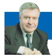
Петр ШЕЛИЦ, председатель Союза потребителей России