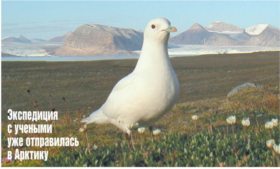
Экспедиция с учеными уже отправилась в Арктику

Несмотря на то что белая чайка — это морская кочевница по акватории Северного Ледовитого океана (она выходит на сушу только в период размножения), ученые выдвинули предположение, что последнее время чайкам не хватает корма на обжитых ими территориях. Из-за отступления льдов они даже в период гнездования вынуждены перелетать в другие места в поисках пропитания.