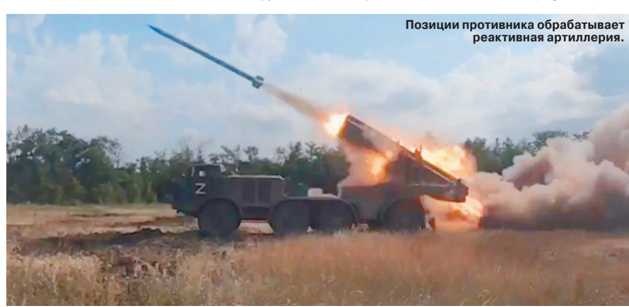
Позиции противника обрабатывает реактивная артиллерия.