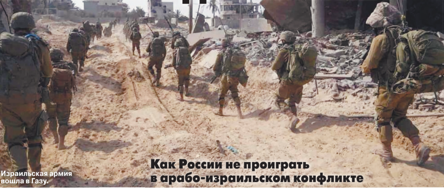
Израильская армия вошла в Газу.