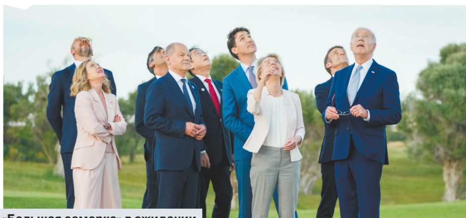
«Большая семерка» в ожидании парашютистов... 13.06.2024.

В прошедшие выходные горячо было на Харьковском направлении. Только в Волчанске ВСУ за сутки контрабанды десять раз.