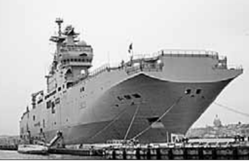
ет нас от России, что является ошибкой: эта страна должна оставаться важным партнёром Франции в контексте политики мира и сотрудничества. Поддержка санкций, следовательно, вредит интересам Франции и всех европейцев.

Французские и российские власти согласовали размеры компенсации за непоставки «Мистралей». Прямые потери для Франции составляют 850 миллионов евро плюс обслуживание двух ставших ненужными кораблей. В настоящих условиях отказ от чести исполнения этого контракта — не только удар по престижу Франции и её бюджету, но и новое подтверждение зависимости страны от США в области внешней политики, характерной для эпохи Николая Саркози. В современном геополитическом контексте производство вооружений и их продажа являются условием национальной независимости Франции. Эта проблема слишком серьёзна, чтобы обсуждать её без учёта военной доктрины и чёткой стратегии в интересах французского народа и под строгим контролем государства. Опасный и противоречивый правительственный альянс способствует консервации украинского кризиса. В то время как французское правительство бесстыдно продает оружие монархам Персидского залива, проводимая им политика двойных стандартов может вызвать только горькую иронию. Такое решение отдаля-