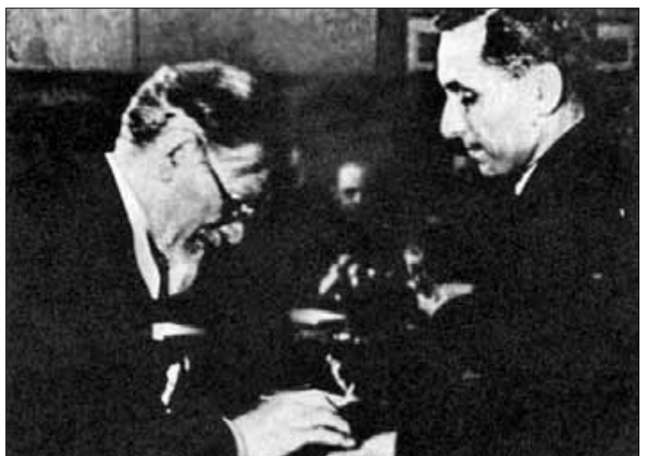
● Председатель Президиума Верховного Совета СССР М.И. Калинин вручает М. Зощенко орден Трудового Красного Знамени. 17 февраля 1939 г.

председателю Президиума Верховного Совета СССР М.И. Калинин вручает М. Зощенко орден Трудового Красного Знамени. 17 февраля 1939 г.