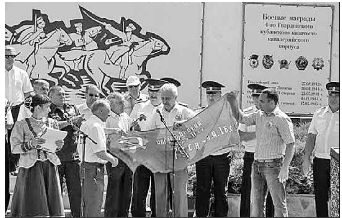
На мемориале «Поле казачьей славы», рядом со станцией Куцёвская, прошло торжественное мероприятие в честь легендарной атаки красной казачьей конницы в августе 1942 года.

патриотов, сражающихся на донецкой и луганской земле. Завершая выступление, лидер краевого отделения КПРФ вручил главе Куцёвского района и председателю Совета ветеранов копию Знамени Победы для мемориала казачьей славы.