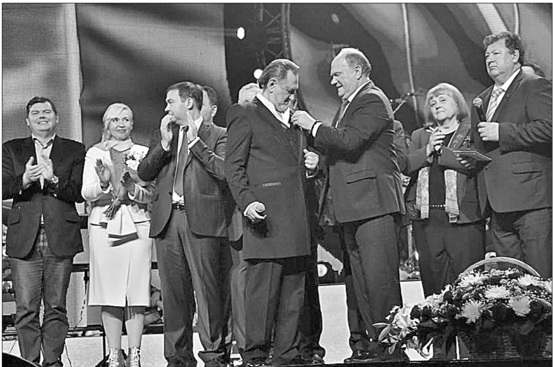
В Москве, в киноконцертном зале «Россия», 10 сентября, в день, когда столица праздновала свой 869-летие, состоялся организованный при поддержке Коммунистической партии Российской Федерации концерт «Широка страна моя родная» белорусского ансамбля «Сябры», приуроченный к 40-летию со дня начала его творческой деятельности. Художественный руководитель коллектива — народный артист Республики Беларусь Анатолий Ярмоленко выступил одновременно в роли ведущего.

ПЕРЕД НАЧАЛОМ концерта собравшихся приветствовал Председатель ЦК КПРФ Г.А. Зюганов. — Дорогие товарищи и друзья, наши любимые «Сябры», — сказал Геннадий Андреевич. — Здесь, в Лужниках, мы сегодня проводим вечер дружбы в день рождения нашей любимой столицы — города Москвы. Мы проводим его накануне двух великих партийных кампаний. Завтра в Белоруссии пройдут парламентские выборы, где наши друзья и товарищи по Союзу компартий выставили талантливую команду, которая предлагает вместе с нами программу возрождения нашей дружбы и нашего братства.