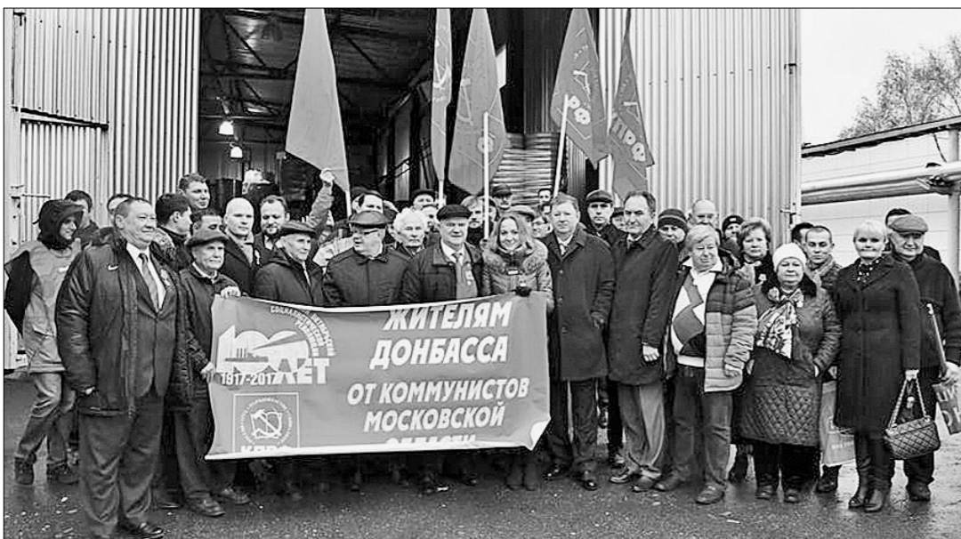
Пресс-служба ЦК КПКРФ. Фото Сергея СЕРГЕЕВА.