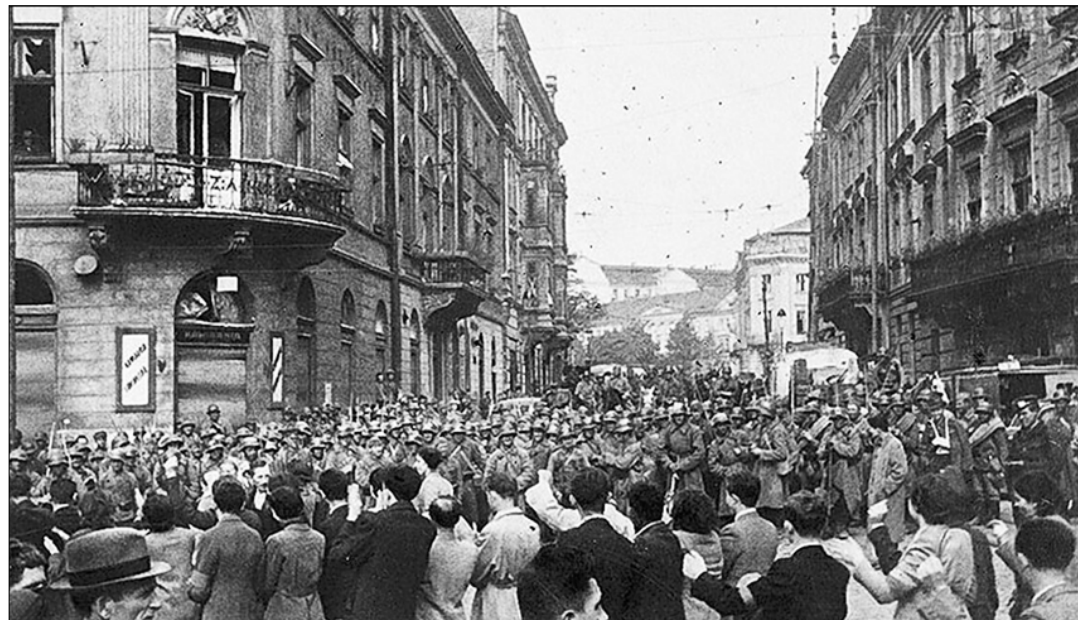
Население г. Львова приветствует войска Красной Армии, вступившие в город, 1939 г.

Много было сделано в сфере образования. В октябре — декабре 1939 года было открыто около 400 новых школ, 7 вузов с преподаванием на родном языке. К середине 1940 года действовало 6913 школ, в