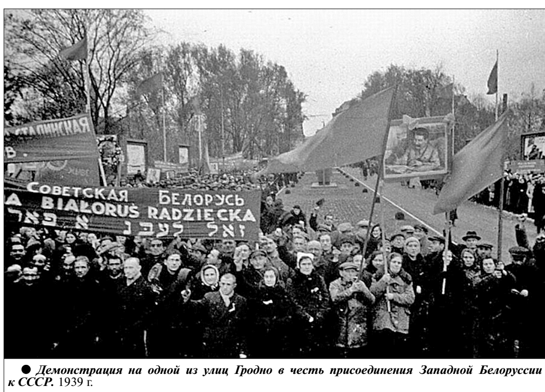
● Демонстрация на одной из улиц Гродно в честь присоединения Западной Белоруссии к СССР. 1939 г.

1 сентября 1939 года гитлеровская Германия напала на Польшу, правительство которой вскоре бежало в Лондон. В этих условиях СССР принял решение взять под защиту народы Западной Украины и Западной Белоруссии, отторгнутых в 1920 году. С этой целью 17 сентября 1939 года войска Красной Армии были введены на территорию Западной Украины и Западной Белоруссии.