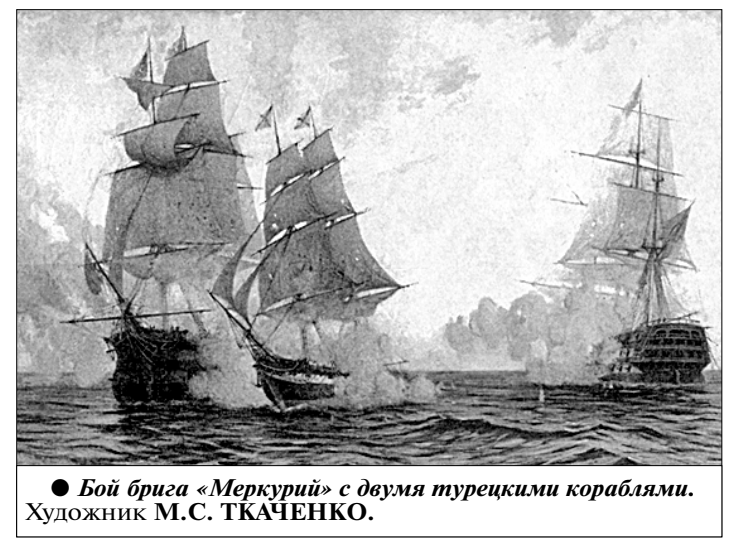
Бой брига «Меркурий» с двумя турецкими кораблями. Художник М.С. ТКАЧЕНКО.

Из этого изобильного специфическими морскими терминами длинного отчёта ясно главное: крошечный русский