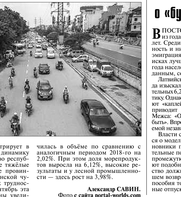
Александр САВИН. Фото с сайта portal-worlds.com

По сообщению новостного издания «Вьетнам экспресс», в последние два года ускоренными темпами развивается автомобильная промышленность социалистической республики. Сегодня работает свыше 40 производственных предприятий, ежегодно осуществляется сборка 680 тысяч машин. Основная в 2017 году компания VinFast должна стать первым независимым автопроизводителем в стране, ведь до недавнего времени к выпуску машин были причастны иностранные компании. СОГЛАСНО докладу министерства торговли и промышленности, рынок автомобильной промышленности во Вьетнаме растёт на 20—30% в год. Эксперты министерства прогнозируют: если удастся сохранить столь высокие темпы роста национального автопарка, то в ближайшее время СРВ обойдёт Филиппины — государство, занимающее в этой области одну из престижных позиций в регионе по производству и продаже автомобилей. Тем временем демонстрирует в нынешнем году хорошую динамику роста и сельское хозяйство республики, невзирая на крайне тяжёлые погодные условия в ряде провинций, проблемы с африканской чумой свиней и ряд других трудностей. Так, с января по сентябрь эта отрасль экономики страны увели-