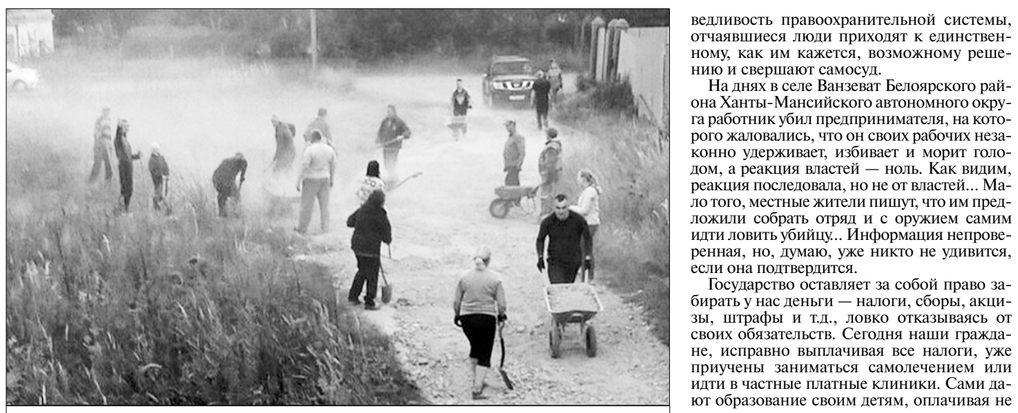
В Конейске Челябинской области жители устали дожидаться от администрации ремонта дороги.

Думаем, власти хотя бы благодарны людям за то, что они за свои средства и собственными силами выполняют работу, за которую ответственны чиновники? Ничуть не бывало! У перелавце-залесского пенсионера чиновники потребовали «вернуть дорогу в прежнее состояние» и подали на него в суд. А астраханским жителям выписали штраф на 25 тысяч рублей. В Москве власти снаесли детскую площадку, которую жители соорудили на личные деньги, потому что постройки «не соответствовали стандартам». А движение волонтеров, которые в 2011 году в выходные и на свои деньги тушили пожары или в свои отпуска спасали и