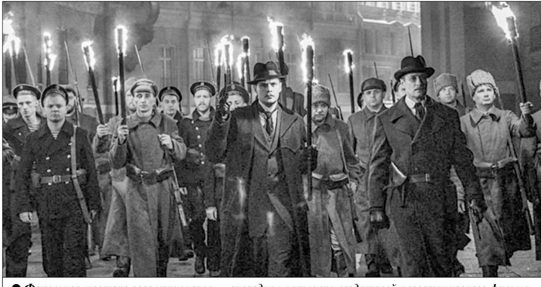
Факельное шествие революционеров — очередная натяжка создателей клеветнического фильма.