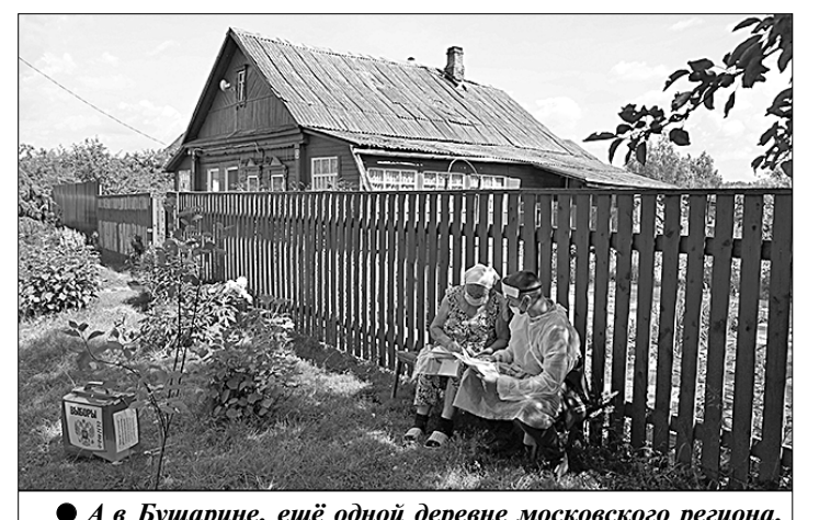
● А в Бушарине, ещё одной деревне московского региона, общение голосующего населения с членами избиркома происходит в режиме посиделок на завалинке, напоминающих консультацию врача и пациентов, в роли которых выступают доверчивые местные жители.