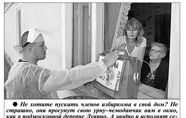
● Не хотите пускать членов избиркома в свой дом? Не страшно, они просят свою урну-чемоданчик вам в окно, как в подмосковной деревне Луцино. А заодно и исполнят сценарию о неопытном вкладе вашего голоса в сохранение национальной культуры и языка.