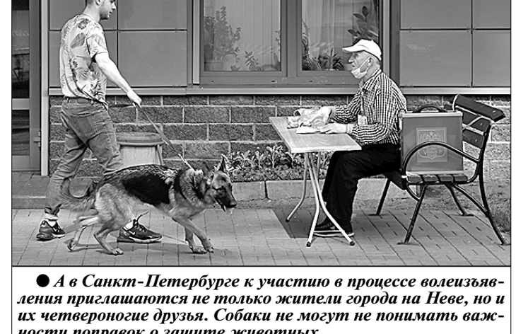
● А в Санкт-Петербурге к участию в процессе волеизъявления приглашаются не только жители города на Неве, но и их четвероногие друзья. Собаки не могут не понимать важности поправок о защите животных.