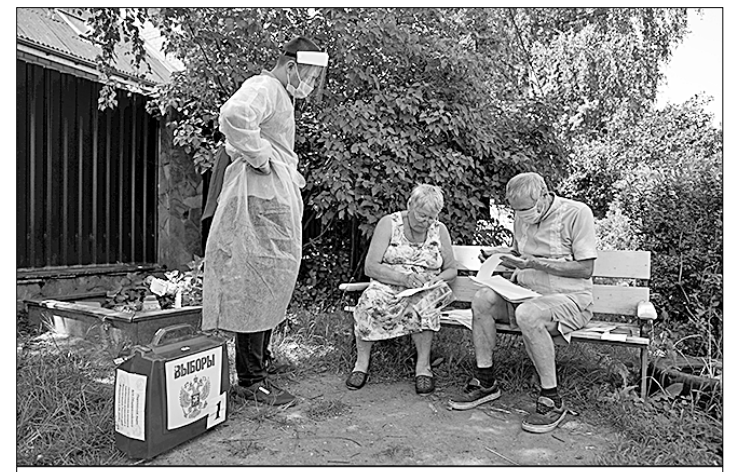
● Представители избиркома, чьё облачение ассоциируется с кипировочной техникой, занимающихся лечением пациентов с COVID-19, терпеливо ждут, пока сознательные граждане примут решение в отношении дальнейшей судьбы России.