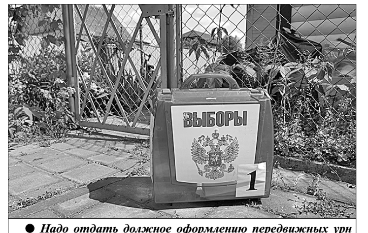
● Надо отдать должное оформлению передвижных урн для голосования: дизайн этих ящичков продуман с учётом нынешней эпидемиологической ситуации в стране и не случайно напоминает медицинский чемоданчик, где вместо красного креста красуется двуглавый орёл. Возможно, именно в Рязани, откуда прислан этот снимок, в будущем появятся памятник исторической избирательной урны.