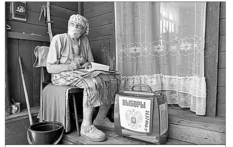
● Лето, жара, пандемия... Никому не охота тащиться на избирательные участки, чтобы выразить своё волеизъявление. Не беда: растронные члены избиркома сами придут к вам домой с передвижными урнами для голосования, а заодно, как пенсионерам из деревни Троицкое московского региона, разъяснят, где поставить заветную галочку.