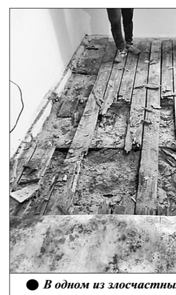
В одном из жилых домов для переселенцев.